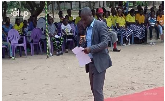
Le président du CPJ-Agou sensibilisant l'assistance

Placée sous le thème « Des clics au progrès : les parcours numériques des jeunes pour un développement durable », cette journée a permis de sensibiliser et d'inviter les jeunes du milieu à s'impliquer davantage dans l'utilisation des numériques pour un développement durable. La célébration a débuté par une caravane qui a sillonné les artères de la localité avant de chuter dans la cour de l'EPP Agbavé où les activités de la journée se sont déroulées.