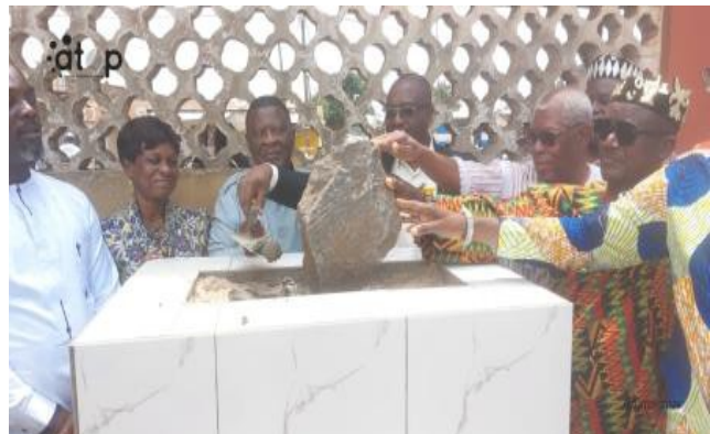
Cérémonie de pose de la première pierre

L'immeuble, une conception du cabinet d'architecture "COSMOS GROUP", est un ensemble à trois niveaux (R+2), composé des bureaux, des halls d'accueil, une salle commune et une salle de réunion avec possibilité d'accès facile aux personnes en situation de handicap moteur.