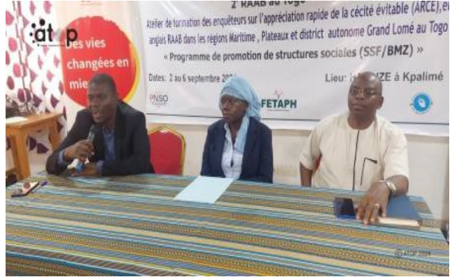
...au message du coordonnateur du PNSO (micro)