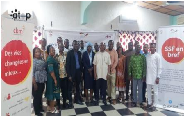
Les participants pour la photo souvenir

structures sociales (SSF) cofinancé par CBM et la BMZ. Il s'agit de former ces spécialistes pour une enquête sur le terrain qui se fera en deux phases. D'abord armer les participants avant de les envoyer sur le terrain dans les communautés pour la recherche des causes de la cécité et de la déficience visuelle chez les personnes indiquées.