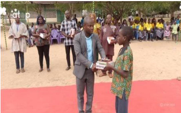
Le président remettant le kit scolaire à un élève

Agou-Gadzépé, 3 sept. (ATOP) - Une journée de réflexion a été organisée par le Conseil préfectoral de la jeunesse d'Agou (CPJ-AGOU) en collaboration avec le comité d'organisation Dunenyozan d'Agbavé dans le cadre de la célébration en différé de la Journée internationale de la jeunesse, le samedi 31 août à Agbavé dans la commune Agou1. C'était en présence des autorités politiques, administratives, religieuses et traditionnelles.