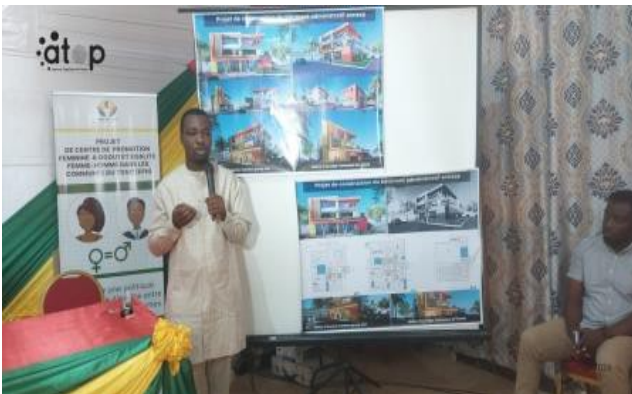
Le représentant de COSMOS GROUP présente la maquette du bâtiment

Tsévié, 3 sept. (ATOP) – Le préfet du Zio, Etsè Kodjo Kadévi et le maire de la commune Zio 1, ont procédé le lundi 2 septembre, à la pose de la première pierre d'un nouveau bâtiment administrative à la mairie de Tsévié.