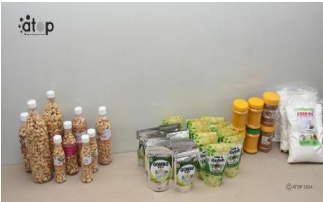
Échantillons de produits exposés

« Une série de formations est lancée sur toute l'étendue du territoire à travers la composante 3 du programme (ProComp) en vue de contribuer aux efforts du gouvernement prévus dans l'axe 3 de sa feuille de route 2020 – 2025, en dotant les chefs des TPME, des informations spécifiques nécessaires pour faciliter leur positionnement stratégique et accès aux marchés internationaux et ceux porteurs », a précisé Dr. Lakoussan.