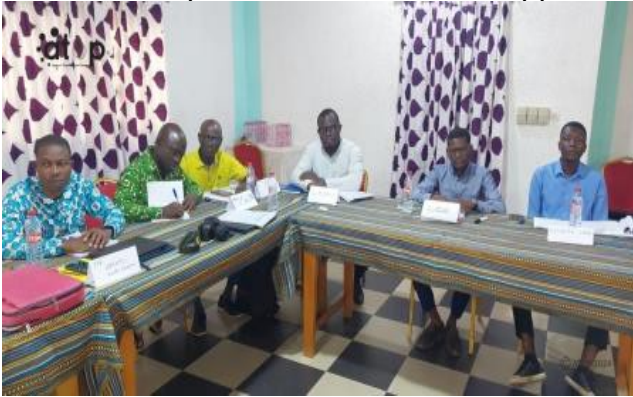
Les participants attentifs...

a invité les participants à prendre les dispositions pour que les gens n'arrivent jamais à ce stade avant que le créateur ne les rappelle à lui.