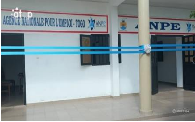
Antenne ANPE -Aneho

chômage et le sous-emploi des jeunes et accroître la productivité et la compétitivité des entreprises. Cette agence va offrir aux communautés des services d'accueil, d'orientation professionnelle, de formation en technique de recherche d'emploi, d'intégration en entreprise et en Soft Skills et de placement en entreprise. Il aura également pour charge de l'aide d'appoint en fonction des besoins spécifiques, de recrutement et d'information sur le marché du travail, l'appui à l'amélioration de l'employabilité des chercheurs d'emploi et la promotion de l'entreprenariat puis l'élaboration du business plan.