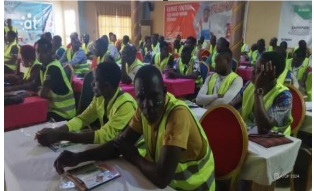
Vue partielle des peintres