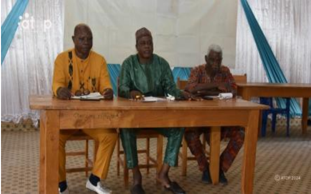
Table d'honneur avec le préfet Kourah entouré du maire (gauche) et d'un cadre du milieu

Les échanges ont porté entre autres sur les questions sécuritaires, le rôle et la responsabilité de chaque leader communautaire dans la préservation du climat de paix, l'entrée clandestine des peuhls nomades avec la complicité de certains autochtones et des peuhls sédentaires, ainsi que les actes de braquage et d'enlèvement qui s'opèrent entre les peuhls.