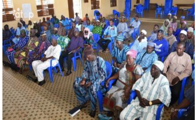
Vue partielle de l'assistance

Le préfet a rappelé aux participants l'existence des lois relatives à la répression des mauvais actes : la non dénonciation des personnes mal intentionnées, la complicité dans la commission des actes malsains (le banditisme, le rançonnage, le vol à main armée, le braquage et l'assassinat). Il a invité chacun à jouer correctement sa partition dans la préservation et la consolidation du vivre ensemble puis à relayer les informations dans leurs localités respectives afin de venir à bout de l'insécurité pour un mieux-être dans Doufelgou.