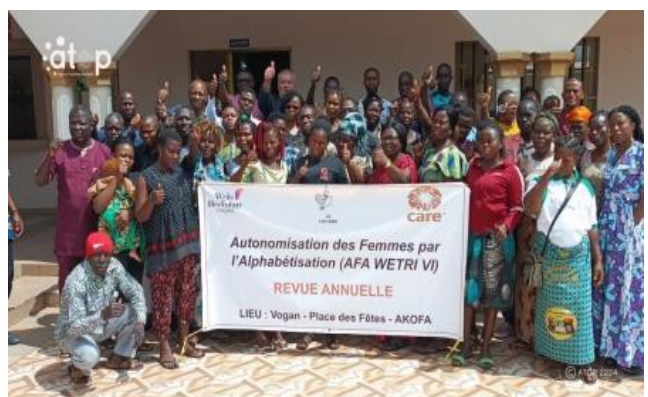
Des participants à l'atelier de revue annuelle

Organisé par l'Ong "La Colombe", l'atelier a regroupé des alphabétiseurs, des catalyseurs, des membres des comités d'alphabétisation, des chefs projet, des superviseurs, des formateurs, des autorités régionales et préfectorales du ministère de l'Action sociale, de la solidarité et de la promotion de la femme. Le projet est financé par l'association Lancome et Care France en partenariat avec Care Bénin/Togo et est exécuté dans la préfecture de Vo. L'objectif est de faire le bilan des activités menées sur une période de deux ans (août 2023 à juillet 2024) sur les quatre ans que le projet va durer.