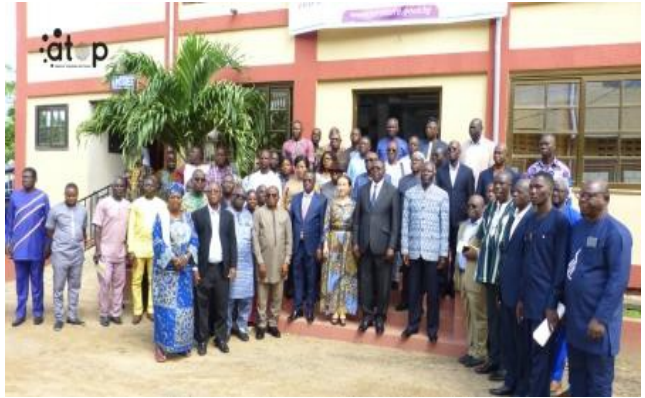
Les participants et les officiels

La tournée nationale qui s'étend aux autres régions du pays, prendra fin le 20 octobre prochain. ATOP/BH/TAL/GKM