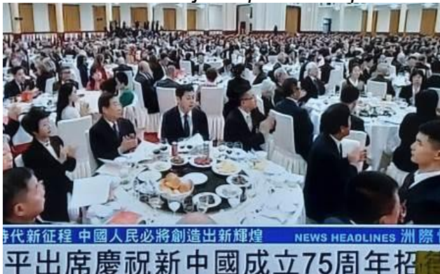
Les invités à la rencontre

Cette guerre les opposait aux forces rivales de la "République de Chine", qui se sont réfugiées avec de nombreux civils à Taïwan, une des seules parties du territoire national alors non conquises par les communistes. « Taïwan est un territoire sacré pour la Chine. Les gens de chaque côté du détroit de Taïwan ont des liens de sang, et ces liens familiaux seront toujours plus forts que les autres », a souligné Xi Jinping.