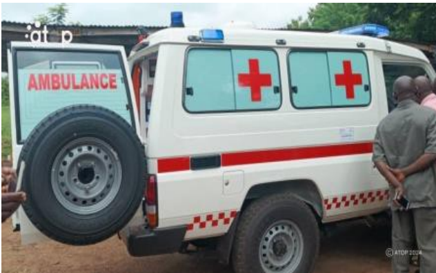
L'ambulance présentée au populations

Elavagnon, 3 oct. (ATOP) - Quatre formations sanitaires de l'Est-Mono (la polyclinique d'Elavagnon, l'hôpital de l'Ordre de Malte d'Elavagnon, les CMS de Nyamassila et de Morétan) ont bénéficié du matériel médical le mardi 1 er octobre dans la localité.