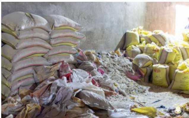
Riz avarié

Lomé, 3 oct. (ATOP) - Les autorités togolaises ont mis en garde, le mercredi 2 octobre, la population contre la consommation d'un riz avarié en circulation, récupéré illégalement dans une décharge située à Agoè Ahonkpoè, dans la commune d'Agoè-Nyivé 2.