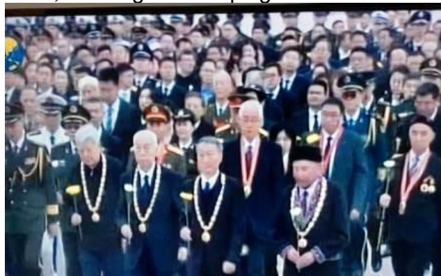
Autorités et chefs d'Etats présents

Le président Chinois a, par ailleurs, exhorté à "s'opposer avec force aux activités séparatistes de ceux qui militent pour l'indépendance de Taïwan".