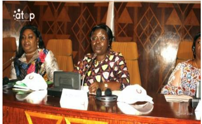
La ministre Zinsou-Klassou (milieu) ouvrant les travaux

L'ouverture des travaux a été co-présidée par la ministre de l'Action sociale, de la Solidarité et de la Promotion de la femme, Mme Zinsou-Klassou Akossiwa et la présidente du parlement de la CEDEAO, Mme Memounatou Ibrahima.