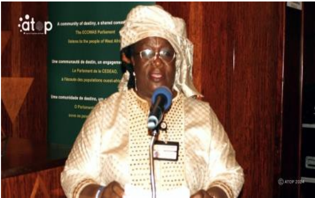
La présidente de l'ECOFEPA

Les activités ont porté sur des communications, notamment « Instaurer la confiance en partageant des récits authentiques et pertinents qui montrent la vulnérabilité, en partageant des interventions commerciales personnelles, en montrant comment les opportunités financières ont eu un impact positif sur les femmes pour inciter les délégués vers la libération » ; « Point sur le groupe de travail mondial visant à autonomiser un million de femmes dans le secteur du commerce par des chefs d'entreprise internationaux Washington DC. Leçons à tirer pour les délégués sur les possibilités de devenir bénéficiaires de l'initiative » ; « Favoriser l'inclusion financière des femmes pour une meilleure autonomisation du Togo » et « Le point sur le financement des startups innovantes et des petites et moyennes entreprises ».