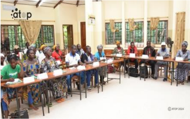
L'assistance attentive aux mots...

d'emplois dans le secteur agricole et les services annexes tels que la maintenance des machines.