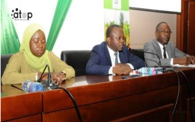
Le président Botré (milieu) s'adressant ...

La rencontre vise à familiariser les participants avec les principes de la normalisation ; présenter la procédure d'élaboration des normes ; mettre en place les différents comités techniques avec les bureaux respectifs. Il s'agit aussi de présenter les besoins en norme recueillis selon les filières prioritaires ; de partager la liste des normes prioritaires à élaborer selon les filières et de définir les prochaines étapes.