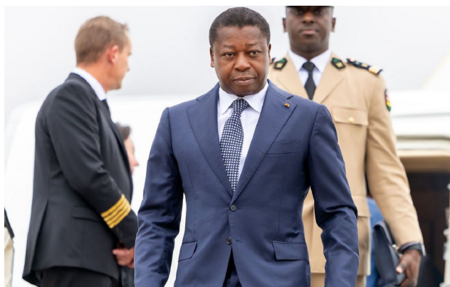
Président du conseil

Lomé, 14 oct. (ATOP) - Des chefs d'Etat et de gouvernement, parties prenantes au processus d'Aqaba, une initiative anti-terroriste lancée en 2015, se réunissent le mardi 15 octobre à Rome (Italie), pour un sommet sur la crise sécuritaire en Afrique de l'Ouest. Le Président du Conseil, Faure Gnassingbé, prend part aux travaux de ce sommet de haut niveau, selon un communiqué de la présidence du conseil.