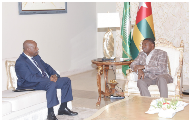
Le Président Faure échange avec M. Leonardo

Au cœur des échanges figurent les efforts de paix, la coopération régionale et les enjeux de développement dans la sous-région ouest-africaine et au Sahel.