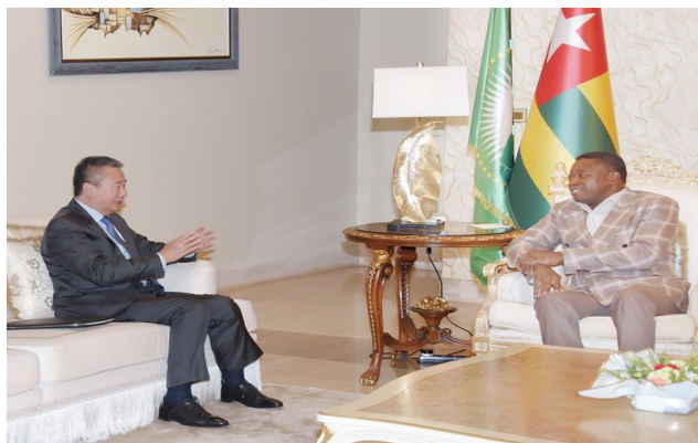
Président du Conseil et M. Huang Xia

Lomé, 14 oct. (ATOP)- Les efforts du Togo en faveur de la stabilité en Afrique continuent d'émerveiller les institutions régionales et internationales également engagées dans ce domaine. L'envoyé spécial du Secrétaire général des Nations unies pour la région des Grands Lacs, Huang Xia, l'a encore confirmé le dimanche 12 octobre, lors d'une rencontre avec le Président du Conseil, Faure Essozimna Gnassingbé.