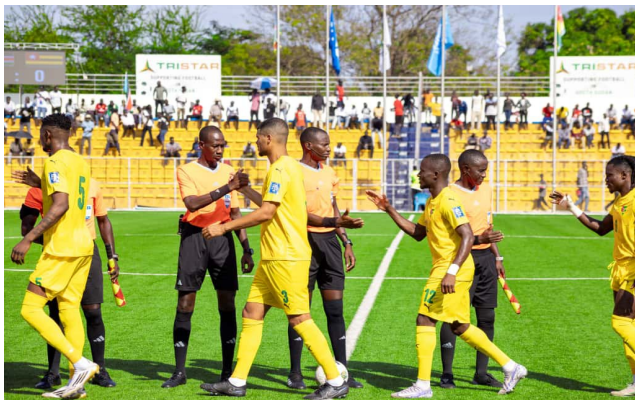
Les éperviers saluant les officiels