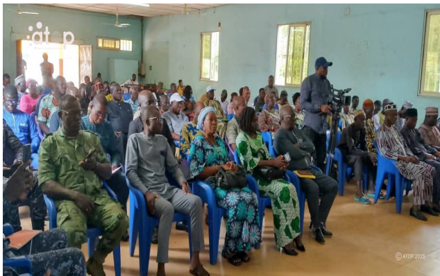
Vue en partie de l'assistance en la salle

exprimés dans chaque localité, en vue de favoriser une planification territoriale participative et concertée, pour garantir une meilleure équité dans la répartition des ressources.