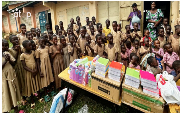
Les bénéficiaires devant le don

Cette action de solidarité de l'association ACA vise à soutenir la scolarisation des enfants issus des foyers défavorisés et à promouvoir l'excellence en milieu scolaire. Ces kits scolaires sont composés de 200 cahiers de 200 pages, 400 cahiers de 100 pages, 142 gourdes d'eau, de 350 stylos à bille et 12 paquets de feutre. On y trouve également 108 autres kits constitués d'ardoises, crayons de couleurs, tableau de calligraphe, gommes, craies, chiffons, stylos et taille crayons, destiné aux 117 élèves de l'EPP Nandadè dont 10 du préscolaire.