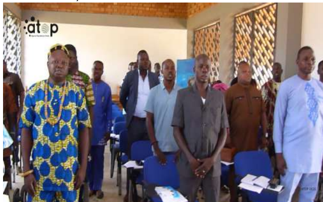
Début de la session à Asrama

Ces sessions donnent droit aux élus locaux d'approfondir les études de faisabilité des différents projets validés lors de l'élaboration des budgets, de mobiliser les ressources afférentes, de visiter les sites réservés aux investissements, entre autres.