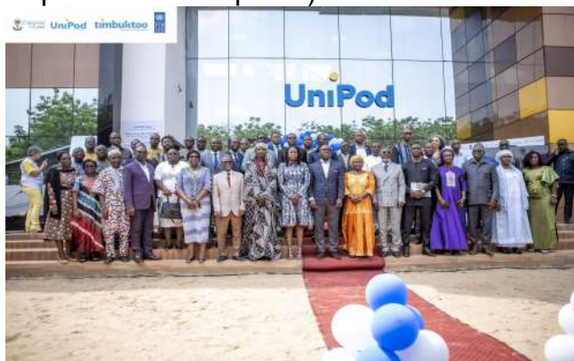
Inauguration de Unipod-Lomé

Le ministère de l'Enseignement supérieur et de la Recherche a dévoilé le vendredi 3 octobre, la liste officielle des établissements reconnus et agréés par l'Etat. En tout, 97 établissements, dont 04 publics (Université de Lomé, Université de Kara, Centre International de Recherche et d'Etude de Langues-Village du Bénin, Ecole Nationale Supérieure d'Atakpamé).