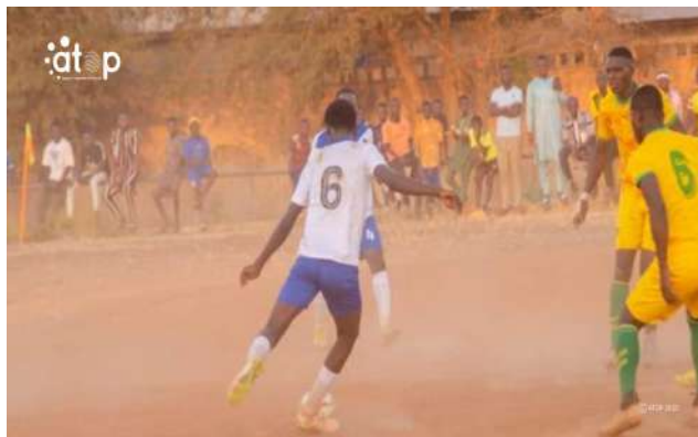
Une séquence de jeu