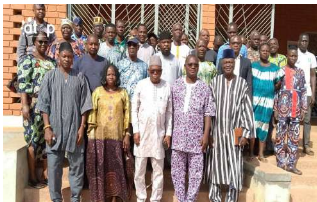
Les conseillers de Binah 2 avec les officiels et invités

Les conseillers municipaux vont également réfléchir sur les stratégies de mobilisation des ressources, de communication municipale et d'introduction d'outils modernes de planification. Les élus auront également à visiter des chantiers pour évaluer la qualité et l'effectivité des investissements communaux, sensibiliser les chauffeurs pour une meilleure gestion des gares routières.