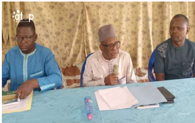
Le préfet (milieu)

Les visites de terrain notamment le stade municipal de la localité, l'hôtel de Pagouda, le marché de Kondi et de Madjatom, et des femmes orpailleuses de la rivière Binah sont aussi inscrites dans l'agenda des activités de cette session. Les conseillers municipaux vont, en outre, réfléchir sur l'intercommunalité entre Binah 1 et Binah 2.