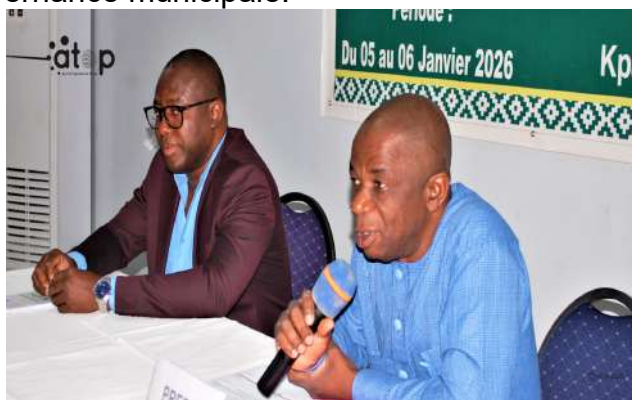
...au discours du préfet (micro)

La rencontre est initiée par l'Agence nationale de formation des collectivités territoriales (ANFCT). Elle vise à expliquer aux participants les enjeux et objectifs de la décentralisation et leur fournir les informations nécessaires à l'appréhension des lois de la décentralisation pour une meilleure prise de décisions.