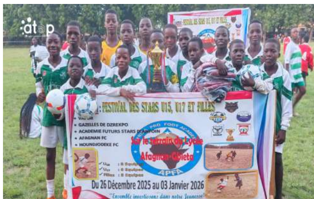
L'équipe APFA des garçons U15, vainqueur

Quant aux garçons U17, c'est ABS Foot de Tabligbo qui s'est imposé devant Aigle de Hompou par 4 tirs au but contre 1. Au temps réglementaire, le score était d'un but partout.