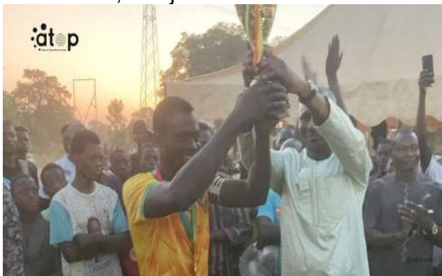
Le préfet remet le trophée au capitaine de Gouloungoussi

En dehors du trophée ravi par l'équipe gagnante, tous les clubs sont repartis avec des ballons, des jeux de maillots et des médailles.