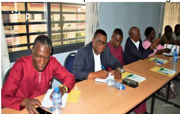
Les acteurs communaux attentifs...

Kpalimé, 6 jan. (ATOP) - Les acteurs communaux de la décentralisation des communes de Kloto, ont pris part, les 5 et 6 janvier à Kpalimé, à un atelier de formation sur leurs rôles et responsabilités dans la gouvernance municipale.