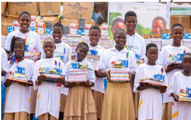
Des bénéficiaires du projet SWEDD+

Plus de 100 000 élèves du primaire, du collège et du lycée public ont bénéficié, pour cette rentrée académique, des kits scolaires grâce au Projet d'autonomisation des femmes et du dividende démographique plus (SWEDD+ Togo), financé par la Banque mondiale et avec l'appui de l'UNFPA. Cette initiative couvrira environ 800 localités et vise à favoriser le maintien des filles à l'école et à réduire les inégalités éducatives. Outre ce projet qui a permis d'offrir de kits à des élèves, le gouvernement et autres acteurs ont fait don de fournitures scolaires et de matériel didactique aux élèves nécessiteux et à des établissements scolaires à travers le pays.