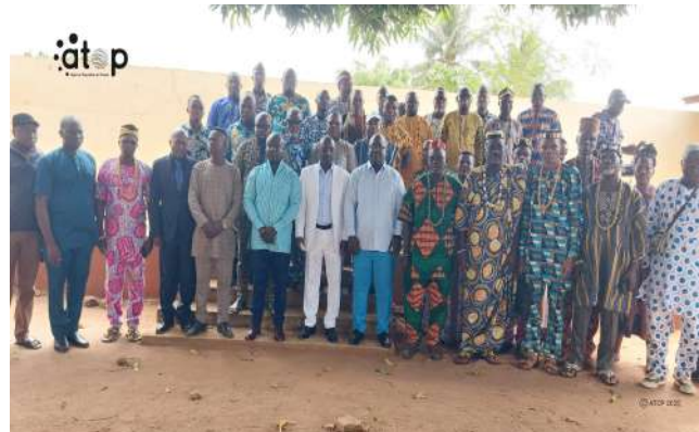
Les participants après l'ouverture des travaux