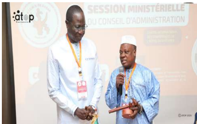
Le nouveau PCA de l'EISMV (au micro)

Le secteur éducatif a été marqué en 2025 par des réformes et autres actions importantes visant à améliorer la qualité de l'enseignement surtout au niveau du primaire et du secondaire 1 et 2. La mise en place de classes scientifiques expérimentales pour les niveaux de 4 e et 3 e ; le renforcement du suivi pédagogique des enseignants ; l'amélioration de la transition entre le primaire et le collège, l'Opération rentrée sûre 2025 ; la gestion de la présidence du conseil d'administration de