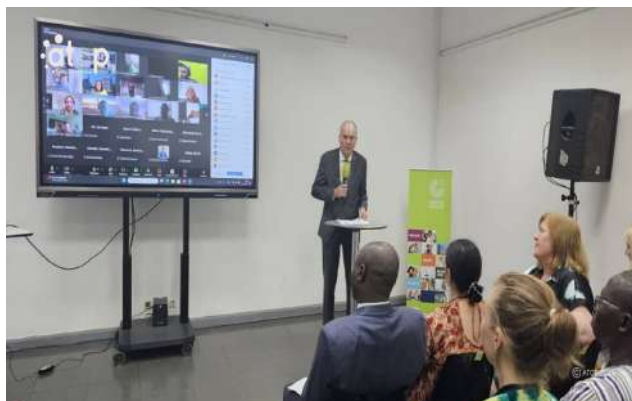
Conférence de présentation de nouveaux manuels d'Allemand

Du 21 au 24 octobre, les nouveaux manuels scolaires d'allemand Und jetzt Wir ont été présentés lors d'une conférence internationale organisée par le Goethe-Institut Togo en collaboration avec le Goethe-Institut Cameroun. Ce nouveau manuel vient remplacer l'ancien Ihr und Wir , utilisé depuis près de dix ans. Son contenu répond à de nombreuses interrogations relatives aux réformes éducatives, aux nouveaux contenus ainsi qu'aux approches pédagogiques et didactiques qui visent à améliorer la qualité de l'enseignement.