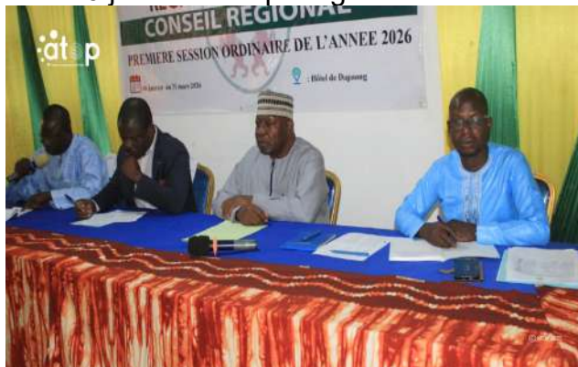
La table d'honneur

Ces assises seront consacrées à l'examen des dossiers essentiels pour le développement de la région. Il est question aussi d'évaluer le chemin parcouru, d'identifier les défis persistants et de définir des orientations pour renforcer l'impact des interventions sur le terrain.