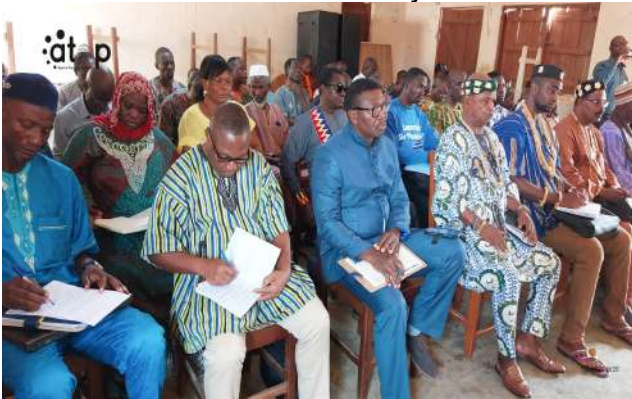
Les participants écoutant ....

Badou, 7 jan. (ATOP) - La 1 ère session ordinaire de l'année de la commune Wawa 1 s'est ouverte le mercredi 7 janvier à Badou.