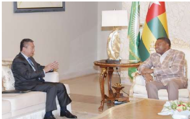
Envoyé spécial du Secrétaire Général de l'ONU avec M. Gnassingbé