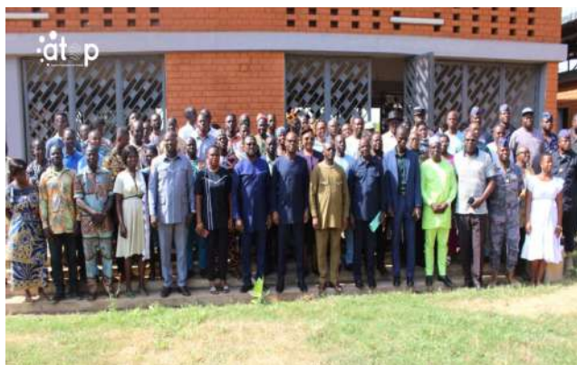
Les participants à Blitta

Blitta-Gare, 7 jan. (ATOP) - Les communes Blitta 1 et 2 ont ouvert leur première session ordinaire de l'année 2026 les 5 et 6 janvier à Blitta-Gare et à Agbandi. Les travaux sont consacrés aux amendements des procès-verbaux de leur quatrième session ordinaire de 2025.