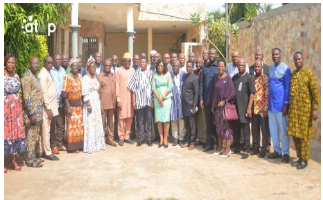
Les conseillers régionaux et autres acteurs

De même, il est programmé un aperçu du compte administratif 2025, une présentation du rapport d'activité de la cellule de gestion des marchés publics et l'état des lieux des différents projets de 2025. Un point sur le travail des commissions permanentes avec la possibilité de faire venir un expert de la Direction de la décentralisation et des collectivités locales (DDCL), la présentation des résultats du concours sur la charte graphique puis l'adoption de la charte graphique de la région Maritime meubleront également les travaux de cette première session ordinaire du CRM.