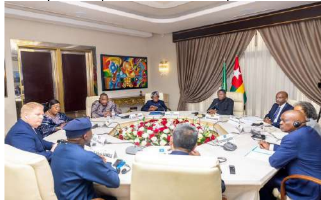
Panel des acteurs de la crise Rwanda - RDC

La réussite de cette médiation couplée de l'organisation réussie en octobre dernier de la deuxième édition du Forum de Lomé pour la paix et la sécurité en Afrique a encore renforcé la confiance du pays vis-à-vis de ses pairs. Le ministre des Affaires étrangères du Mali, Aboudoulaye Diop, porte-parole des ministres des affaires étrangères de l'AES a déclaré « Nous sommes venus exprimer notre appréciation sincère et nos chaleureuses félicitations au Président Faure Gnassingbé pour le rôle que joue le Togo en tant que terre d'accueil, de dialogue, de tolérance et de paix ».