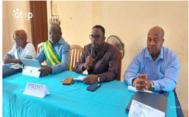
...le préfet Soménu (2 e à droite)

Cette session permettra aux conseillers municipaux de la commune, de faire l'amendement du rapport de la dernière session de 2025, de revoir l'état d'avancement de la mise en exécution des décisions prises lors de cette dernière session, de réfléchir sur les stratégies de mobilisation de ressources et de faire des descentes sur le terrain pour constater de visu l'effectivité des différents chantiers enclenchés en 2025.