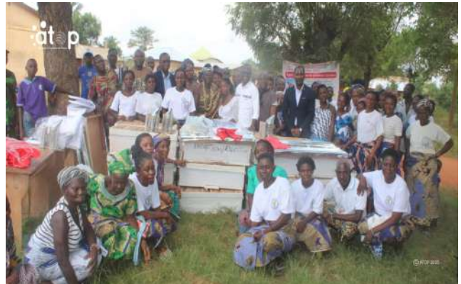
Des responsables du projet et des groupement bénéficiaires

Cette formation entre dans le cadre du sous projet « Contribution à la restauration des anciennes carrières de phosphate dans le canton d'Akoumapé à travers la mise en place des plantations à vocation bois énergie ». Ce dernier s'inscrit dans la phase 2 du programme Renforcement de la résilience au changement climatique dans les communautés côtières du Togo (R4C-Togo).