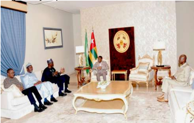
Les chefs de la diplomatie des pays de l'AES reçus par Faure Gnassingbé

de l'AES. Une mission très délicate que Faure Gnassingbé a conduite avec tact et sagesse jusqu'à désamorcer la crise entre les deux parties (CEDEAO et AES).