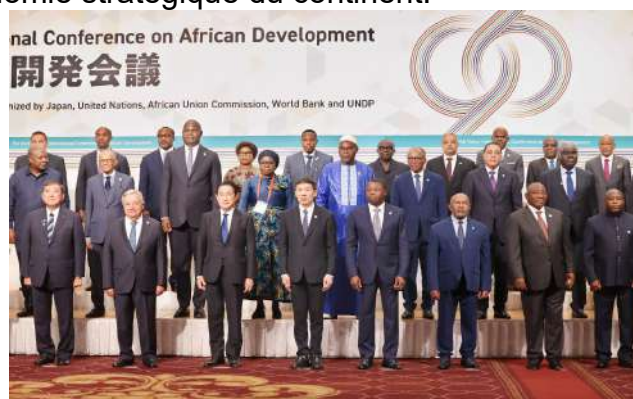
PC et les participants à TICAD

La voix du Togo n'a pas manqué au cours des différentes rencontres sur des enjeux régionaux et mondiaux de développement. En témoigne la participation active de la délégation togolaise conduite par le Président du Conseil, Faure Gnassingbé à la conférence internationale de Tokyo pour le Développement de l'Afrique (TICAD) du 20 au 22 octobre. Sur le même registre on peut se rappeler la participation du Togo à la définition de nouveaux partenariats de coopération entre l'Europe et l'Afrique au 7 e sommet UE-UA tenu en Angola les 24 et 25 novembre. Les approches de solutions et l'expression de ses positions face aux problématiques contemporaines font parler de ce petit pays de l'Afrique occidentale comme un géant diplomatique. A Berlin, les 11 et 12 novembre ont eu lieu des négociations intergouvernementales sur la coopération au développement entre l'Allemagne et le Togo.