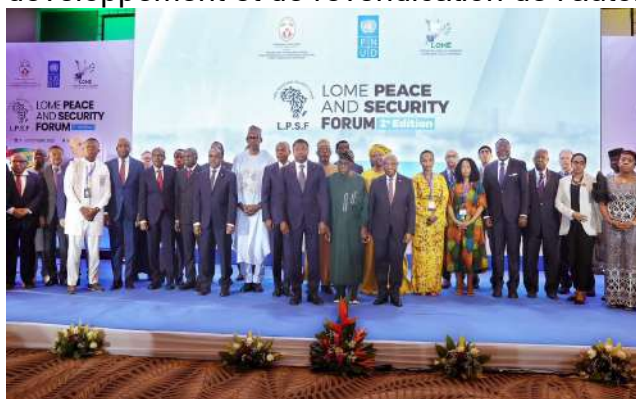
Les officiels Lomé Peace and Security Forum

La seconde rencontre internationale que le Togo a encore abrité l'année dernière est le 9 e congrès panafricain tenu à Lomé du 08 au 12 décembre 2025. Ce congrès qui a réunis les Africains et ceux de la diaspora ainsi que les afrodescendants, a été l'occasion pour les africains de redéfinir le panafricanisme et d'en faire une opportunité de développement et de revendication de l'autonomie stratégique du continent.