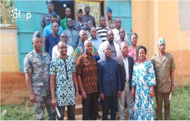
Des conseillers et autorités

Tohoun, 7 jan. (ATOP) - Le conseil municipal Moyen- Mono 1 a ouvert le mardi 06 janvier, et ce pour cinq jours, sa première session ordinaire de l'année 2026 sur la gestion budgétaire.