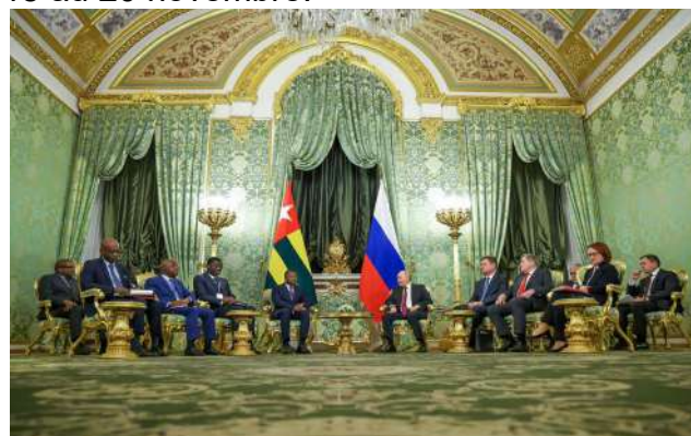
Une délégation du Togo conduite par Faure Gnassingbé reçue par Vladimir Poutine

Dans le cadre du renforcement de la coopération, le Togo a reçu le ministre cubain des relations extérieures M. Bruno Rodriguez Parrila qui a séjourné au Togo du 08 au 10 octobre. Pendant ce temps, des échanges de note se sont passés entre le Togo et le Japon. Ces échanges de note de coopération ont été sanctionnés du côté du Japon par des dons de véhicules à la police togolaise.