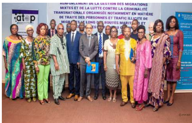
Les participants au lancement du programme sur la migration

En 2025, le ministère des Solidarités, du genre, de la famille et de la protection de l'enfance a intensifié ses actions en faveur des populations vulnérables et de l'inclusion sociale au Togo. De la coopération internationale aux initiatives de terrain, l'année a été jalonnée de réformes, de partenariats stratégiques et d'actions ciblées touchant l'enfance, le genre et la solidarité nationale. Des faits marquants d'une année placée sous le sceau de l'engagement social.