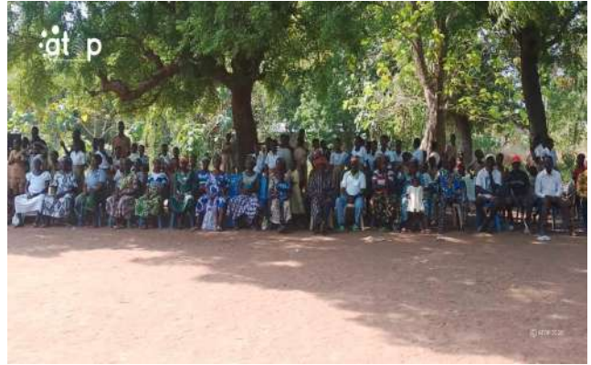
...la population à cultiver la paix

Cette rencontre fait suite à un malentendu entre les exploitants de la Zone d'aménagement agricole planifié (ZAAP) et les conseillers agricoles. Elle a permis de sensibiliser les populations sur les notions de vivre ensemble et d'éclairer ceux-ci sur les mesures prises par le gouvernement concernant la gestion des ZAAP et le rôle des conseillers agricoles.