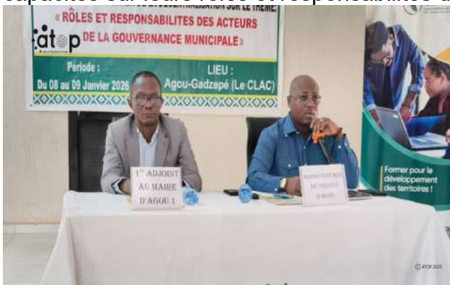
Le secrétaire général (au micro) donnant son discours

Agou-Gadzépé, 8 jan. (ATOP) - Les conseillers municipaux des communes Agou 1 et 2 participent, les 8 et 9 janvier à Agou-Gadzépé, à un atelier de renforcement de capacités sur leurs rôles et responsabilités dans la gouvernance locale.