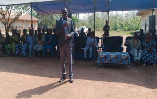
Le préfet Djato exhortant...

Tohoun, 8 jan. (ATOP) - Le préfet de Moyen-Mono, colonel Djato Nadjindo Dana a sensibilisé, le mercredi 7 janvier, les populations du village d'Attifoutou dans le canton de Saligbé (commune Moyen-Mono 2) sur le vivre ensemble.