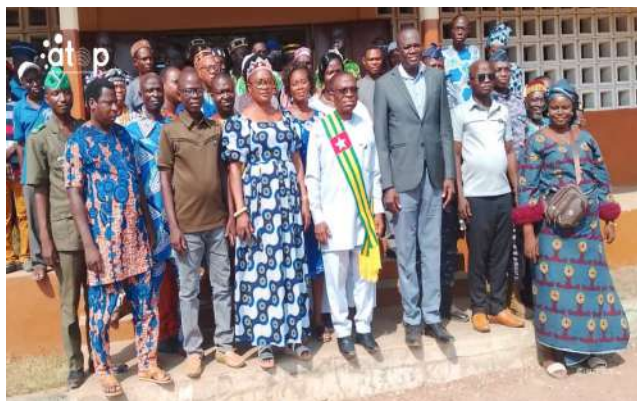
Des autorités et conseillers municipaux

infrastructures marchandes, réviser le projet relatif à la mise en place du bureau du citoyen et adopter les procédures pour une occupation légale des domaines publics.