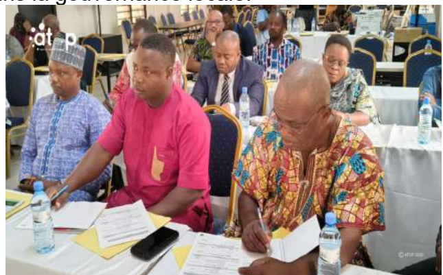
Vue partielle des participants

L'activité est organisée par l'Agence nationale de formation des collectivités territoriales (ANFCT). L'objectif est de fournir aux participants les outils nécessaires en vue de leur permettre de mieux assimiler les enjeux de la décentralisation au Togo. Il s'agit aussi de permettre à ces acteurs de jouer pleinement leurs rôles dans la mise en œuvre de la nouvelle politique de décentralisation.