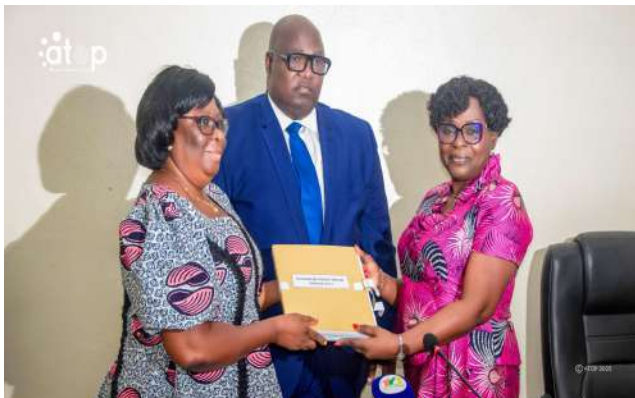
Passation des charges

à Djémégni, dans le cadre du projet SWEDD+, financé par la Banque mondiale. Le 17 septembre, la ministre de l'Action sociale a également honoré les jeunes filles bachelières, pour saluer leur mérite et leur persévérance.