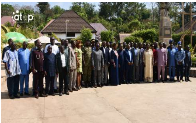
Des autorités et acteurs régionaux

Atakpamé, 8 jan. (ATOP) - Le conseil régional des Plateaux a ouvert, le mardi 6 janvier à Atakpamé, les travaux de sa première session ordinaire de 2026, en présence des autorités administratives, politiques et traditionnelles ainsi que des partenaires institutionnels.