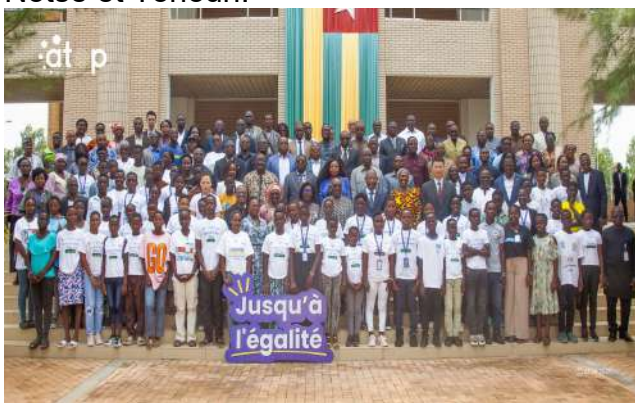
Les participants à la Journée de l'Enfant Africain

La lutte contre les grossesses et mariages précoces est demeurée une priorité. Une campagne nationale a été lancée le 7 mai à Asrama, suivie d'actions de sensibilisation à Notsè et Tohoun.