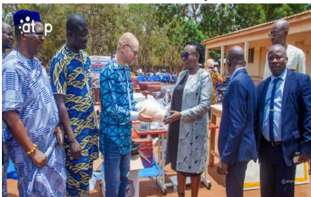
Remise symbolique des lots de matériels par Madame la Ministre ZINSOU-KLASSOU

La politique d'inclusion sociale est restée au cœur des priorités gouvernementales. Des personnes en situation de handicap, en fin de formation, ont reçu du matériel professionnel et des aides techniques afin de favoriser leur autonomie économique et leur mobilité. La cérémonie de remise, organisée au Centre permanent pour sinistrés de Logopé, a permis de distribuer des machines à coudre, tondeuses, tables de travail, béquilles, cannes blanches et fauteuils roulants à ces personnes.