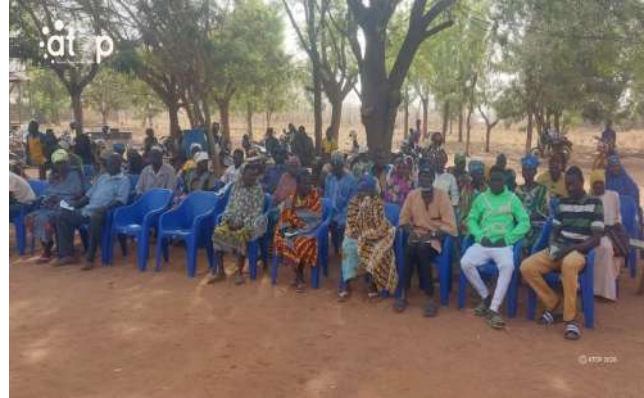
Vue partielle des patients pris en charge

Ces opérations foraines sont à l'actif de l'ONG Humanity first qui signifie « Humanité d'abord » avec l'appui financier de l'Allemagne et le soutien technique du gouvernement qui a mis du personnel soignant à leur disposition. Elles ont pour but de soulager les personnes qui ont des problèmes de vision en leur donnant l'opportunité de retrouver leur santé.