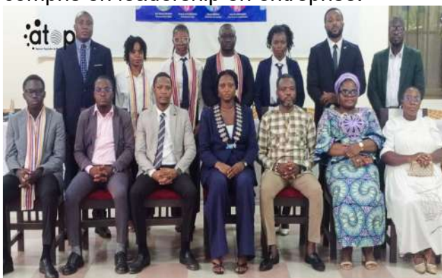
Les officiels et membres du nouveau bureau

appartenance à la JCI et les statuts et règlements de ladite organisation. Cette journée a aussi connu la première réunion administrative du mandat et une signature de partenariat avec l'entreprise « kunst Éléphant », spécialisée dans le graphisme et l'entreprise « Boussole Institute », dont la mission est la formation en relations humaines et familiales, y compris en leadership en entreprise.