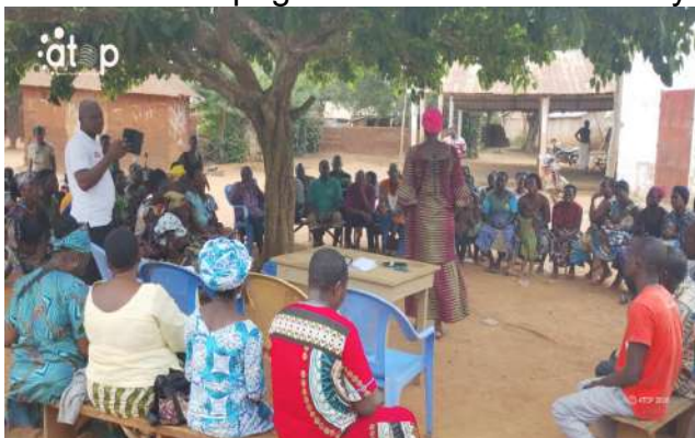
Sensibilisation à Ametogan- Kopé

Afagnan, 26 jan. (ATOP) - Les populations d'Amétogan-Kopé et de Tossa-Kopé du canton d'Afagnan Gbléta dans la commune Bas-Mono 1, ont été édifiées sur leurs rôles et responsabilités dans la gouvernance locale, participative et inclusive, les 20 et 23 janvier, lors d'une campagne de sensibilisation citoyenne.