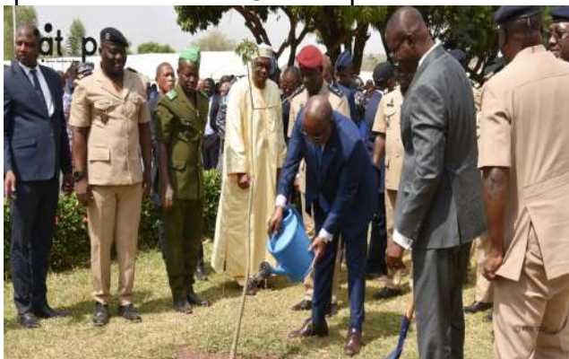
Le PA arrosant le plant de baobab mis en terre

la destinée de la nation togolaise. Il a exprimé sa gratitude aux hautes autorités du pays qui donnent vie au CME depuis 47 ans :