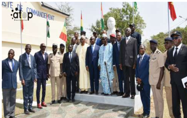
Les officiels ont posé avec le buste