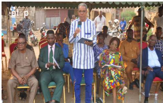
Le sénateur Me Koffigoh (debout) dans son intervention

Le sénateur, Me Joseph Kokou Koffigoh a expliqué au public la mission qui incombe aux parlementaires notamment le vote des lois, le contrôle de l'action gouvernementale ainsi que l'information et l'écoute des populations. Il a passé au peigne fin les grandes réalisations du Président du Conseil dans le domaine de la sécurité, la santé, l'économie, le social, l'agriculture de la promotion des fêtes traditionnelles, de l'environnement et de l'autonomisation des communes. Me Koffigoh a, par ailleurs, salué l'engagement du Président du Conseil dans la promotion de la paix et de la sécurité dans la résolution pacifique de la tension entre le Rwanda et la République Démocratique du Congo.