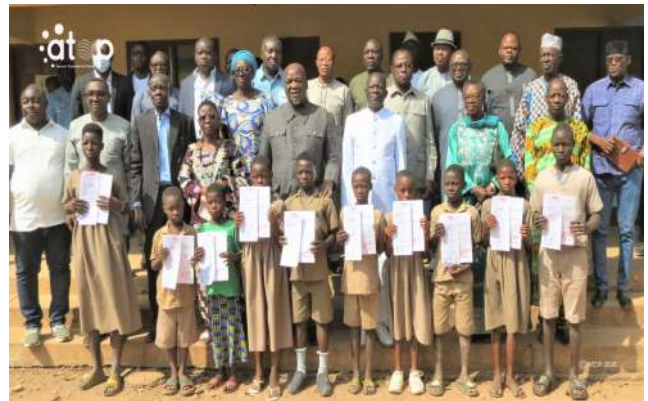
Officiels et bénéficiaires

Organisée par le ministère en charge des Droits humains et placée sous le thème "Le droit à l'identité et l'importance de la déclaration de naissance", l'initiative s'inscrit dans le cadre du projet "Promotion et protection des droits de l'Homme". L'objectif est de promouvoir le droit à l'identité pour tous les enfants non déclarés à l'état civil dans les localités ciblées et faciliter aux parents, la délivrance des jugements supplétifs lors des audiences foraines. A cet effet, 100 écoliers dont 49 filles, de 80 établissements scolaires relevant de l'Inspection préfectorale de l'Education de la Kéran ont bénéficié de ce précieux document. Le jugement supplétif tient lieu d'acte de naissance et constitue la première reconnaissance donnant à un enfant le droit à une identité juridique.