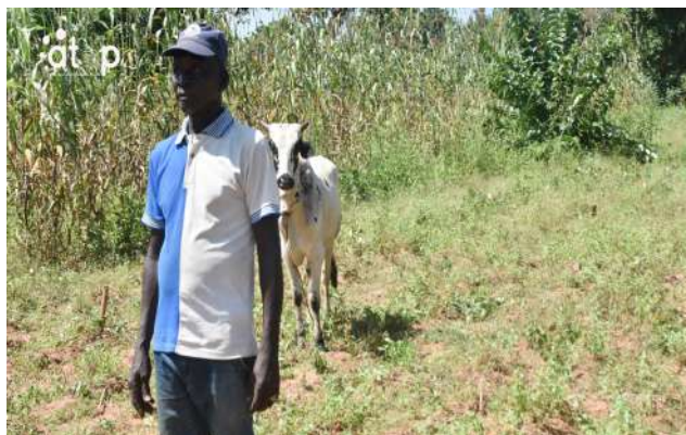
Un bénéficiaire avec son bœuf pour le labour (Réparation individuel)