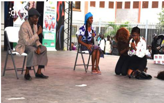
Une phase de sketch

Lomé, 26 jan. (ATOP) - Un concert apothéose de sensibilisation sur l'usage des réseaux sociaux en bon escient a rassemblé la jeunesse estudiantine du grand Lomé le vendredi 23 janvier à la scène Bella Bello de l'Université de Lomé.