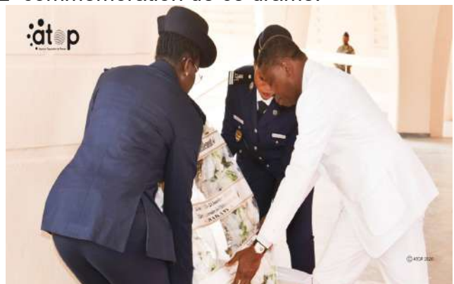
Le PC déposant la gerbe en fleurs

Le dépôt de gerbe a été fait à 15h37 minutes, heure du crash. Il a été suivi de la sonnerie aux morts, de l'audition du message de feu président Eyadema qui tenait à rassurer son peuple qu'il était sorti indemne de cet attentat.