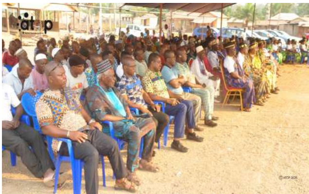
Vue partielle de l'assistance de Kpélé 1

L'objectif de ces descentes sur le terrain est d'informer les populations à la base, sur les actualités nationales afin de renforcer la transparence, la compréhension et la participation citoyenne à la vie publique. Cette rencontre est aussi l'expression de leur volonté commune de consolider le lien de confiance entre les élus et leurs mandants en traduisant leur attachement au dialogue permanent, à la cohésion sociale et à l'unité nationale, valeurs indispensables au développement harmonieux de la préfecture. Il s'est également agi pour les parlementaires et conseillers régionaux de cette préfecture de présenter leurs vœux de nouvel an dans un esprit de proximité, d'écoute et de respect mutuel à leurs mandants.