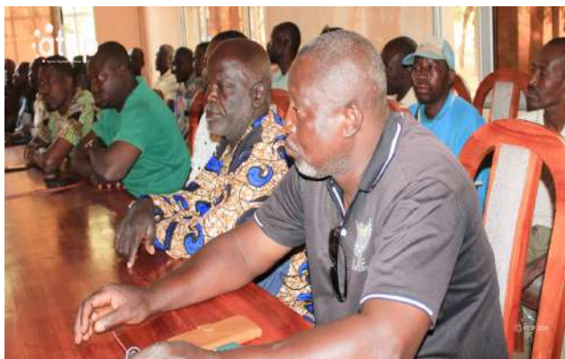
Vue partielle des participants à Dapaong

« Depuis un certain temps, avec les nouvelles dispositions prises par le ministère, des interprétations diverses circulent, comme quoi le Togo aurait interdit la vente de bois, les commerçants qui sont dans ce domaine n'ont plus de matière et leur activité est suspendue, alors qu'il n'en est rien de tout cela », a-t-il déclaré. M. Nabiema a fait savoir qu'en raison de l'état de dégradation de la forêt togolaise, surtout dans la région des Savanes, des mesures sont prises pour accompagner les exploitants à importer le bois des pays forestiers.