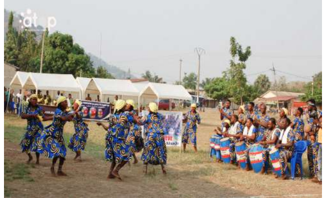
Le groupe Aménuvévé de Tové-Ahoundjo

La finale a réuni les quatre groupes finalistes issus des phases éliminatoires organisées du 21 novembre 2025 au 24 janvier 2026. Il s'agit des groupes Aménuvévé de Kpélé Tutu, Dzigbodi Fafali d'Agou-Atigbé Dzogbépimé et Alliance de Kpélé Adéta, classés respectivement deuxième, troisième et quatrième.