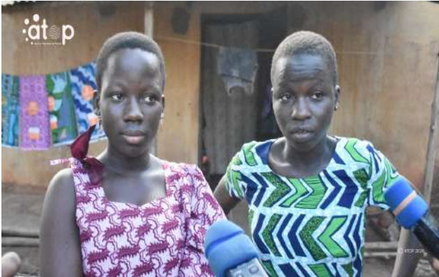
Des orphelines prises en charge