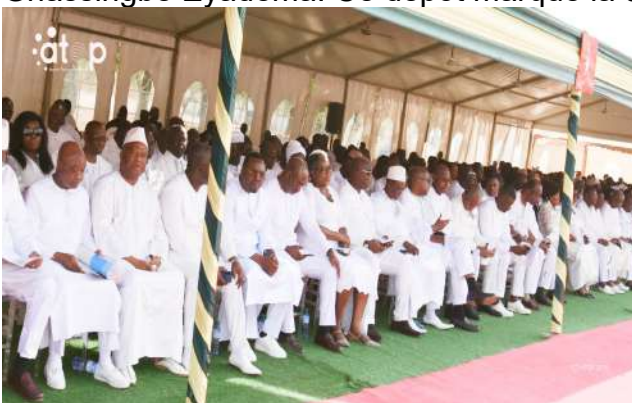
Vue partielle de l'assistance

Kara, 26 jan. (ATOP) – Le Président du Conseil, Faure Gnassingbé a déposé, le samedi 24 janvier, une gerbe au mausolée de Sarakawa (commune Kozah 2), site de l'attentat déguisé en accident d'avion au bord duquel se trouvait le père de la nation, feu Gnassingbé Eyadema. Ce dépôt marque la 52 e commémoration de ce drame.