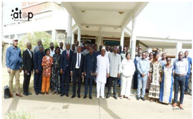
Officiels et participants

Ce séminaire s'inscrit dans la dynamique nationale de promotion d'un espace médiatique responsable, à l'heure où l'intelligence artificielle redéfinit les pratiques de production et de diffusion de l'information. Il a rassemblé notamment les journalistes, les communicateurs, les responsables institutionnels et les acteurs de la société civile des trois régions septentrionales du pays. Cette initiative a permis de renforcer les capacités de ces acteurs