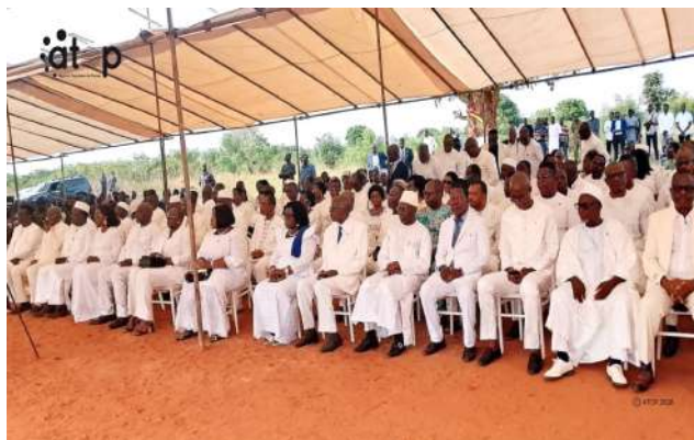
L'assistance à la place des martyrs

La cérémonie de commémoration du 52 ème anniversaire de l'attentat de Sarakawa a été marquée à Lomé par le dépôt de gerbe du Colonel Madjoulba, au pied du monument