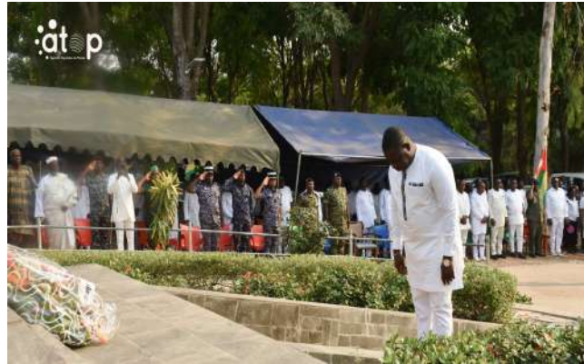
Le préfet Ekpe s'inclinant pour rendre hommage aux illustres disparus

La cérémonie s'est déroulée en présence des autorités militaires, politiques, traditionnelles et religieuses témoignant leur solidarité et leur attachement au devoir de mémoire. ATOP/KKT/GMM/KYA