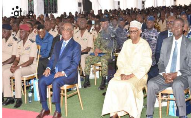
Vue partielle des officiels

Placée sous le haut patronage du Président du Conseil, cette conférence s'inscrit dans la célébration des 47 ans de création du CME de Tchitchao et les manifestations marquant les 20 ans de la disparition du père de la nation, Gnassingbé Eyadema.