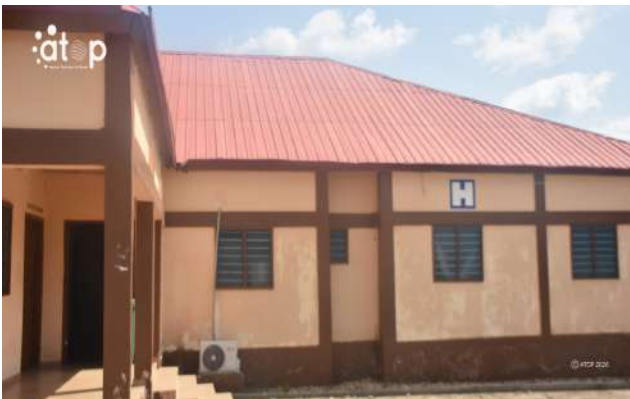
Un centre de santé (Réparation communautaire)

Dans les Savanes, à Barkoissi, un forage a été construit à la communauté de l'Oti afin de nouer de nouvelles relations en partageant l'eau de vie. Ce forage, d'après les bénéficiaires, a servi à toute la communauté d'oublier le passé et l'on peut remarquer le fruit de la réconciliation visé par HCRRUN.