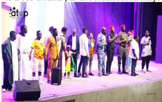
Le collège des humoristes à la fin du concert

Cette initiative de prise en charge des nouveau-nés en détresse respiratoire, fait suite au coût très élevé de l'oxygénothérapie, devenue un problème de santé publique au Togo. Pour venir en aide aux parents qui n'ont pas les moyens pour faire face à ce traitement coûteux, l'entreprise sociale et solidaire CDK Group s'est engagée à sauver la vie à ces enfants par une mobilisation citoyenne de fonds au sein de la population.