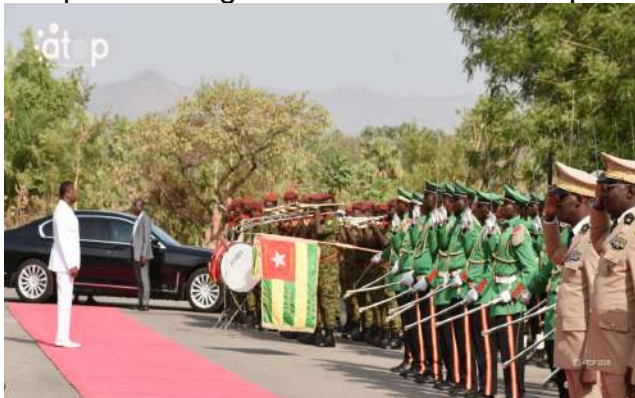
Le Président du Conseil recevant les honneurs militaires à son arrivée

A l'occasion, l'assistance a écouté le message du général Améyi, témoin du drame et l'allocution du ministre chargé de l'Administration territoriale, de la Gouvernance locale et des Affaires coutumières, Col. Hodabalo Awaté. Ce dernier a relevé le sacrifice des compatriotes victimes de cette tragédie, qui enseigne aujourd'hui, au peuple togolais, la loyauté, le patriotisme, le refus de la corruption et l'amour de la patrie. Pour le Col. Awaté, la victoire de Sarakawa appelle aujourd'hui à un sursaut citoyen, invitant ainsi, chaque citoyen togolais à défendre son identité, à protéger l'image du pays et à poursuivre la marche vers le progrès, inspiré par les victoires du père de la nation et par les succès de la diplomatie togolaise sous le leadership du Président du Conseil.