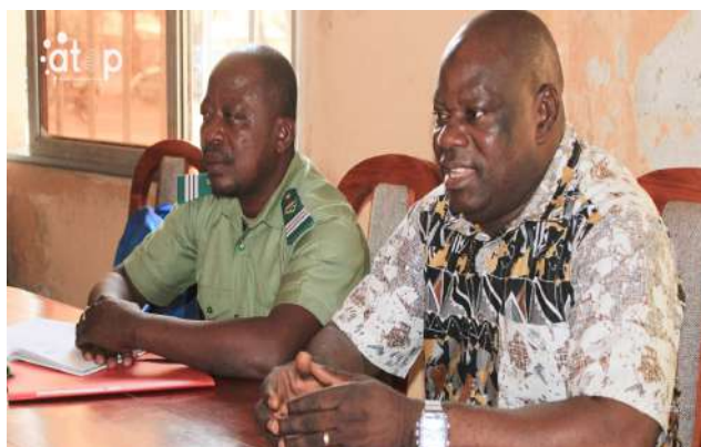
Le DR (à droite) explique les nouvelles mesures aux exploitants

Le directeur régional s'est rendu successivement à Cinkassé, Dapaong et Mango où il a rencontré les acteurs entre autres les menuisiers, carbonisateurs, vendeurs de