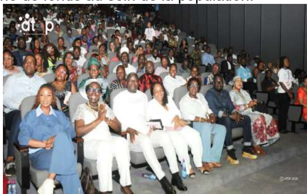
Vue partielle des spectateurs

Le décor artistique a consisté en un cabinet d'oxygénothérapie mis en place pour la circonstance et dirigé par l'humoriste ivoirien Michel Gohou. Chaque humoriste a contribué volontairement pour la prise en charge d'éventuels cas de nouveau-nés en détresse respiratoire.