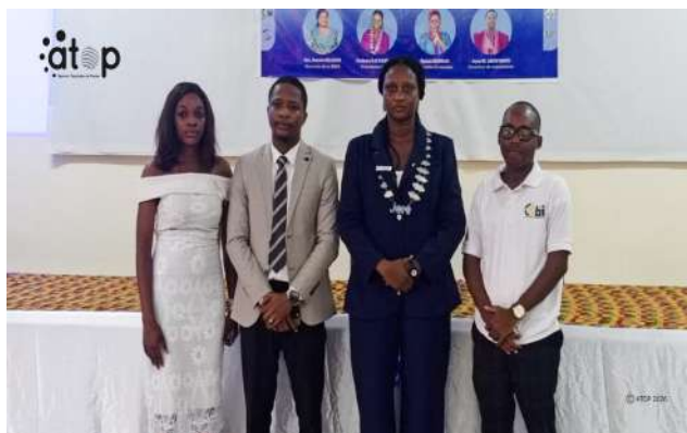
Officiels et partenaires

Placé sous le thème « Rayonnons en innovant », ce mandat 2026 regorge deux activités phares et denses, notamment « l'académie des maîtres de cérémonie et l'académie du digital ». La première se déroulera de février en juillet prochain. Elle aura pour rôle d'accompagner et professionnaliser les aspirants et amateurs de maîtres de cérémonie à travers le renforcement de leurs compétences techniques, artistiques et entrepreneuriales. La seconde « l'académie du digital » entend renforcer les capacités numériques et entrepreneuriales des jeunes et professionnels, afin d'améliorer leur employabilité et leur intégration dans l'économie numérique.