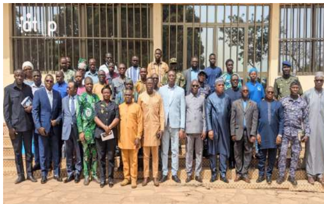
Officiels et participants