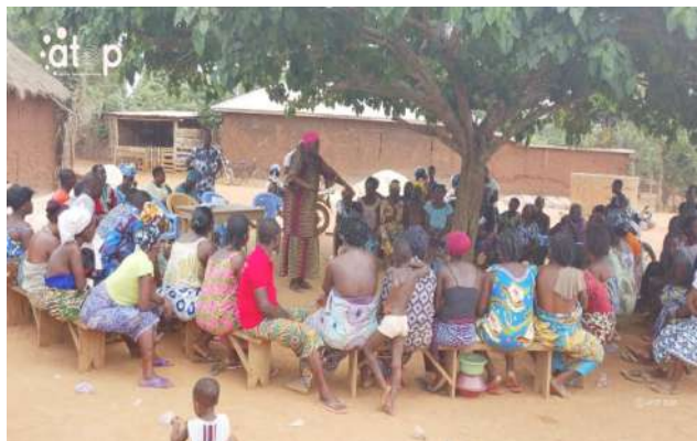
Séance de sensibilisation à Tossa -Kopé

Cette activité est à l'actif du Comité local de gouvernance participative (CLGP) de la commune Bas-Mono 1 en collaboration avec le Bureau diocésain Togo du Conseil épiscopal justice et paix (CEJP). Elle s'intègre dans la dynamique du plan d'action annuel des organisateurs.