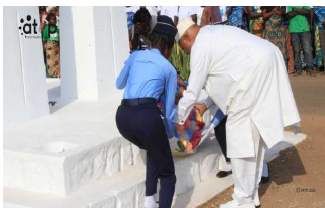
Le gouverneur dépose la gerbe de fleurs sous la stèle mémorial