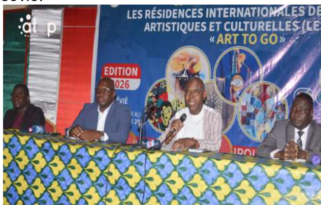
Le ministre de la Culture (micro) ouvrant les travaux

Ce projet est une initiative de l'association Art Héritage Culture, dans le cadre de son programme « ART Togo ». Il est parrainé par la commune Zio 1 et placé sous le thème : « Métaphore multipolaire ». L'objectif est de permettre aux artistes plasticiens d'explorer la diversité de l'art tout en partageant leurs expériences dans un univers en pleine mutation.