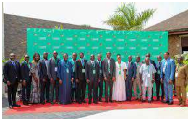
Congrès de la FTF à Aného

en tête du classement avec 46 points, 34 buts marqués, 23 encaissés et un goal différentiel +11 le 8 Juin 2025. Il est suivi des Requins mâles du littoral terminent deuxième avec 45 points, 21 marqués, 19 encaissés, + 2. Avec 42 points, l'Entente II de Lomé, 24 buts marqués, 2 buts encaissés + 4, a complété le podium.