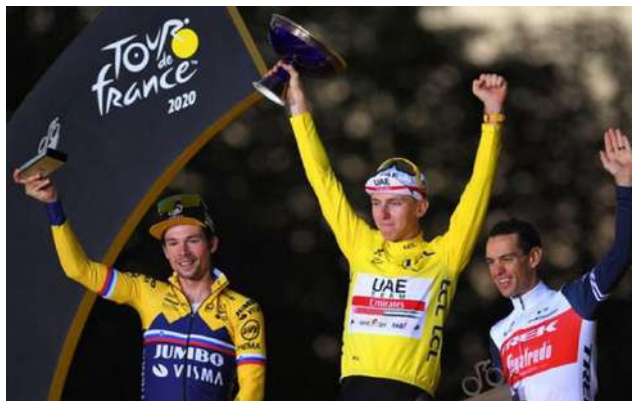
Vainqueur de la Tour de France

En cyclisme, le Tour de France 2025 a tenu toutes ses promesses : suspense jusqu'aux dernières étapes, stratégies d'équipe audacieuses et public toujours au rendez-vous. L'épreuve qui est sa 112 ème édition s'est déroulée du 5 au 27 juillet. Ce Tour est remporté pour la quatrième fois par le Slovène Tadej Pogačar (UAE Team Emirates) qui a pris définitivement le maillot jaune lors de la 12 ème étape, a gagné quatre étapes et s'adjuge le maillot à pois du classement de la montagne. La saison a illustré l'évolution du cyclisme moderne, plus scientifique, mais toujours imprévisible.