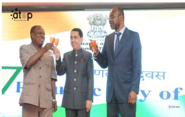
La cérémonie de toast