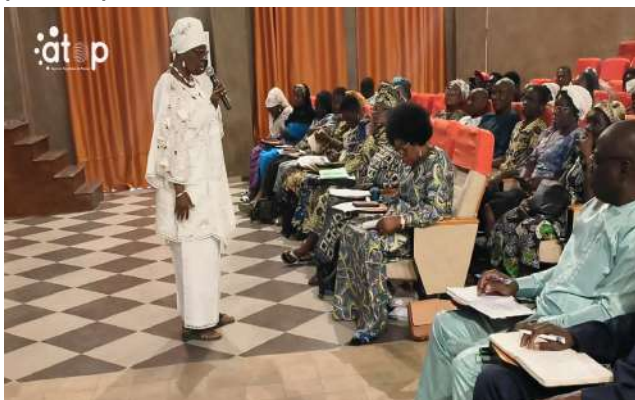
Une séance de formation

Cette récollecion professionnelle, placée sous le signe de l'évaluation et de l'anticipation, est à l'actif des principaux acteurs de ce mécanisme national de financement (FNFI) mis en place par le gouvernement. Elle intervient dans le cadre de la dynamique de renforcement de la finance inclusive au Togo, au service d'un développement économique plus équitable et durable.