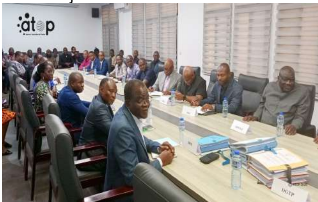
Vue de l'assistance