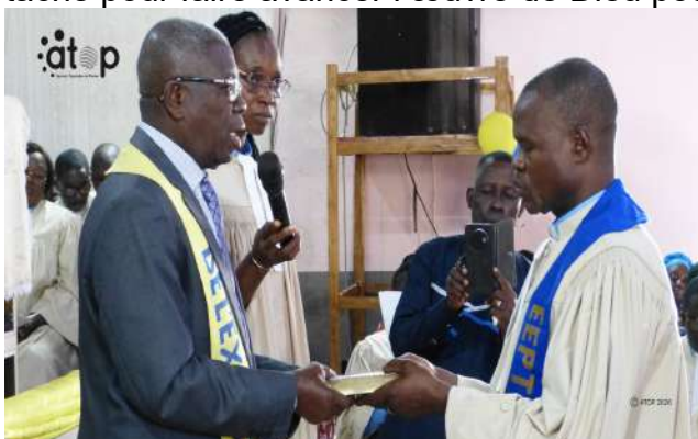
Remise symbolique de la Bible à l'inspecteur (à droite)