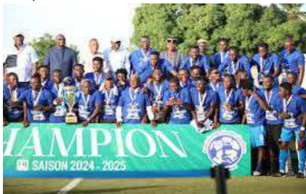
ASCK, équipe championne du Togo

Cette année, au championnat d'Afrique d'escrime U20 à Luanda en Angola du 1er au 6 mars dernier, le Togo s'est fait représenter en minime, cadet et junior. Les athlètes ont fait honneur à leur pays en remportant six médailles lors de cette compétition