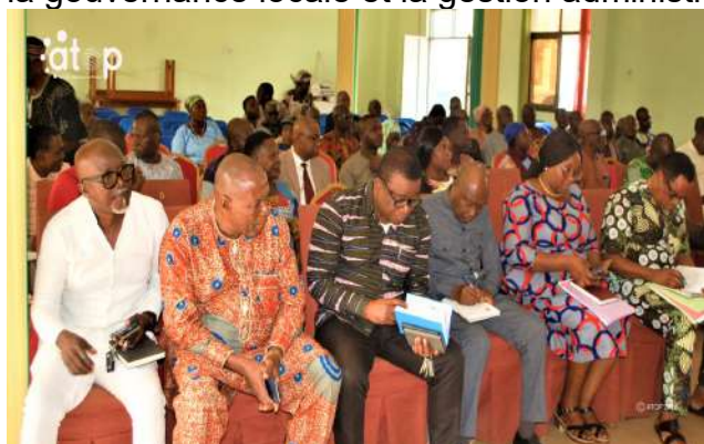
Conseillers et couches socio-professionnelles attentifs...

Kpalimé, 27 jan. (ATOP) - Les travaux de la première session ordinaire du conseil municipal de l'année 2026 de la commune Kloto 1 ont été ouverts, le lundi 26 janvier, sur la gouvernance locale et la gestion administrative et financière, à Kpalimé.