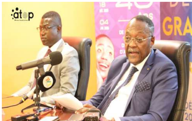
...le discours du président Symenouh (au micro)

La cérémonie de lancement s'est déroulée en présence des responsables de la CCI-Togo, ainsi que de nombreux opérateurs économiques. Elle s'inscrit dans la mission d'accompagnement et de sensibilisation du secteur privé aux évolutions du cadre réglementaire national.