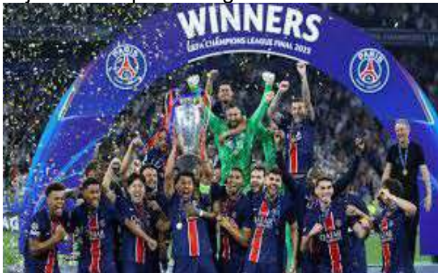
PSG, vainqueur de l'UEFA Champions League 2025

continentale. Au total, trois médailles d'Argent et trois médailles de Bronze ont été décrochées par les escrimeurs togolais. Cette performance du Togo le se hisser à la 5ème place du classement général par médaille. Ceci témoigne du dynamisme et du potentiel de la jeunesse sportive togolaise.