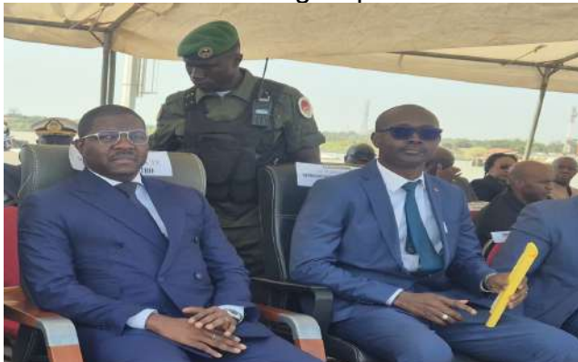
Les officiels lors du lancement des travaux

Ce projet d'envergure vise à lever les obstacles logistiques qui freinaient jusqu'ici le plein potentiel du port, a indiqué la BOAD dans un communiqué de presse. En libérant les accès maritimes par l'extraction des sédiments et des épaves, l'opération permettra, entre autres, de fluidifier le trafic en garantissant des profondeurs suffisantes pour les grands navires, de stimuler plus d'échanges en réduisant drastiquement les délais de transport des biens et services essentiels puis de doper la compétitivité en positionnant Bissau comme un carrefour logistique moderne et attractif.