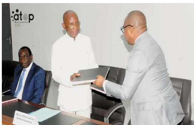
Remise de parapheur au ministre entrant (droite)