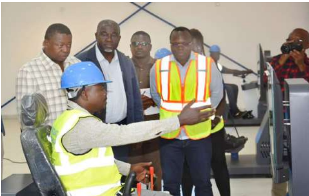
Le Président du Conseil sur le site du CRMA

Lomé, 27 jan. (ATOP)- Le Président du Conseil, Faure Gnassingbé, a effectué le lundi 26 janvier, une visite de terrain sur le chantier du Centre régional de mécanisation agricole (CRMA) de Tchitchao.