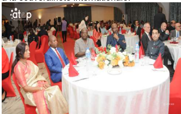
L'ambassadeur et les ministre lors de la soirée

Lomé, 27 jan. (ATOP) - L'ambassadeur de l'Inde au Togo, Fahmi Syed Razi Haider, a célébré, le lundi 26 janvier à Lomé, le 77 ème anniversaire de l'accession de l'Inde à la souveraineté internationale.