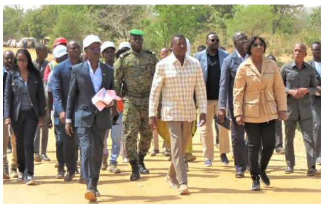
Le Président du Conseil (au milieu) sur le terrain

en mars 2024 dans le cadre du programme national de construction de 21 ponts modulaires d'affranchissement à travers le Togo.