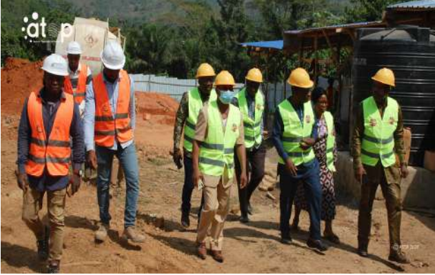
Visite guidée sur le chantier de construction du nouveau siège de la mairie

A l'issue de la cérémonie d'ouverture, les autorités locales se sont rendues sur le site de construction du nouveau siège de la commune de Kloto 3 pour s'assurer de l'état d'avancement des travaux. Là, elles ont suivi les explications du chef de chantier relatives à l'évolution des travaux.