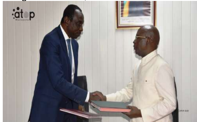
Échange de documents

Cette cérémonie vise à assurer la continuité de l'action publique et à permettre au nouveau responsable de ce département de prendre connaissance des dossiers en cours, des projets exécutés ainsi que des défis liés au développement et à l'entretien des pistes rurales à travers le pays. Elle traduit la volonté des autorités togolaises d'assurer une gestion rigoureuse et une continuité efficace de l'action publique.