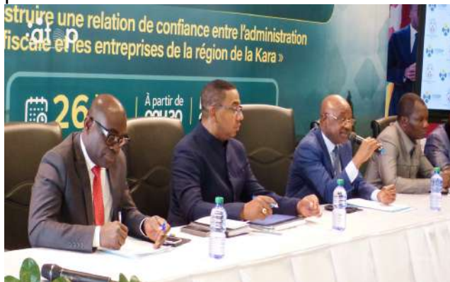
Le ministre (au micro) répondant aux préoccupations...

Les échanges ont porté entre autres sur les missions, la composition et les instances de gouvernance du CR-CESP, ainsi que les rôles et attributions des organes de gouvernance. Les contribuables de la région ont pris connaissance des acteurs régionaux multisectoriels qui composent le CR-CESP dont la mission est d'animer le dialogue public-privé dans le ressort territorial de la région de la Kara. Ils ont été édifiés sur le cahier de charges de son secrétariat technique régional chargé de la gestion quotidienne du CR-CESP sous l'autorité du gouverneur et de la mise en œuvre opérationnelle des décisions prises.