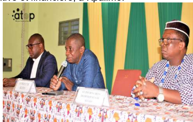
...au discours du préfet (au micro)

Prévue pour durer cinq jours, la session est consacrée à l'examen et à l'adoption de plusieurs points relatifs à la gouvernance locale, au développement communal et à la gestion administrative et financière de la commune. Certains dossiers inscrits à l'ordre du jour feront l'objet de délibérations.