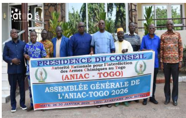
Des membres de l'ANIAC

au cours de l'exercice 2025, d'examiner et d'adopter le plan de travail et le budget annuel prévisionnel pour l'année 2026. Les participants vont analyser les résultats obtenus en 2025 afin de mieux capitaliser les acquis et corriger les insuffisances relevées. Les travaux permettront également d'évaluer les défis rencontrés, d'identifier les perspectives d'amélioration et de renforcer la coordination entre les différents acteurs nationaux concernés.