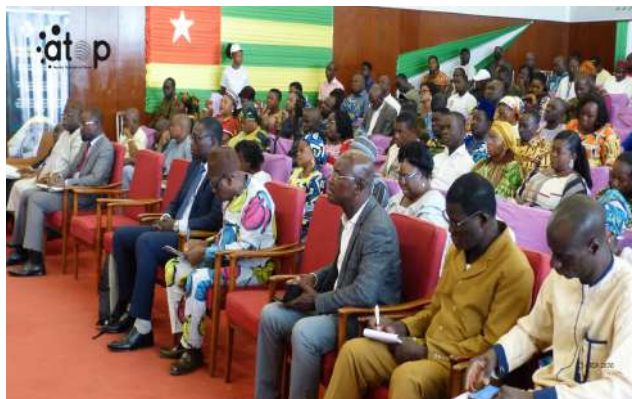
...des opérateurs économiques

Le ministre des Finances et du Budget, Barcola Essowè Georges, a rassuré les opérateurs économiques de la région de la Kara que « l'Etat sera le garant d'un impôt juste et équitable et le garant de recouvrement fiscal transparent ». Il a précisé que le gouvernement mettra tout en œuvre pour lutter contre toute forme de fraude arbitraire en matière fiscale. Le ministre a fait savoir que le gouvernement a engagé une troisième génération de réformes de la gouvernance fiscale qui permettront de réduire significativement les interactions humaines dans le processus de collecte de l'impôt à travers une meilleure traçabilité des opérations commerciales. M. Barcola a enfin invité les opérateurs économiques à recourir au CR-CESP pour faire remonter leurs préoccupations.