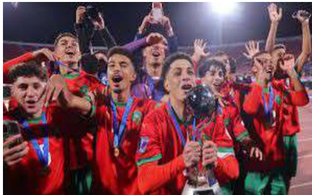
Maroc, champion de la Coupe du monde U20