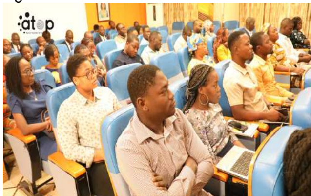
Les opérateurs économiques suivant ...

Lomé, 27 jan. (ATOP) – La Chambre de commerce et d'industrie du Togo (CCI-Togo) a lancé le 27 janvier à Lomé, une formation dédiée aux nouvelles dispositions fiscales issues de la loi de finances 2026, marquant ainsi le début d'une série d'actions visant à renforcer les capacités des acteurs économiques face aux réformes fiscales en vigueur.