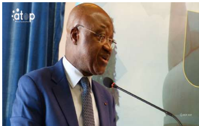
Le ministre ouvrant les travaux

continuité de celle tenue en décembre dernier à Lomé. L'atelier a connu la participation des opérateurs économiques, des préfets et maires de la région de la Kara et des membres des équipes ministérielles et de l'Office togolais des recettes (OTR).