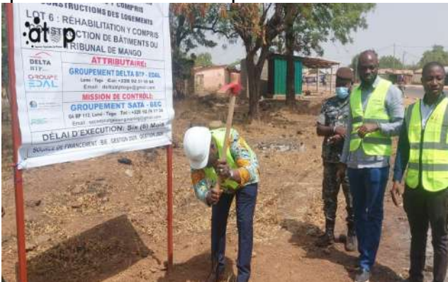
Le DC donne le 1er coup de pioche à Mango