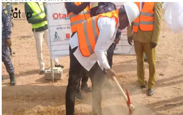
Lancement des travaux par le ministre à Mandouri

Dapaong, 28 jan. (ATOP) – Le ministre de la Justice et des Droits humains, Me Pacôme Yawouvi Adjourouvi, a remis des sites de construction des tribunaux de première instance des préfectures de Kpendjal, Tône, Tandjoaré et Oti, les 26 et 27 janvier dans lesdites localités.