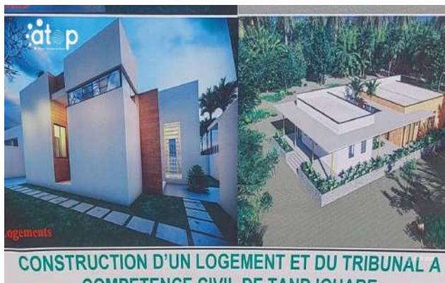
Maquette des édifices de Tandjoaré

La construction de ces nouveaux édifices, à laquelle s'ajoute la réhabilitation des prisons civiles de Dapaong et Mango, entre dans le cadre de la modernisation de la justice. L'objectif est d'améliorer les conditions de travail des acteurs judiciaires et l'accès des citoyens aux services de justice.