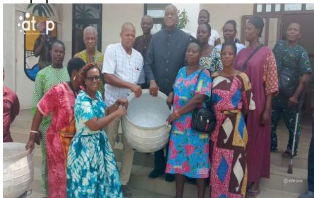
Remise symbolique du matériel

Aného, 28 jan. (ATOP) - La coopérative « Soussoumiladé », spécialisée dans la transformation et la commercialisation de la tomate, basée à Aného-Kpota dans la commune Lacs 1, a bénéficié, le mardi 27 janvier, de matériels de travail et d'équipements.