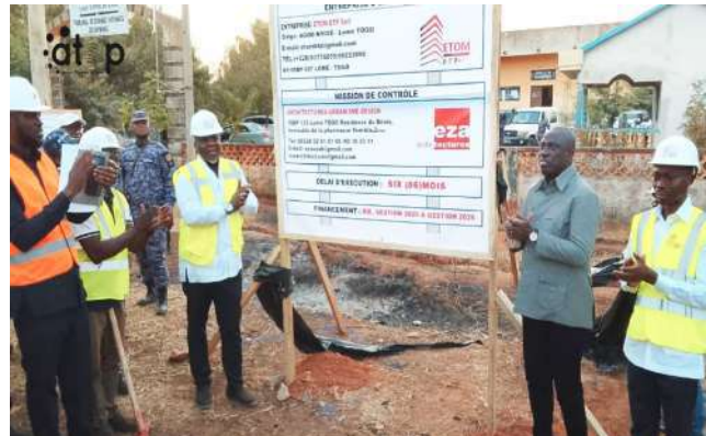
Le ministre (gilet) et le préfet de Tône de part et d'autre du panneau de chantier