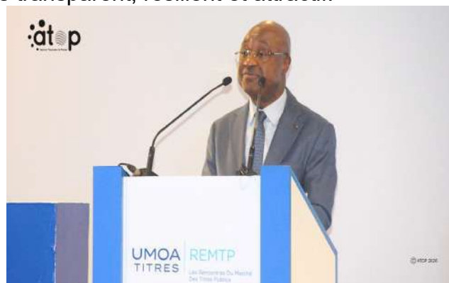
...le ministre Barcola ouvrant les travaux

La rencontre va permettre de rencontrer les émetteurs et d'explorer de nouvelles opportunités sur le marché primaire et secondaire, de discuter des innovations en matière de produits, de cotation et de liquidité et de renforcer leur rôle d'intermédiaires clés dans le développement du Marché des titres publics régional. Il s'agira aussi de présenter le bilan 2025 du marché des titres et les perspectives 2026, de partager leur vision et leurs stratégies, afin de renforcer les acquis.