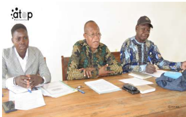
Le maire Batinata (au milieu) ouvrant les travaux

Kantè, 28 jan. (ATOP) - Les travaux de la première session ordinaire de l'année du Conseil municipal de la commune Kéran 3 ont été ouverts le mardi 27 janvier à Nadoba, à environ 30 Km à l'est de Kantè.