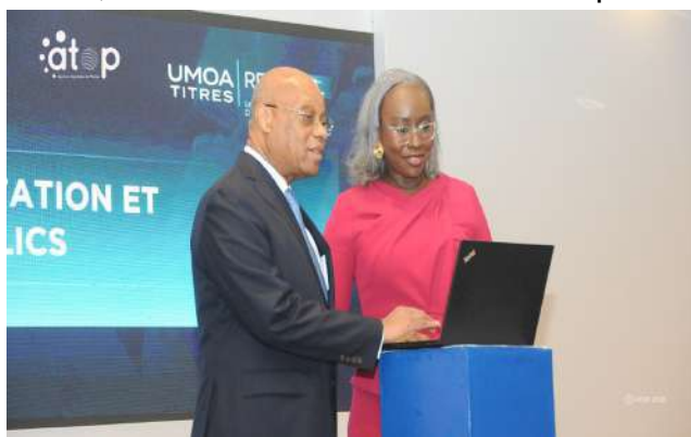
Lancement de la plateforme cotation et de négociation

Les discussions s'articulent autour de trois chantiers structurants. Le premier porte sur la transparence et la formation des prix. Le second concerne l'infrastructure de marché, avec un chantier conduit en collaboration avec la Banque centrale des États de l'Afrique de l'ouest (BCEAO) et d'autres acteurs, visant à dynamiser le marché secondaire. Le troisième chantier porte sur l'élargissement des canaux d'investissement en monnaie locale, considéré comme un levier clé pour le développement du marché.