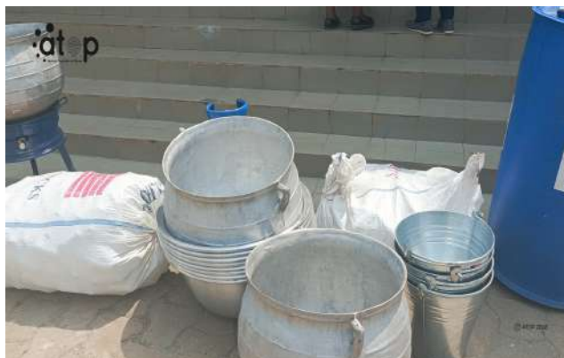
Vue partielle du matériel

Le don est constitué de bassines de 100 litres, de marmites en fonte GM n°40, de tonneaux en plastique, de seaux, de casseroles avec couvercles, de couteaux, de louches et de passoirs. Il comprend également une bouteille de gaz chargées, des foyers à gaz avec raccords, des capsules, des capsuleuses, des bouteilles, des bœufs avec couvercles, entre autres.