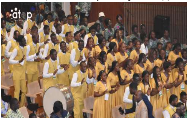
Prestation d'une chorale

Reprenant les paroles de l'Évangile « Moi en eux et Toi en Moi », le prédicateur a insisté sur l'importance de l'unité, évoquant les blessures du passé liées aux conflits ethniques, religieux et aux divisions qui ont marqué l'histoire du pays. Il a toutefois rassuré l'assemblée en présentant l'unité entre Jésus et son Père comme un modèle d'unité fraternelle pour les citoyens togolais, appelés à vivre ensemble dans l'amour de Dieu.