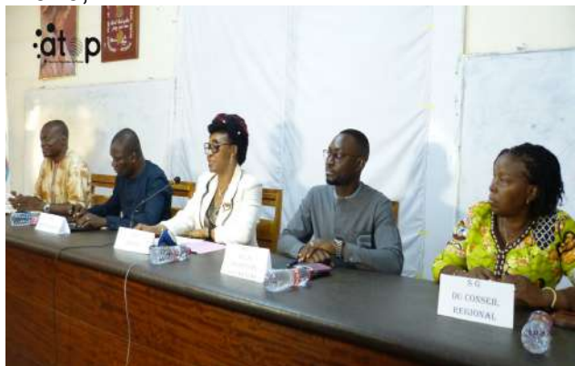
...du DG de l'Agence (micro)

L'atelier est organisé par l'Agence nationale de promotion et de garantie de financement des petites et moyennes entreprises (ANPGF), autour du thème « Loi de finances 2026 : comprendre les nouveautés qui impactent votre entreprise ». Il s'est déroulé dans le cadre du « Mercredi de l'entrepreneur ».