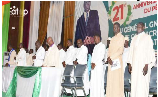
Le collège des pasteur, prêtres et imams concélébrant