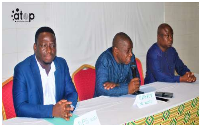
Le préfet (milieu) attire l'attention...

Kpalimé, 6 fév. (ATOP) - La revue annuelle des activités sanitaires 2025 du district de Klotu a réuni les acteurs de la santé les 4 et 5 février à Kpalimé.