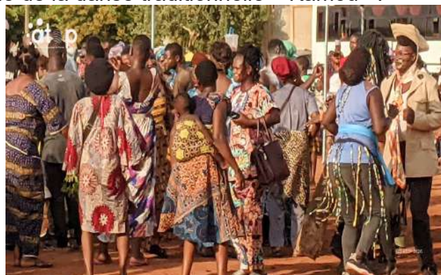
La danse Kamou

Cette manifestation culturelle vise à rendre un hommage au Père de la nation, feu Gnassingbé Eyadema. L'événement a mobilisé un parterre de personnalités, notamment