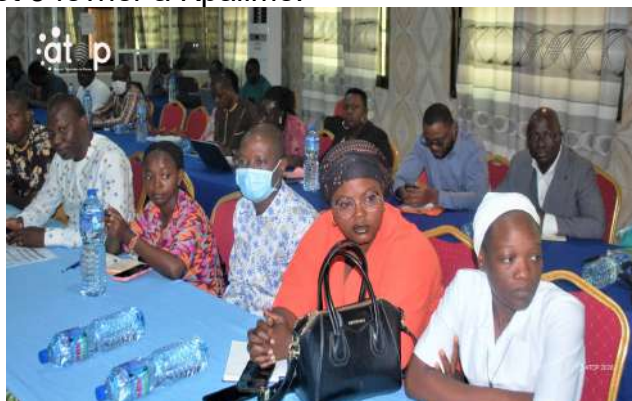
...des acteurs sur l'importance de l'accueil

Cette revue a regroupé des autorités administratives et locales, responsables sanitaires, partenaires techniques et sociaux, acteurs communautaires et organisations de la société civile. Elle a été consacrée à l'analyse des performances, à l'identification des goulots d'étranglement et à la définition de nouvelles orientations pour améliorer les indicateurs en 2026. Des recommandations ont été formulées, afin de renforcer le système de santé au niveau préfectoral.