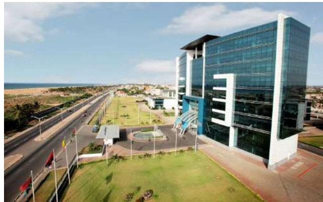
Vue aérienne et partielle du centre ville de Lomé