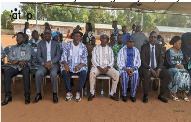
Vue partielle des autorités

Agoè-Nyivé, 6 fév. (ATOP) – La préfecture d'Agoè-Nyivé a vibré, le jeudi 5 février sur le terrain du lycée d'Agoè-Nyivé, au rythme de la danse traditionnelle « Kamou ».