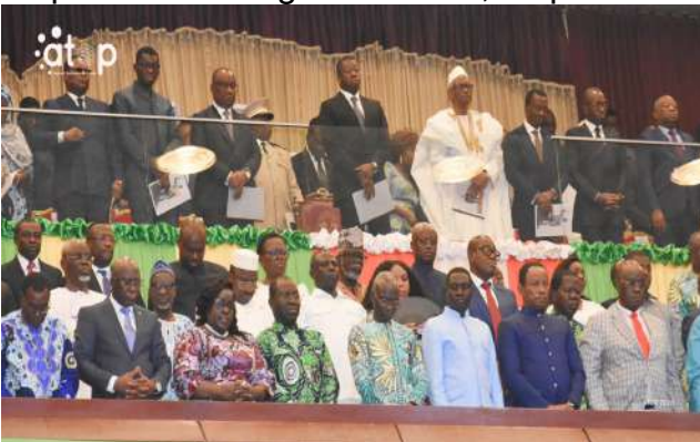
Le PC et sa suite debout pour la prière

Kara, 6 fév. (ATOP) – Un culte d'action de grâce, ponctué de prières œcuméniques et musulmanes, a marqué l'apothéose des manifestations commémoratives des vingt et un an de disparition du père de la nation, feu Gal Gnassingbé Eyadéma, le jeudi 5 février, au palais des congrès de Kara, en présence du Président du Conseil, Faure Gnassingbé.