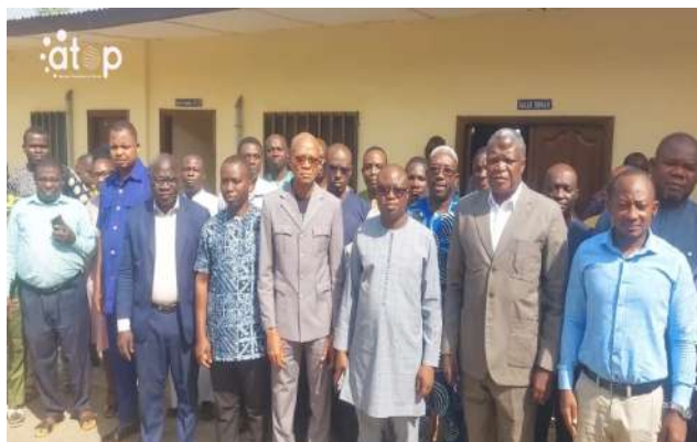
L'assistance à l'ouverture des travaux du district