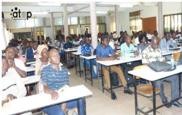
Les entrepreneurs attentifs à l'explication...

Kara, 6 fév. (ATOP) – Des entrepreneurs et opérateurs économiques de la région de la Kara ont été éduqués sur la loi de finances 2026, le mercredi 4 février à Kara.