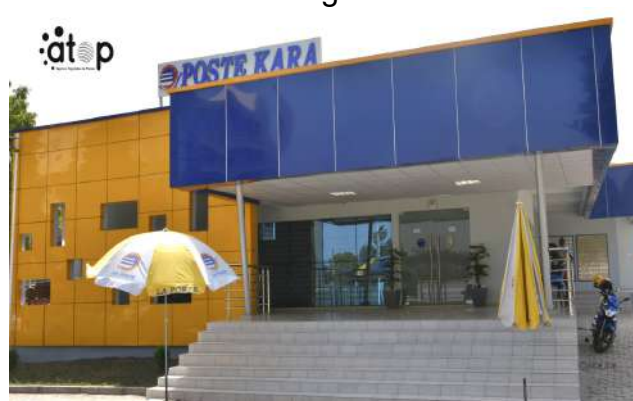
Une vue de face du bâtiment inauguré

Construit sur une superficie de 1430 m 2 , sise au quartier Kofac, ce bâtiment architectural est un équipement public structurant. Il est composé d'une guérite de contrôle sécurité du site, d'un magasin de stockage des colis et courriers et d'un abri destiné à l'attente des passagers du bus. L'ouvrage est également constitué d'un bâtiment principal qui comprend une terrasse d'entrée, d'un hall clients, d'un espace guichet de quatre boîtes de quatre bureaux destinés au gestionnaire, au chef d'agence, à la division régionale des opérations et à l'assistant.