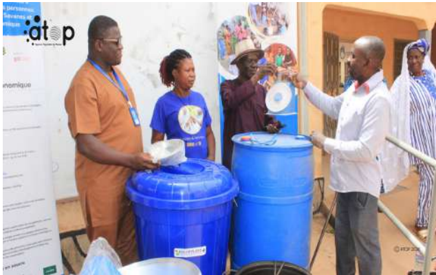
Une bénéficiaires reçoit son matériel

bâches imperméables, de brouettes, d'un pulvérisateur à dos manuel, d'un mini-frigo et d'une boîte isotherme pour la conservation de produits vétérinaires, de houes et de matériel de fabrication de savons, entre autres.