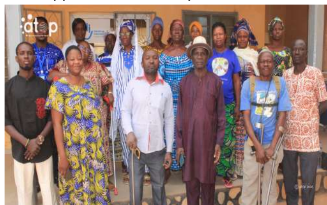
Des bénéficiaires et des autorités locales

Le lot de matériels est composé de bassines et marmites en aluminium, de fourneaux, de tonneaux en plastique, de