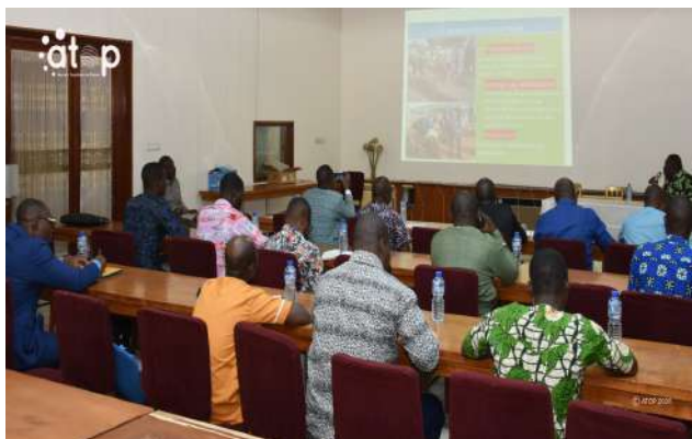
La séance d'échanges

L'initiative, portée par le ministère de la Justice et des droits de l'Homme, a pour but d'évaluer la mise en œuvre de l'opération au niveau régional, dix mois après sa relance ; d'identifier les contraintes et de définir de nouvelles stratégies pour