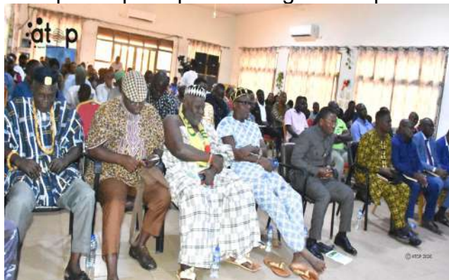
L'assistance à l'étape de Zio 1

autorisant la prorogation de l'état d'urgence sécuritaire ; celle relative à la lutte contre les changements climatiques, et le vote de la loi portant sur le régime juridique applicable aux entreprises publiques au Togo ainsi que celle de la loi de finances 2026.