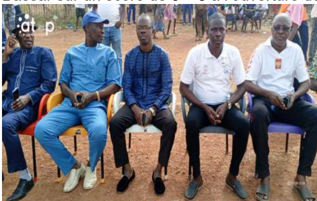
Les officiels suivant...

Bassar, 27 fév. (ATOP) - Le championnat scolaire et universitaire a été officiellement lancé le mercredi 25 février sur le terrain de l'Institut Arnold Johnson (IAJ) dans la commune de Bassar 1. Le lycée Technique de Bassar courbe l'échine le Lycée Bassar sur un score de 0 – 3 à l'ouverture de la compétition.