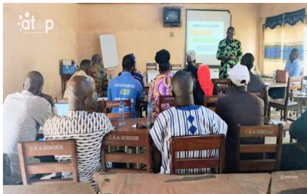
Les participants en activité

L'activité est initiée par le ministère de la Justice et des droits humains, en charge de l'Education à la citoyenneté. Elle fait suite à celle tenue à Lomé, avec les acteurs concernés par cette initiative. Cette table ronde a permis de recueillir les avis, suggestions et propositions des premières personnes impliquées dans cette activité au niveau du chef-lieu de région dans l'optique d'améliorer le travail qui se fait déjà dans les communes.