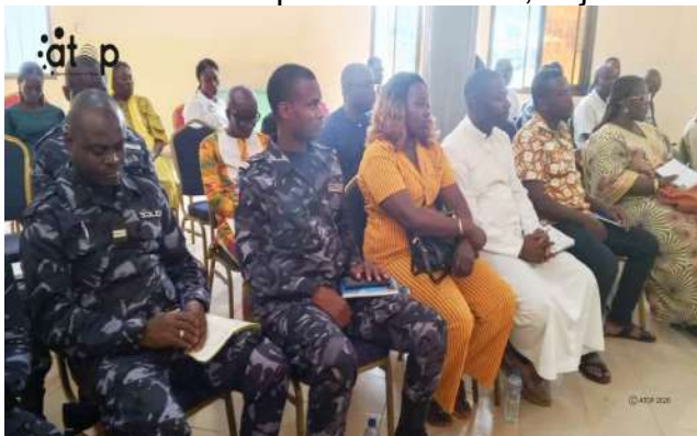
Vue de l'assistance

Apéyémé, 27 fév. (ATOP) - Le nouveau préfet de Danyi, Amavi Koumagnanou a échangé avec les chefs de services déconcentrés et décentralisés de la préfecture lors d'une réunion de prise de contact, le jeudi 26 février à Apéyémé.