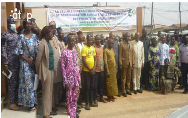
Vue partielle des participants