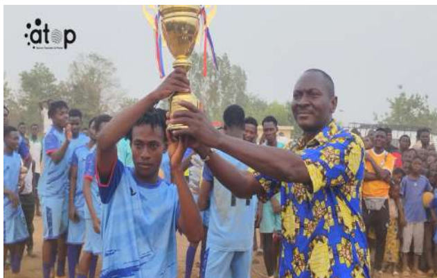
Remise de trophée à l'équipe Renouveau FC de Bassar

La finale s'est disputée en 2 x 20 minutes. Après une première période soldée par un score nul 0–0, les joueurs de Renouveau FC ont forcé le verrou adverse au retour des vestiaires, en inscrivant l'unique but de la rencontre dans les derniers instants du match. En petite finale, Bassar FC a dominé Namon FC par 3 but à 0 pour s'offrir la troisième place. Outre le trophée, les quatre meilleures formations ont reçu chacune un jeu de maillots et un ballon.