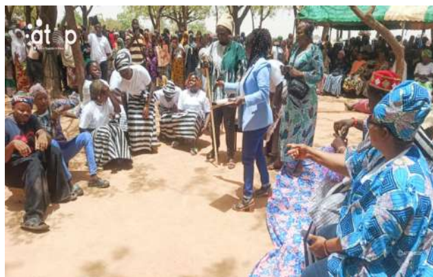
Une partie d'un sketch présentée à Cinkassé

Les deux clubs présenteront des prestations dans leur commune ou ailleurs lors de différentes manifestations. Ils auront également pour rôle de sensibiliser leurs pairs dans les villages et cantons sur l'importance de la paix, la cohésion sociale et du vivre ensemble afin de combattre l'extrémisme violent dans la préfecture de Cinkassé.