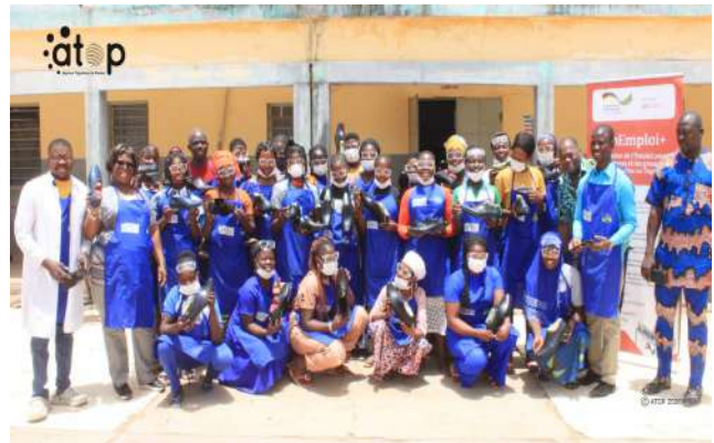
Les cordonnières et les formateurs

Cette formation est initiée par la Chambre préfectorale des métiers de Tône, en collaboration avec l'Union de chambres régionales des métiers (UCRM). Elle a été financée grâce au projet ProEmploi+ de la Coopération allemande à travers la GIZ. Le but est de renforcer les compétences des cordonnières afin d'améliorer la qualité de leurs