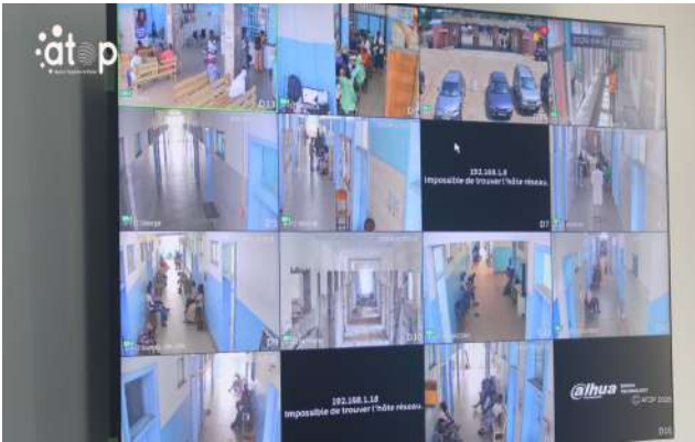
Visualisation des cameras installées au CHR Tomdè

populaire de Chine et le Togo. L'objectif principal est de faire les travaux de maintenance des machines et équipements biomédicaux installés au CHR Tomdè et de réhabilitation de ce bâtiment, ainsi que le placement des caméras de surveillance dans les deux entités.