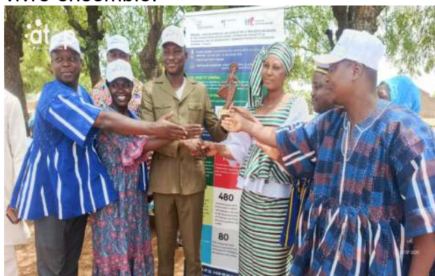
Remise du trophée à la présidente du club de Biankouri

Cinkassé, 3 avr. (ATOP) - Les clubs féminins « Winbarka » du canton de Cinkassé (commune Cinkassé 1) et « Nataaanman » du canton de Biankouri (commune Cinkassé 2) ont remporté respectivement, les 1 er et 2 avril à Cinkassé et à Timbou, les trophées du festival culturel interclubs féminin pour la promotion de la paix, la cohésion sociale et le vivre ensemble.