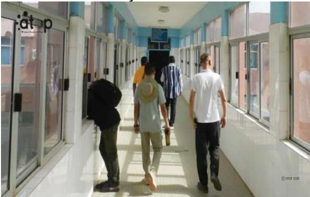
Visite des locaux du CHR

*Au CHR de Kara-Tomdè , l'intervention des experts chinois a permis de moderniser significativement le plateau technique et le cadre de travail. Les actions ont notamment porté sur la maintenance préventive et curative des équipements biomédicaux, ainsi que sur d'importants travaux de réhabilitation du bâtiment. Ces derniers comprennent la rénovation complète des peintures intérieures et extérieures, le remplacement des anciennes portes en bois par des structures métalliques, la pose de nouveaux carreaux et le changement des vitrages. Par ailleurs, la sécurisation du site a été renforcée par l'installation d'un système de vidéosurveillance.