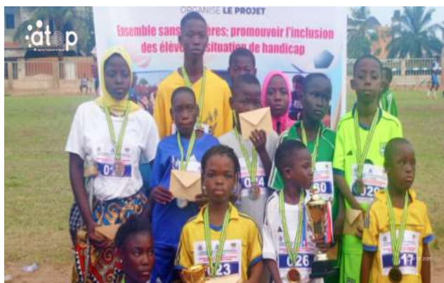
Les athlètes lauréates