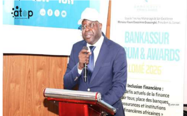
Le président du comité dans son allocution

L'objectif est d'offrir une plateforme capable de rassembler décideurs, régulateurs et opérateurs autour d'un objectif clair : construire un secteur financier robuste. Il vise également à améliorer l'inclusion financière, accélérer l'innovation digitale, renforcer les partenariats et positionner le Togo comme un hub régional.