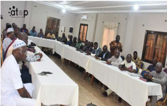
Vue des participants

Tsévié, 3 avr. (ATOP) – La Commission nationale de lutte contre la prolifération, la circulation et le trafic illicite des armes légères et de petit calibre (CNPAL) a sensibilisé les acteurs du transport terrestre de la Maritime sur la lutte contre le trafic illicite des armes à feu, le mercredi 2 avril à Tsévié.