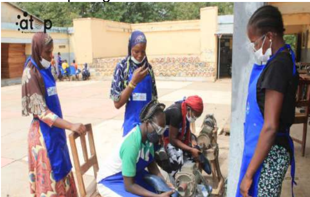
Des participantes en pleine séance pratique

Dapaong, 3 avr. (ATOP) – Vingt-six cordonnières de la région des Savanes ont renforcé leurs compétences en fabrication des souliers talons à lacets, du 30 mars au 2 avril à Dapaong.