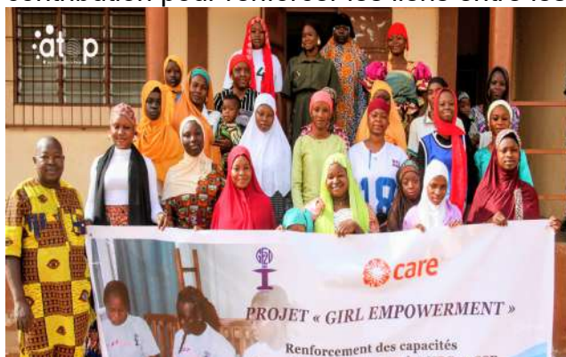
Des parties prenantes et les formateurs

favorables à la santé, afin de mieux protéger leur santé et leur avenir. L'assise a offert un espace d'échanges et de dialogue sécurisé, permettant aux unes et aux autres de partager leurs expériences, de renforcer leur confiance en elles et de développer une solidarité entre pairs. Un moment de convivialité autour d'un déjeuner collectif a été mis à contribution pour renforcer les liens entre les participantes.