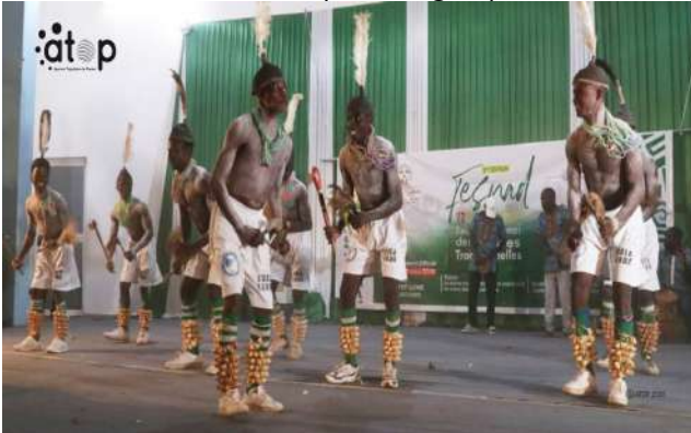
2ème groupe Kpatcha de Landa exhibant ses prouesses

L'édition 2026 du FESNAD est placée sous le thème « La danse traditionnelle : une expression de notre identité culturelle ». Elle a vu la participation de sept groupes folkloriques de la région. Il s'agit de : Assassa de Pitikita (Binah), Goumbede de Gandé (Assoli), N'yadjagbhé (Dankpen), Séguéré de Kabou (Bassar), Kpatcha de Landa (Kozah), Kountété de Lamba (Doufelgou) et Gnomr d'Ataloté (Kéran).