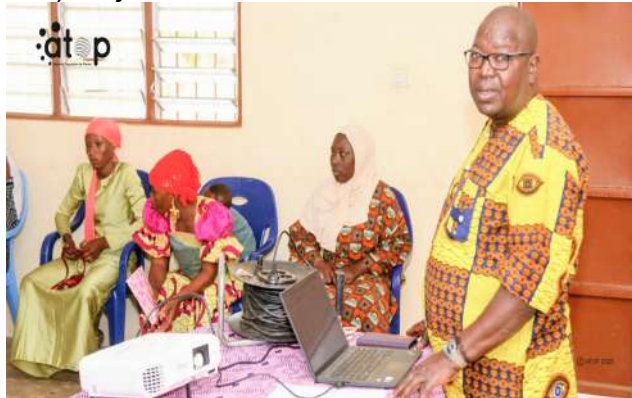
Le directeur renforçant les capacités des participantes à Bafilo.

La rencontre est initiée par le Groupe de réflexion et d'action femme, démocratie et développement (GF2D), en partenariat avec CARE Bénin-Togo. Elle a reçu l'appui financier et technique de Foundation for a just society international (FJSI).