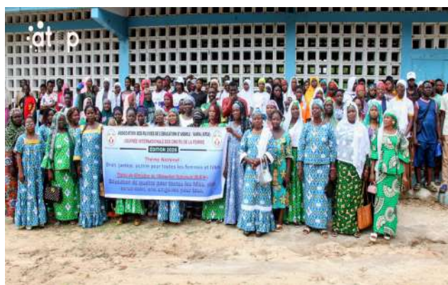
Des élèves et les membres de l'AFEA

La célébration a été ponctuée par une caravane animée par les femmes de l'AFEA, et une émission animée à la radio La voix et au Lycée de Bafilo ville. Les interventions ont mis en lumière la nécessité de renforcer le système éducatif pour les filles et d'encourager leur participation active aux instances de décision. Les échanges ont porté sur des thèmes tels que les causes de la déperdition scolaire, les comportements face au harcèlement