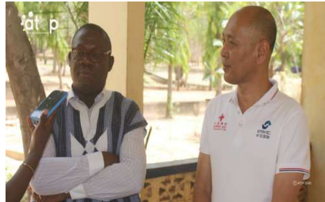
Le chef de délégation (à droite) se prononçant à l'issue de la visite

*Au Palais des congrès de Kara , les interventions ont visé l'optimisation des installations existantes. Outre l'installation de caméras de surveillance, dont l'efficacité a déjà été démontrée par l'appréhension d'individus malintentionnés, les techniciens ont assuré la maintenance des équipements de climatisation, des systèmes d'injection d'eau pour l'entretien de la pelouse, ainsi que des installations sanitaires et électriques.