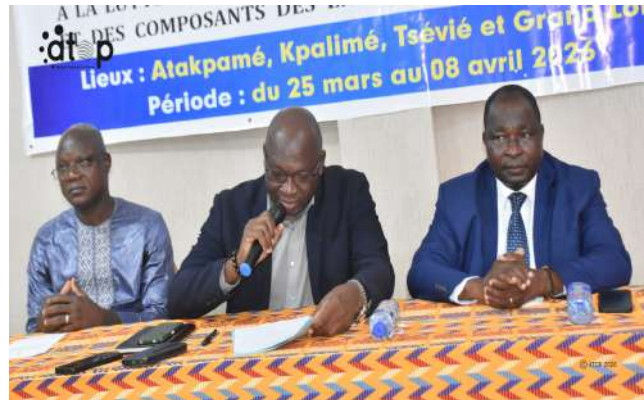
Le SG Dotsè (micro) à l'ouverture des travaux

Cette rencontre a réuni 32 délégués des syndicats de transporteurs, des conducteurs de véhicules, du conseil régional des chargeurs du Togo ainsi que des représentants des structures déconcentrées et décentralisées de l'Etat.