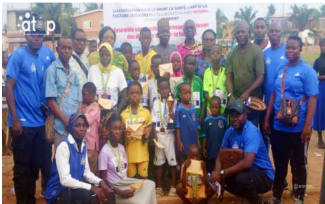
Athlètes et membres du bureau ASSACUL

Organisée à l'intention des élèves en situation de handicap, la compétition a rassemblé une cinquantaine de participants issus de onze établissements de la commune Agoè-Nyivé 4. Les jeunes athlètes se sont illustrés dans plusieurs disciplines, notamment le lancer de poids, la course de vitesse et les tirs au but.