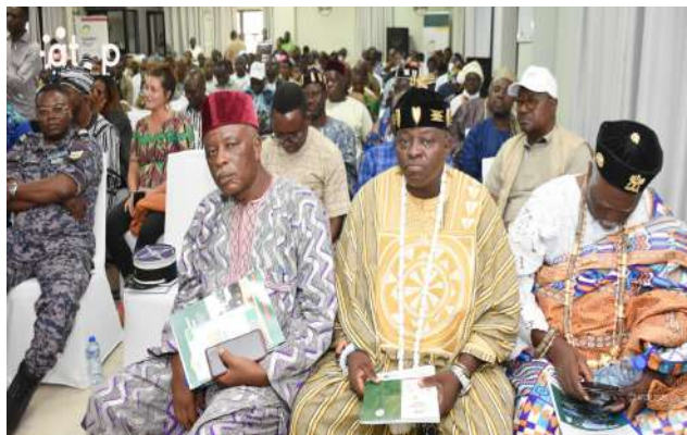
Des autorités, au devant les chefs traditionnels

L'initiative s'inscrit dans la mise en œuvre du projet « Gestion des déchets au Togo » (Gedec Togo) exécuté par Expertise France dans cinq communes du Togo notamment Ogoou 1, Zio 1, Tchaoudjo 1, Kozah 1 et Tône 1. L'objectif est de promouvoir un cadre de vie sain, propre et conforme aux normes modernes d'assainissement. Il est question, à travers cette action environnementale, de relever les défis liés à la salubrité urbaine et à la gestion responsable des déchets.