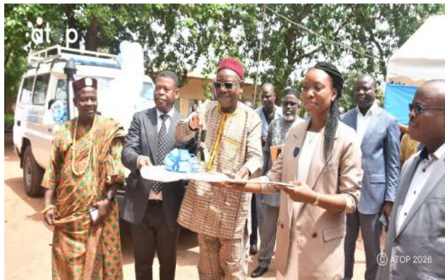
Le gouverneur remettant les clés à la directrice

Le gouverneur de la région Maritime, Taïrou Bagbiègue, a relevé que la santé demeure un pilier fondamental de toute politique de développement. A l'entendre, les difficultés liées aux évacuations sanitaires constituent encore un défi majeur dans la région Maritime et l'acquisition de cette ambulance médicalisée, sur la base du budget exercice 2025 du Conseil régional de la Maritime, est une réponse pertinente et concrète aux besoins des populations.