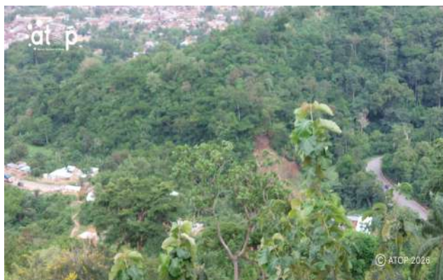
Vue partielle du relief des Plateaux