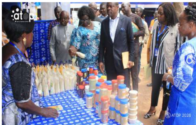
Visite des stands d'exposition

Des panels, entre autres, sur : « Formation et emploi des jeunes filles/femmes et personnes handicapées : défis, opportunités et rôle des institutions et employeurs », « Entrepreneuriat des jeunes, accès des promoteurs d'entreprises et d'AGR aux financements et aux informations fiscales de formalisation », « Handicap et employabilité : briser les préjugés et adapter le processus d'embauche et l'environnement professionnel pour une inclusion réussie »