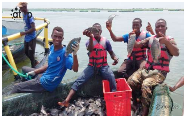
Des poissons capturés

La pêche est également pratiquée dans la région. Cette activité se déroule dans le barrage de Nangbéto et dans plusieurs rivières, lagunes et points d'eau. C'est sur le site de Nangbéto que les étudiants de l'IFAD de Elavagnon en formation en aquaculture font la pratique.