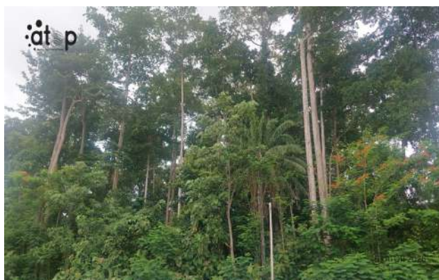
Une forêt dans le Kloto

Pour renforcer le développement de la région, plusieurs pistes sont régulièrement évoquées par les acteurs locaux. Il s'agit de la modernisation des infrastructures routières pour désenclaver les localités et améliorer l'accès aux sites touristiques, le renforcement de l'agro-industrie locale pour faciliter la transformation des produits agricoles sur place, et créer de nouveaux emplois.