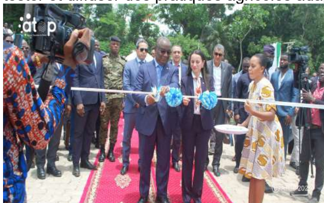
Coupure du ruban symbolique

d'approvisionnement en engrais et semences améliorées, des équipements de mécanisation, une ferme modèle ainsi que des parcelles de démonstration destinées à tester et diffuser des pratiques agricoles adaptées aux réalités locales.