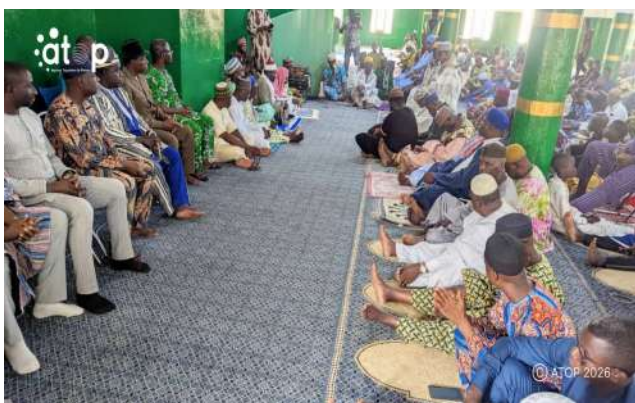
Fidèles et autorités dans la mosquée centrale à Sokodé

Sokodé, 24 avr. (ATOP) - Des prières musulmanes ont été dites dans les cinq préfectures de la Centrale, le vendredi 24 avril, en prélude à la célébration des 66 ans d'indépendance du Togo.