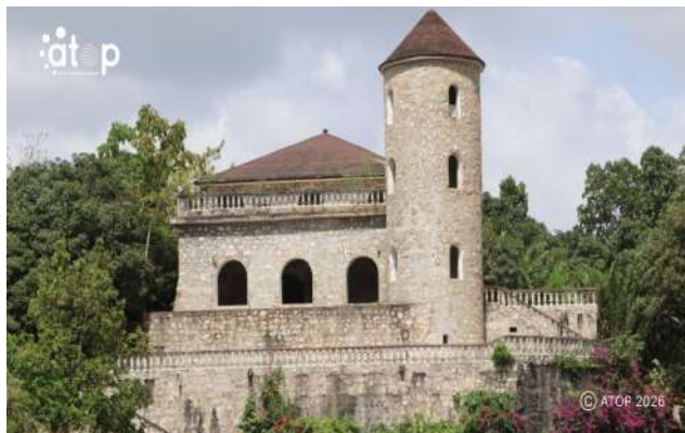
Chateau Vial, un site touristique

La population de toute la région des Plateaux est estimée entre 1,5 et 1,6 million d'habitants, avec une concentration notable autour de Kpalimé, principal pôle économique et touristique de la zone. Sa proximité avec Lomé, environ 120 kilomètres, soit près de deux heures de route, renforce son attractivité et facilite les échanges.