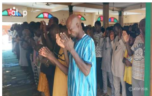
Prière à Tabligbo

Partout, les imams, entourés des prédicateurs et des maîtres coraniques ont demandé la bénédiction divine sur le Togo et ses dirigeants précisément, le Président du