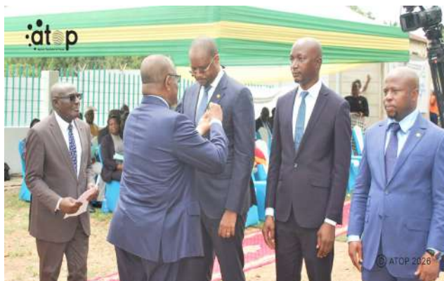
La décoration des personnalités au nom du Président du conseil

Une trentaine de personnalités civiles et militaires notamment des députés, des maires, des responsables de partis politiques et des chefs de services ont été élevées au grade de chevalier de l'ordre du Mono, en reconnaissance à leurs services rendus à la nation. En plus de la récompense, l'objectif de cette distinction est d'encourager les autres citoyens à s'engager pour le pays et valoriser l'excellence dans le service public.