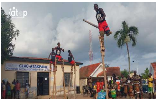
Prestation des échassiers

La région des Plateaux, chef-lieu Atakpamé, est la plus grande région du Togo, située à environ 165 km de Lomé. Elle compte 1.635.946 habitants selon le 5 e Recensement général de la population et de l'habitat (RGPH-5). Cette région est subdivisée en deux parties. Plateaux-Est avec huit préfectures (Ogou, Anié, Wawa, Akébou, Est-Mono, Moyen-Mono, Haho et Amou) et Plateaux-Ouest avec quatre (Kloto, Kpémé, Agou et Danyi). La région est gouvernée par le Général de brigade, Dadja Maganawé.