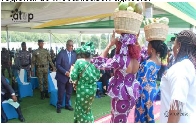
La réception des vivres au nom du président du conseil

Kpalimé, 24 avr. (ATOP) – Le président de l'Assemblée nationale, Prof. Selom Klassou a, au nom du Président du Conseil, décoré plusieurs personnalités civiles et militaires, le jeudi 24 avril à Kpalimé, en marge de la cérémonie d'inauguration du Centre régional de mécanisation agricole.