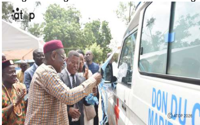
Coupure du ruban symbolique par le gouverneur

Par ce don, le Conseil régional de la Maritime entend contribuer à améliorer l'accès des populations à des soins de santé de qualité et à renforcer le dispositif de prise en charge des urgences médicales dans la région.