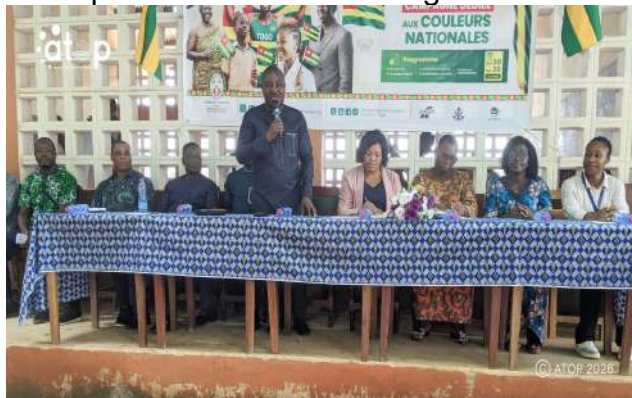
Intervention du directeur de la formation civique