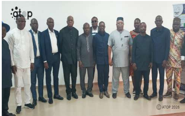
Les participants de la rencontre

Cette assemblée générale s'inscrit dans une dynamique de consolidation de la coopération entre le Bénin et le Togo, à travers leurs collectivités locales, pour un développement harmonieux et inclusif des zones transfrontalières du sud Bénin-Togo. Les travaux ont permis également aux maires d'apporter quelques amendements au règlement intérieur de l'organe.