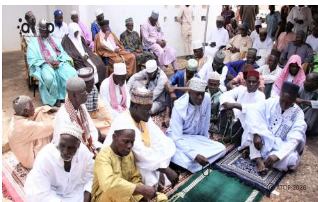
Les fidèles musulmans à la grande mosquée de Bafilo

cette fête au Créateur. Elles se sont déroulées en présence des autorités administratives, politiques, militaires et traditionnelles au-devant desquelles les représentants du pouvoir central.