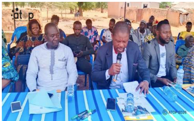
Le secrétaire général du gouvernement (micro)

la lutte contre le trafic des migrants, la traite des êtres humains et la protection des femmes et jeunes en situation irrégulière dans l'Afrique de l'ouest y compris la sous-région Sahel », financé par l'Union européenne (UE).