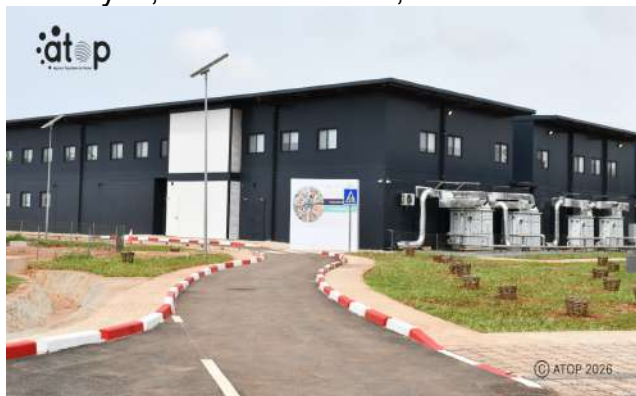
Vue partielle du bâtiment visité

Accompagnés des membres du gouvernement, du gouverneur du Grand Lomé, de l'Ambassadeur de France au Togo et d'autres personnalités, ces personnalités ont fait le tour des services d'imagerie (Mammographie, radiologie, CT Scanner, IRM, échographie), de dialyse, de cathétérisme, entre autres.