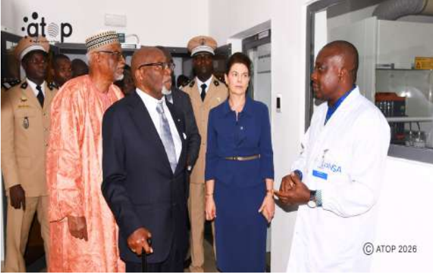
Visite des salles par le président

qualité de l'alimentation des populations. « Le secteur agricole est progressivement en train de professionnaliser les métiers de la production, de la transformation et de la commercialisation dans un processus de certification des produits agricoles et industriels de notre pays. Ce laboratoire nous appartient, il est au service du producteur, de l'industriel, du commerçant et à chaque citoyen soucieux de savoir ce qu'il mange et ce qu'il vend », a ajouté le gouverneur.