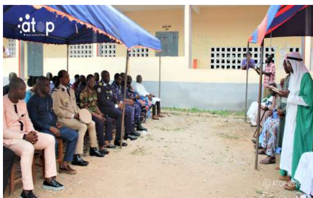
L'imam priant devant les autorités locales de Kloto

responsables et agents des responsables des forces de l'ordre et de sécurité ainsi le secrétaire préfectoral du parti UNIR.