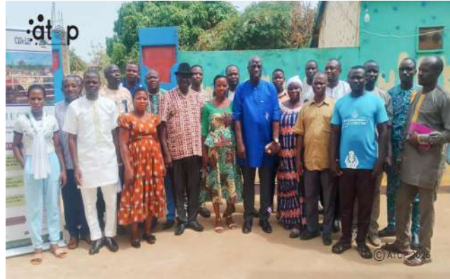
Les officiels et participants

L'atelier est organisé par l'ONG française Acting For Life (AFL) en collaboration avec l'ONG Gestion de l'environnement et valorisation des produits agropastoraux et forestiers (GEVAPAF) et la Convention intercommunale pour le développement local des Savanes (CIDeLS). Il a bénéficié d'un appui financier du Centre de crise et de soutien du ministère de l'Europe et des Affaires étrangères de la République française (CDCS). Cette formation est un volet du projet Appui aux communautés transfrontalières vulnérabilisées par l'insécurité et la fragilité (ACTIF), mis en œuvre dans les zones frontalières du nord du Togo, ainsi que de la Côte d'Ivoire, du Ghana et du Bénin.