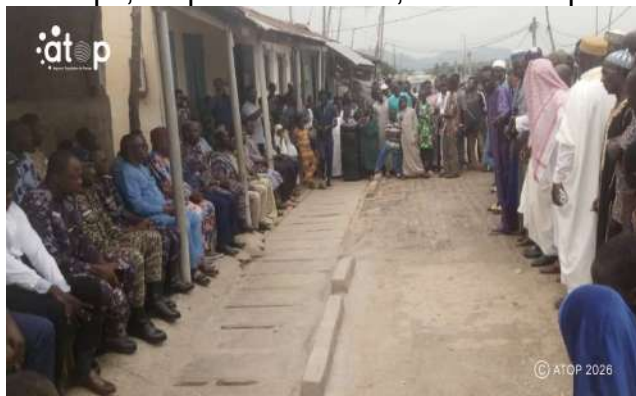
La prière à Adéta dans le Kpélé

développement de la préfecture et du bien-être des populations. Il a témoigné sa gratitude aux plus hautes autorités du pays pour leur engagement en faveur de la paix, la sécurité et le développement économique et social. L'imam a aussi prié pour le repos des âmes de ceux qui, au prix de leur vie, ont œuvré pour que le Togo retrouve sa souveraineté.