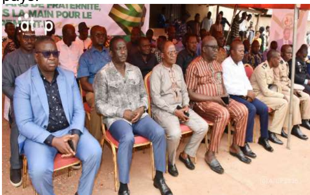
Des autorités à la prière musulmane à Atakpamé

Atakpamé, 24 avr. (ATOP) - Les musulmans des huit préfectures de la région des Plateaux-Est se sont mobilisés, le vendredi 24 avril, pour prier en faveur de la paix et de la prospérité du Togo en prélude à la célébration du 66 e anniversaire de l'indépendance du pays.