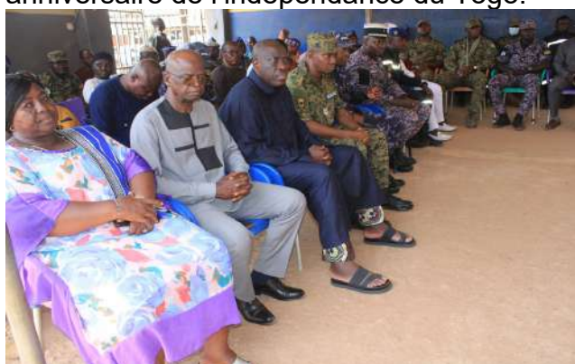
Les autorités présentes à Dapaong (Le préfet en bleu marine)

Dapaong, 24 avr. (ATOP) – Des prières musulmans ont été dites, le vendredi 23 avril, dans les préfectures de la région des Savanes, en prélude à la célébration du 66 e anniversaire de l'indépendance du Togo.