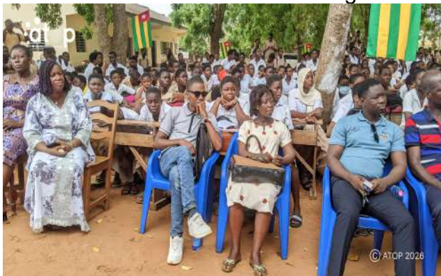
Des enseignants et les élèves

Les apprenants ont été éclairés sur les couleurs, l'historique du drapeau ainsi que les comportements à adopter lors de son usage à travers des échanges interactifs et des théâtres. Ils ont été édifiés sur la signification du drapeau national et son origine.