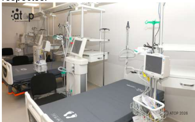
Salle de dialyse

Le ministre Barrot a souligné que l'exécution des travaux de rénovation de ces services du CHU-Campus de Lomé dont les portes s'ouvriront très prochainement, a été un partenariat gagnant-gagnant entre les deux pays. Le diplomate français a témoigné sa reconnaissance à tous les acteurs qui ont œuvré pour que les délais d'exécution soient respectés.