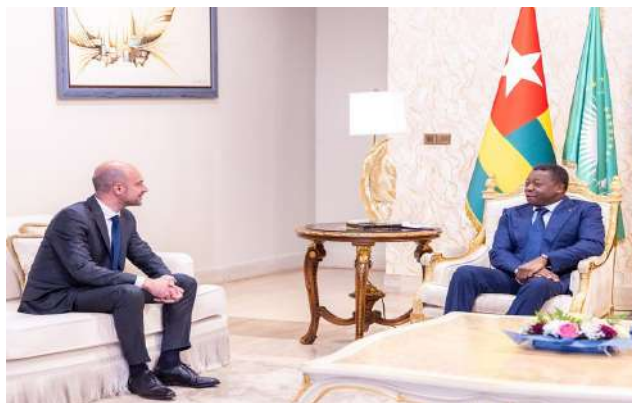
Le Président du Conseil et le ministre français

Les deux personnalités ont procédé à un examen approfondi des axes structurants de la coopération bilatérale, avec une attention particulière au partenariat économique et commercial.