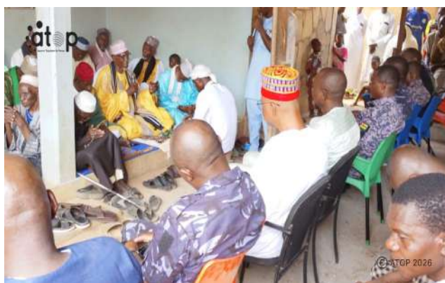
La prière à Cinkassé

Ces prières ont permis de rendre grâce à Allah pour les bienfaits accordés au Togo depuis son indépendance en 1960 jusqu'à ce jour. Il s'est agi également de confier la destinée du pays au créateur et d'intercéder pour la paix et la sécurité.