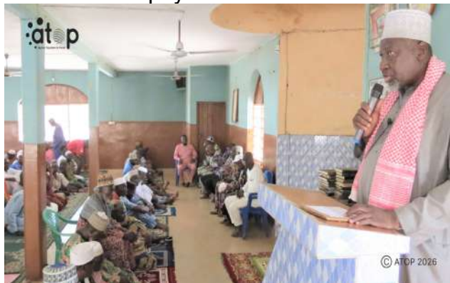
L'imam central de la ville de Kantè, (debout) lors de la prière