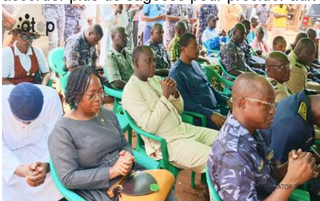
Diverses personnalités présentes à Tsévié

Conseil, Faure Gnassingbé. Ils ont rendu grâce à Dieu, félicité ceux qui se sont battus pour que le Togo accède à l'indépendance. Les fidèles de Mahomet ont remercié Allah, le Tout-miséricordieux pour sa grâce, sa protection et ses bienfaits dans la vie des Togolais. Ils ont supplié le créateur d'intervenir davantage dans la vie des dirigeants du pays, leur accorder plus de sagesse pour présider aux destinées du pays.