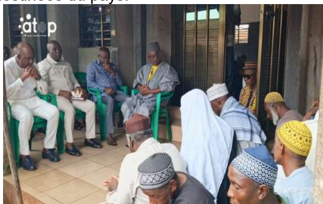
Prière à Tsévié

Les imams ont demandé aux fidèles de respecter l'autorité et d'être porteurs des valeurs citoyennes et civiques. Ils les ont invités à participer aux manifestations de cette année pour témoigner leur amour à la patrie, le patrimoine commun.