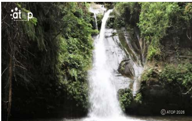
Une chute d'eau de la cascade de Womé

La région des Plateaux Ouest couvre une superficie estimée à près de 16 975 km 2 . Sa partie occidentale, sans délimitation administrative distincte, englobe plusieurs préfectures importantes telles qu'Agou, Danyi, Kpélé, Kloto, Wawa et Akébou. Cette zone partage une frontière directe avec le Ghana, faisant d'elle un corridor naturel d'échanges commerciaux et humains.