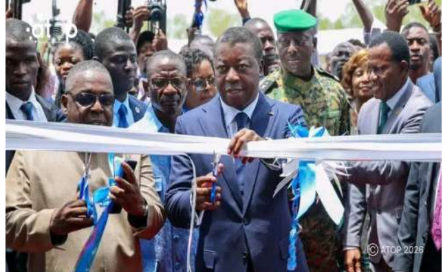
Le PC coupant le ruban symbolique

Ces nouvelles infrastructures pédagogiques et administratives offrent désormais un cadre idéal d'apprentissage et de transmission du savoir et du savoir-faire aux étudiants conformément aux exigences de la formation supérieure actuelle.