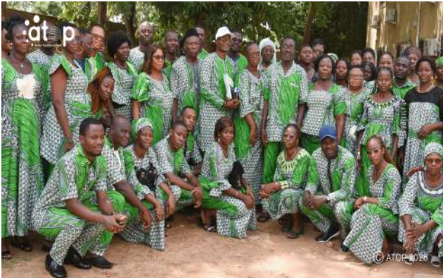
Anciens et nouveaux du bureau exécutif

Kara, 28 avr. (ATOP) – 52.606.946 FCFA , c'est le résultat excédentaire enregistré par la Coopérative d'épargne et de crédit de Kara (COOPEC-Kara), au titre de l'exercice 2025. C'est ce qui est ressorti de son assemblée générale ordinaire tenue le samedi 25 avril à Kara.