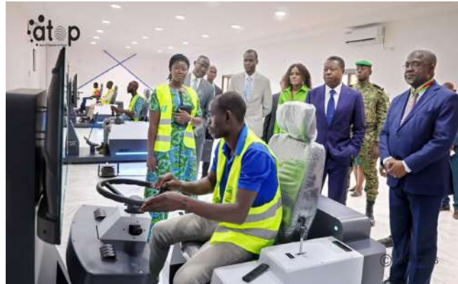
La visite des installations