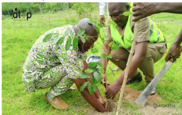
Séquence de rebondissements

Il serait aussi question de former et accompagner les coopératives sur les techniques de gestion des Activités génératrices de revenus (AGR) et faire le lobbying des produits locaux bio sur les NTIC. Cette formation va permettre de créer un emploi vert et réduire la pauvreté.