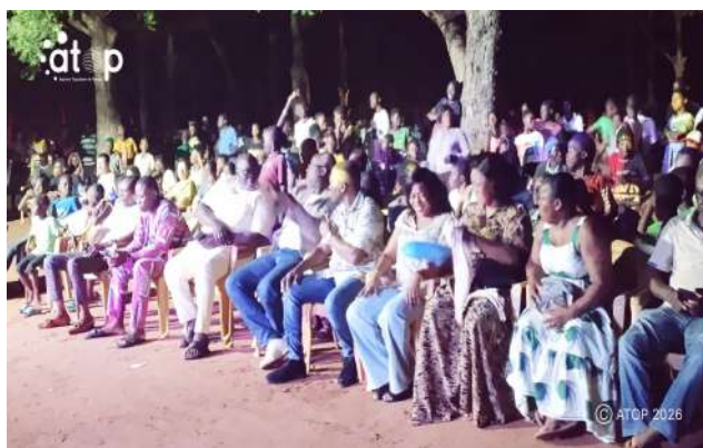
Le public et des officiels

L'évènement, organisé dans une ambiance festive et patriotique, a démarré à 21 heures par l'exécution de l'hymne national « Terre de nos Aïeux ». Sur un podium aménagé pour la circonstance et illuminé par des jeux de lumière, plusieurs artistes de la chanson togolaise ainsi que des talents locaux ont tenu le public en haleine.