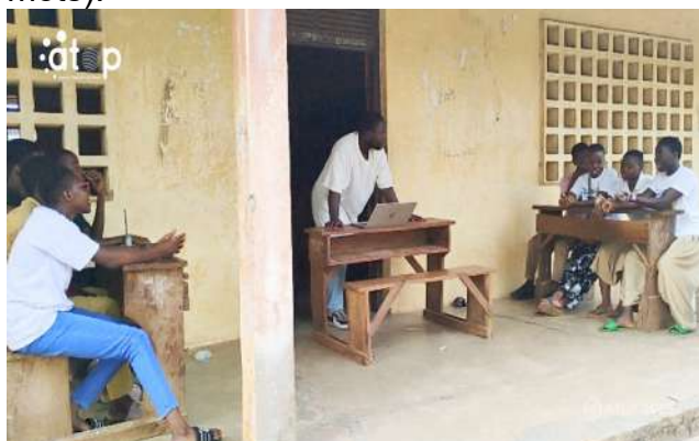
Le face à face des équipes finalistes