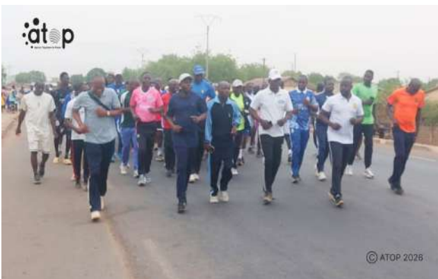
Une séquence de footing dans les rues de Mango

d'amitié et de cohésion sociale entre les populations civiles et les forces de défense et de sécurité.