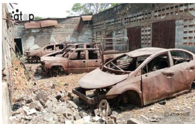
Les bâtiments d'un service public et ses équipements vandalisés

« Les biens publics servent à tous ; les dégrader nuit à l'ensemble de la communauté. Bien que l'Etat en ait la charge, chaque citoyen doit contribuer à leur entretien et à leur protection. C'est une responsabilité partagée », a indiqué M. Tchakpala. Il a également mis en avant l'obligation de préserver les biens communs pour les générations futures et aussi pour éviter de subir la rigueur de la loi.