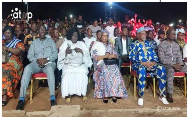
Les autorités locales (en première ligne) savourant le spectacle

Dapaong, 28 avr. (AATOP) – Un concert gratuit s'est tenu le lundi 27 avril sur l'esplanade du gouvernorat de la région des Savanes dans le cadre des festivités marquant le 66 e anniversaire de l'indépendance du Togo.