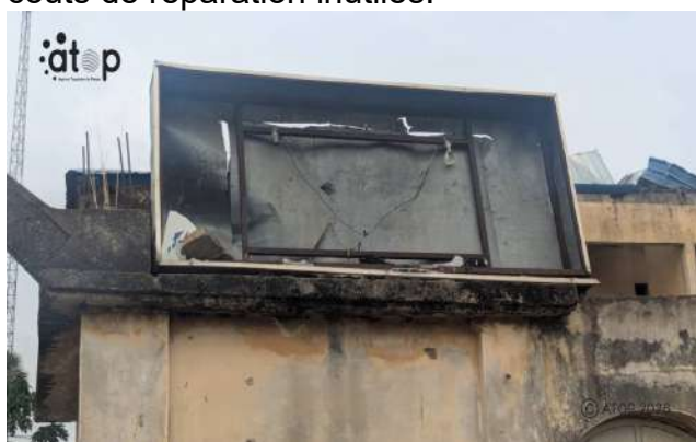
L'enseigne lumineuse d'un service public détruite

La protection des biens publics est un devoir citoyen fondamental. Ces biens (écoles, routes, hôpitaux, forêts classées, parcs) appartiennent à la collectivité. Leur préservation est essentielle pour assurer la continuité des services publics et éviter des coûts de réparation inutiles.