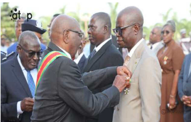
Le Président de la République décore un acteur

stabilité du pays. Trois récipiendaires parmi eux, ont été faits officiers de l'Ordre du Mono, en reconnaissance de leurs services éminents à la République. Cinq autres ont été élevés au grade de chevalier du même ordre, saluant leur dévouement et leur participation au développement national. Une personnalité a, par ailleurs, été élevée au rang de commandeur de l'Ordre du Mono, tandis qu'une autre a été faite commandeur national de l'Ordre du Mérite.