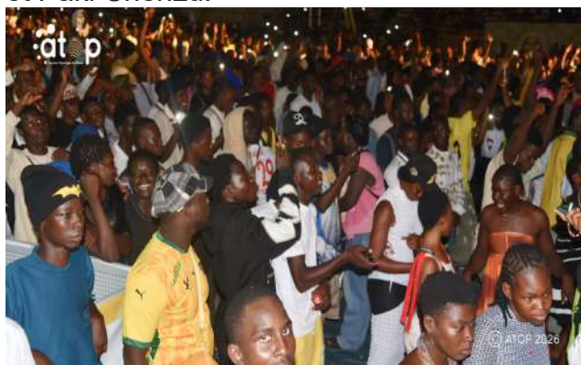
La foule lors...