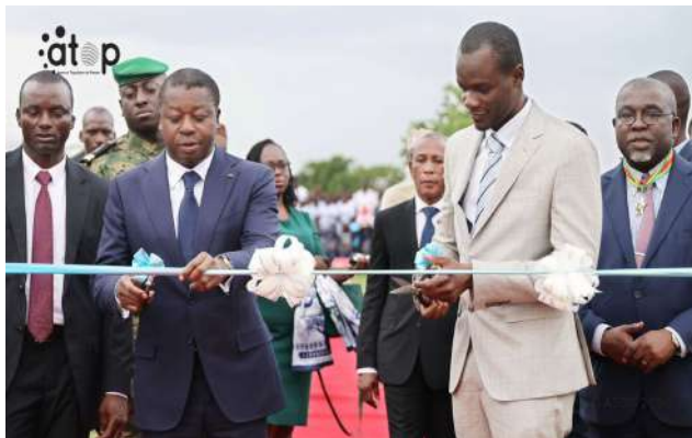
Le PC et le DG du Groupe procédant à la coupure du ruban

La cérémonie a réuni des membres du gouvernement, des parlementaires, des autorités administratives, politiques, militaires et traditionnelles, ainsi que des partenaires techniques et financiers et de nombreux producteurs. Cette infrastructure vise à moderniser les pratiques agricoles et à accroître la productivité dans la région de la Kara.