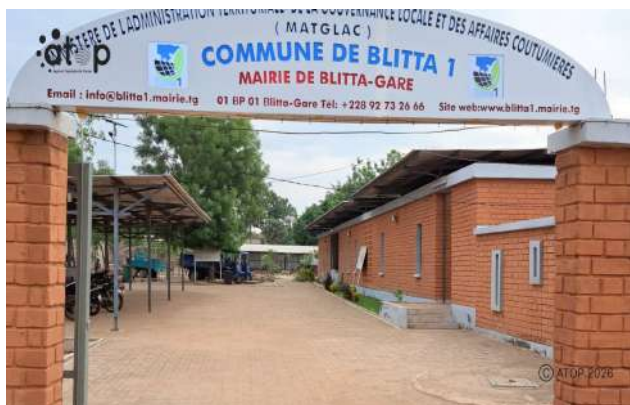
Entrée principale de la mairie de Blitta 1

L'orateur affirme que les mécanismes de contrôle externe, comme les audits, sont essentiels pour prévenir les fraudes, la corruption et le détournement de fonds, assurant que l'action publique est conforme aux lois. Il assure que le contrôle de l'action publique favorise, en outre, la démocratie participative en donnant aux citoyens et à la société civile un droit de regard sur les processus de développement. M. Pakoubotcho a précisé que ce contrôle est particulièrement efficace au niveau