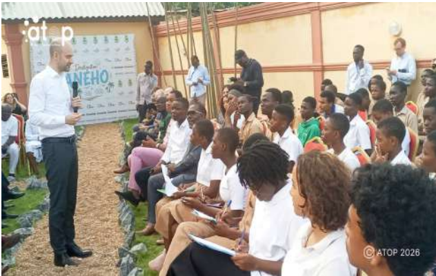
Le ministre Barrot échange avec les élèves

les deux pays. Elle permet, par ailleurs à la diplomatie française, de préparer le sommet « Africa Forward » coorganisé par la France et le Kenya les 11 et 12 mai prochain à Nairobi.