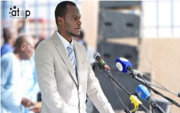
Le DG lors de son intervention BKG

Construit par le Groupe Bonkougou Distribution (BKG) sur un site de trois hectares, le CRMA de Tchitchao s'inscrit dans le cadre d'un partenariat public-privé avec l'État togolais pour une durée de 25 ans. Le projet se décline en deux phases. La première, consacrée à la construction des infrastructures, comprend notamment trois entrepôts d'une capacité totale de 9.000 tonnes, des blocs administratifs, des salles de formation et des aires de pratique. Elle s'achève avec l'inauguration du centre. La seconde phase, dédiée à l'équipement, à l'exploitation et à la maintenance, nécessitera un investissement de plus de 13 milliards de FCFA.