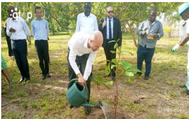
Le badamier mis en terre