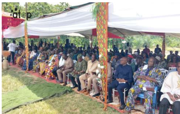
Les différentes personnalités

La remise de l'arrêté a été précédée de la cérémonie d'intronisation traditionnelle d'un nouveau chef marquée par le port de la couronne et des chaussures (Hiniba), l'installation du nouveau chef sur son trône royal et la remise de la canne.