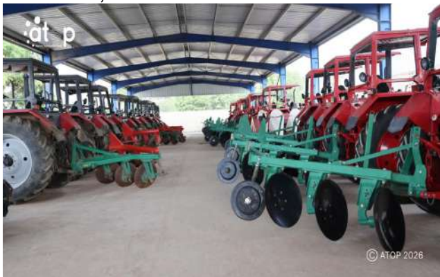
Un des entrepôt des engins

Kara, 28 avr. (ATOP) - Le Président du Conseil, Faure Gnassingbé, a inauguré le vendredi 24 avril à Kara, le Centre régional de mécanisation agricole (CRMA) de Tchitchao, dans la commune Kozah 2.