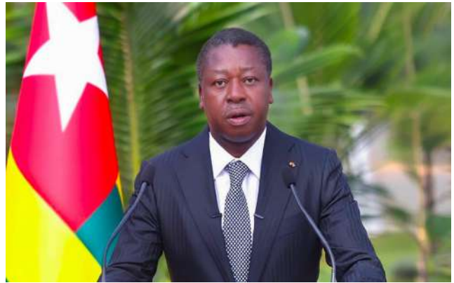
Président du conseil

Lomé 28 avril (ATOP) - A l'occasion du 66 e anniversaire de l'indépendance de la République togolaise, célébré le 27 avril, le Président du Conseil, Faure Gnassingbé, a livré un message centré sur la responsabilité collective liée à l'indépendance et la nécessité d'accélérer la consolidation de la souveraineté nationale. Dans un discours solennel, le chef du gouvernement a appelé les togolais à transformer l'héritage de 1960 en progrès concret pour les populations.