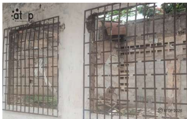
Un autre bâtiment d'un service public vandalisé

Le bien public est un bien de l'Etat ou des collectivités territoriales destiné à la satisfaction de l'intérêt général. Il est constaté de plus en plus dans le pays que la préservation de ces biens devient problématique. Pendant que certains citoyens pensent que la préservation de ces biens est de la responsabilité des autorités, d'autres, surtout de l'administration publique, estiment que c'est une responsabilité qui incombe à tous.