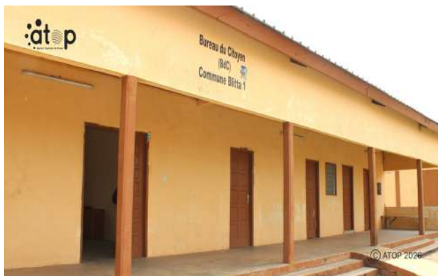
Le bureau du citoyen de la commune Blitta 1

Le contrôle de l'action publique consiste à associer la population et le citoyen à la gouvernance publique. La bonne gouvernance fait appel à l'idée de transparence, de clarté, de redevabilité, et de gestion rationnelle des ressources. Partant de ces définitions, y a-t-il un lien entre le contrôle de l'action publique et la bonne gouvernance ? Et quels sont les défis à relever dans ce sens par le Togo ?