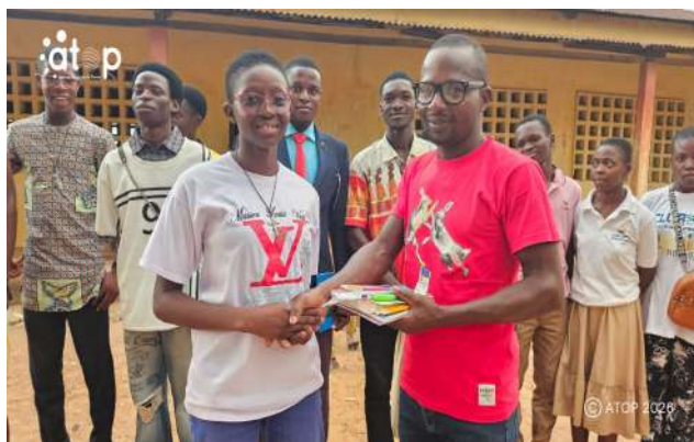
Remise de prix

L'évènement se veut un cadre de valorisation du mérite scolaire et de renforcement des capacités intellectuelles des apprenants à travers la lecture, l'esprit critique et la réflexion. La compétition a réuni des équipes de plusieurs établissements, entre autres, les collèges Koukou et Père Brungar ainsi que les lycées Marie Romano et Niamtougou. Les candidats se sont affrontés dans diverses disciplines, notamment la culture générale, les mathématiques, les sciences et l'expression orale (épellation correcte et audible des mots).