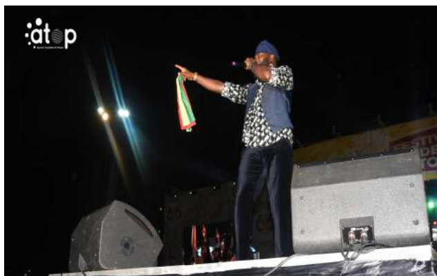
...de la prestation d'un artiste

Aux côtés de ceux-ci on notait aussi des artistes venus d'ailleurs, notamment, Innoss'B du Congo, Enam du Ghana et Vano Baby du Benin qui ont tenu en haleine le public rassemblé pour la circonstance.