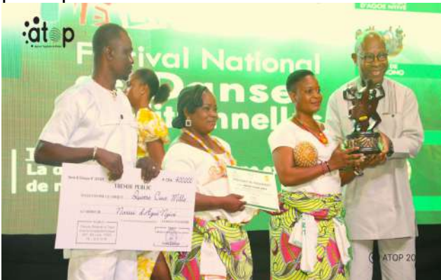
Remise de trophée par le ministre Tchiakpé

Lomé, 28 avr. (ATOP) - La 9 e édition du Festival national des danses traditionnelles du Togo (FESNAD) a connu son apothéose le samedi 25 avril à Lomé, avec la distinction de douze meilleures troupes issues des phases régionales. Chaque groupe primé est reparti avec un chèque de 400 000 francs CFA, un trophée et une attestation de participation.