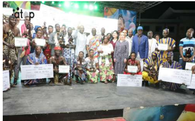
Lauréats et officiels

Placée sous le thème « La danse traditionnelle : une expression de notre identité culturelle », cette édition a mis en exergue le rôle central de la danse comme vecteur de mémoire collective et d'affirmation identitaire. A travers rythmes, gestes et symboles, les différentes prestations ont illustré la richesse des patrimoines locaux, transformant chaque chorégraphie en récit vivant chargé d'histoire et de sens.