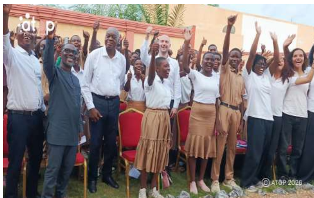
Les autorités et les élèves

Aného, 28 avr. (ATOP) - Le ministre de l'Europe et des Affaires étrangères de la France, Jean-Noël Barrot a effectué une visite, le vendredi 24 avril à Aného, pour constater les travaux des projets réalisés dans le cadre de la coopération décentralisée entre la commune Lacs 1 et le département des Yvelines en France.