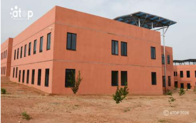
Un des bâtiments vu de profil

Le nouveau complexe architectural de l'UK, fruit d'un partenariat public-privé avec le groupe Envol Immobilier, s'étend sur une surface de près de 18 600 m 2 . La première phase de ce projet évalué à plus de 15 milliards de francs CFA a consisté à construire cinq bâtiments majeurs, que sont le bloc administratif abritant la présidence de l'Université, la Faculté des Sciences de la Santé (FSS), l'Institut Supérieur des métiers de l'Agriculture (ISMA), l'Institut Polytechnique et de l'Innovation (IPI), ainsi qu'un restaurant universitaire moderne conçu selon l'architecture traditionnelle togolaise (apatam).