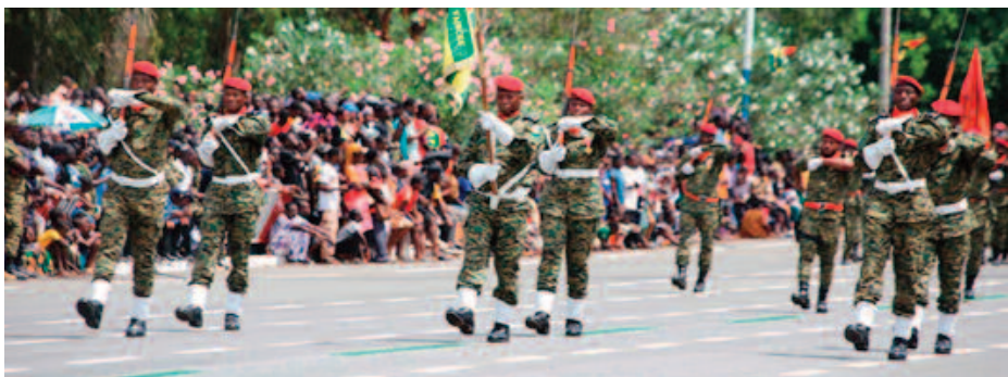
Passage des parachutistes commandos

La diversité culturelle a rayonné à travers les danses traditionnelles, complétée par une ouverture internationale via l'Institut Confucius, avec la danse du