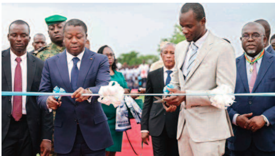
Le Président du Conseil avec le DG de BKG

Construit par le Groupe Bonkoun-gou Distribution (BKG) sur un site de trois hectares, le CRMA de Tchitchao s'inscrit dans le cadre d'un partenariat public-privé avec l'État togolais pour une durée de 25 ans. Le projet se décline en deux phases. La première, consacrée à la construction des infrastructures, comprend notamment trois entrepôts d'une capacité totale de 9.000 tonnes, des blocs administratifs, des salles de formation et des aires de pratique. Elle s'achève avec l'inauguration du centre. La se-