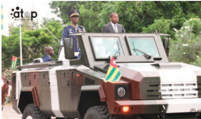
L'arrivée du Président du Conseil ( en costume)

La célébration du 66e anniversaire de l'accession du Togo à la souveraineté internationale a été marquée, le lundi 27 avril à Lomé, par un défilé militaire, paramilitaire et civil, sous les regards du Président du Conseil, Chef suprême des Armées, Faure Gnassingbé.