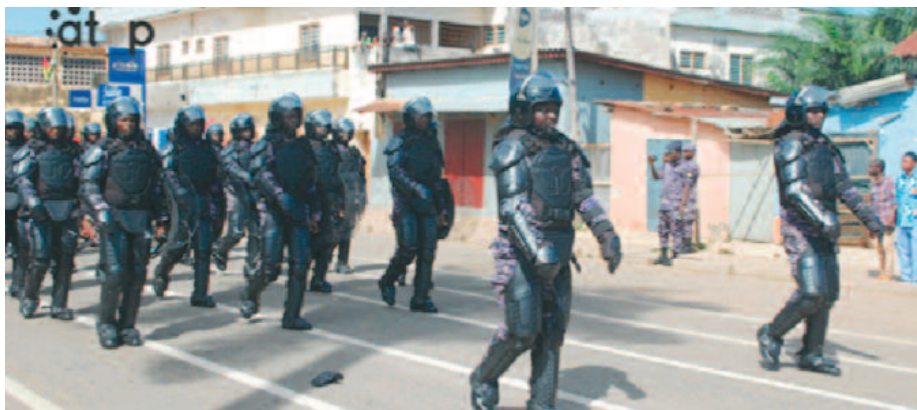
La brigade anti émeutes

Les préfectures de la région des Plateaux-Ouest ont célébré, le lundi 27 avril, le 66e anniversaire de l'accession du Togo à la souveraineté internationale, à travers des défilés militaires, paramilitaires et civils marqués par une forte mobilisation des populations.