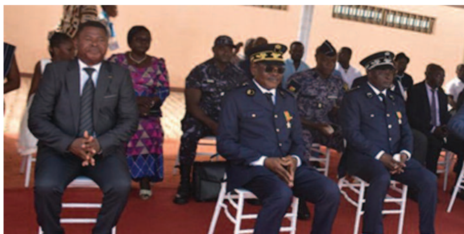
On reconnaît au milieu, le Gouverneur

À Tsévié, le défilé a débuté aux environs de 9 heures, après l'arrivée du gouverneur de la région Maritime, Tairou Bagbiègue, qui a reçu les honneurs militaires, suivi de l'exécution de l'hymne national. Le commandant des troupes, le capitaine Essodomnei