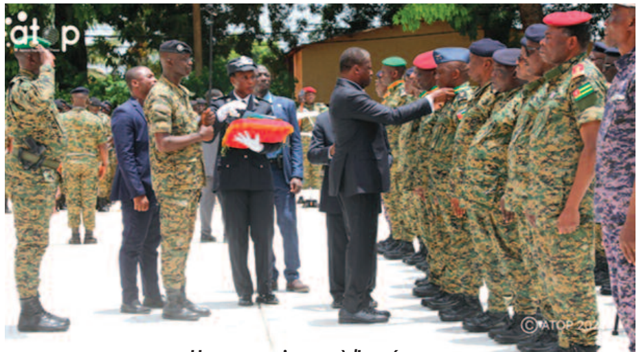
Une reconnaissance à l'armée

Au total, près d'une centaine de militaires, issus de différents corps des forces armées, ont été distingués pour leur intégrité, leur sens du devoir, leur courage et leur engagement constant au service de la nation. Au-delà de sa portée hautement sym-