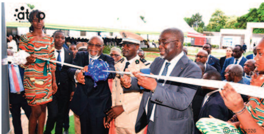
Coupure symbolique du ruban du bâtiment de LaNSA

Le LaNSA est un laboratoire dédié principalement aux analyses chimiques et microbiologiques, ainsi qu'au développement de techniques analytiques. Structure interministérielle, il a été mis en place par le gouvernement pour assurer l'évaluation scientifique des risques sanitaires liés aux aliments. En plus de contribuer à la sécurité alimentaire, il accompagne les opérateurs économiques notamment ceux des agropoles, des coopératives agricoles et de l'industrie agroalimentaire dans les processus de certification de leurs produits, aussi bien pour le marché national qu'inter-