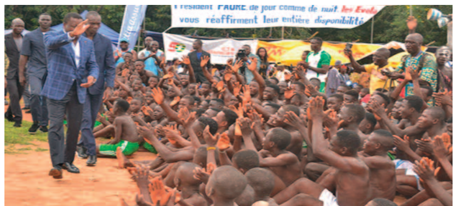
Le Président du conseil fière d'une jeunesse dynamique

La région de la Kara, avec ses principaux groupes ethniques Kabyè, (majo-