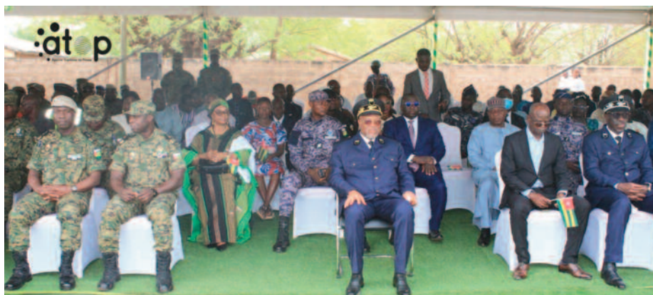
Le gouverneur (milieu) et sa suite