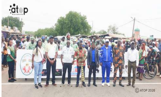
Les autorités avant le départ de Kantè