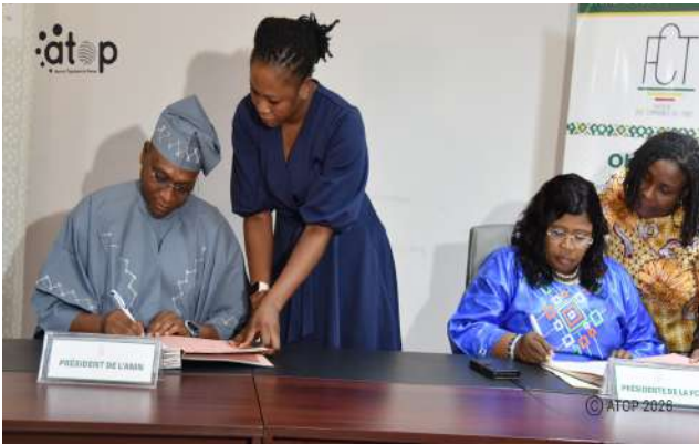
Signature de protocole entre les 2 faitières décentralisation entre le Niger et le Togo.

Ce partenariat s'inscrit dans le cadre d'un partage d'expériences entre les communes du Togo et la délégation de l'association des municipalités du Niger.