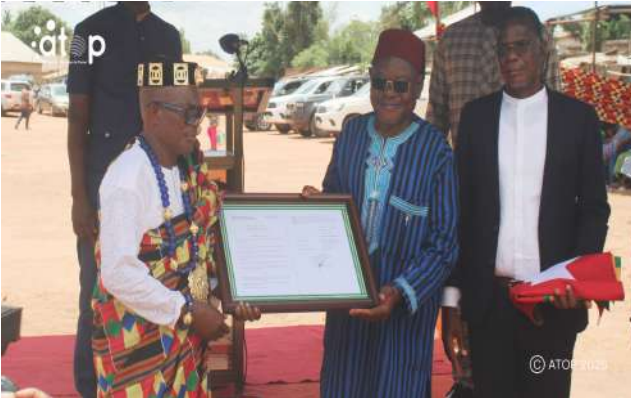
Remise du décret

et une foule en liesse. Ce document permet au chef d'être le garant des us et coutumes, de veiller à l'harmonie et à la cohésion sociale. Il lui confère un pouvoir d'arbitrage et de conciliation des parties en matière coutumière.