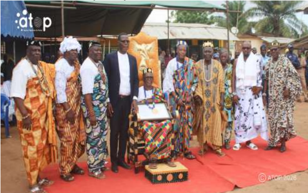
Le nouveau chef et ses pairs de Vo