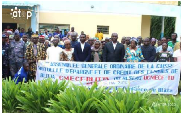
Les officiels et les participants

Les différents rapports révèlent qu'au 31 décembre 2025, la CMECF-Blitta comptait 597 membres. 327.394.025F CFA ont été débloqués pour 70 dossiers de prêts, alors qu'en 2024 la caisse avait octroyé 242.339.000F CFA de crédits en faveur de 569 membres, soit une augmentation de 35% en valeur. Les difficultés rencontrées sont liées, entre autres, à la fluctuation des prix des produits, au non-respect des échéances de remboursement des crédits et à la présentation des clients aux guichets pour les retraits importants sans avertissement préalable. Les adhérents ont été invités à honorer à leurs engagements, à respecter les horaires de la caisse, à souscrire à l'assurance agricole et avertir la caisse à l'avance pour des retraits conséquents.