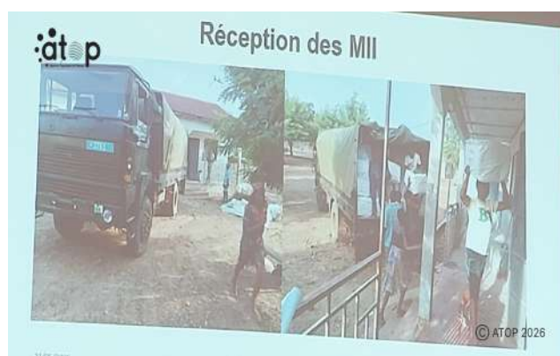
Une séquence de la réception des ballots de MII

Les membres du comité ont suivi la présentation du rapport d'étapes des activités déjà réalisées, celles en cours de réalisation et les prochaines étapes. Ils ont échangé sur divers aspects permettant de prendre des mesures nécessaires pour garantir le bon déroulement de cette campagne de distribution.