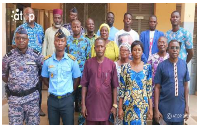
Les membres du CLO-Lacs