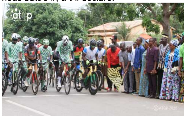
Départ de Bassar

objectif reste de remporter une étape et, avec la grâce de Dieu, nous allons continuer à nous battre », a-t-il déclaré.