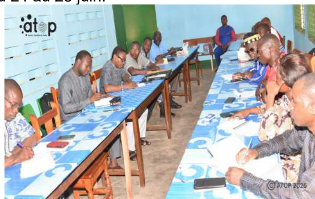
...les membres à une implication effective

Il a été précisé que le recensement se fera selon la stratégie de porte-à-porte menée par des équipes sanitaires, alors que les populations devront se rendre sur des sites dédiés pour le retrait des moustiquaires durant la phase de distribution.