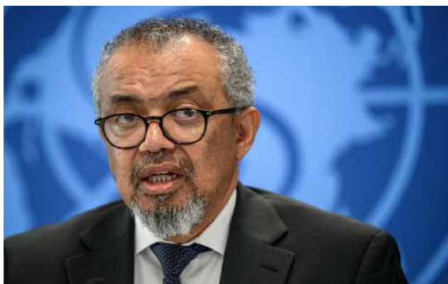
Le directeur de l'OMS

Ouganda, 21 mai (ATOP) – Lors d'un point de presse sur l'épidémie d'Ebola en République démocratique du Congo (RDC), le mardi 20 mai en Ouganda, le directeur général de l'Organisation mondiale pour la santé (OMS), Tedros Adhanom Ghebreyesus, a indiqué avoir déclaré deux jours plus tôt, une urgence de santé publique de portée internationale face à l'épidémie de maladie à virus Ebola en RDC et en Ouganda. Une première pour un directeur général dit-il de faire une telle déclaration avant la réunion d'un Comité d'urgence.