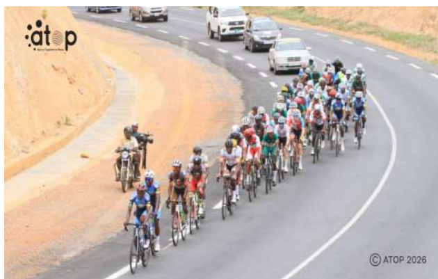
Les cyclistes bravant des obstacles (montée)