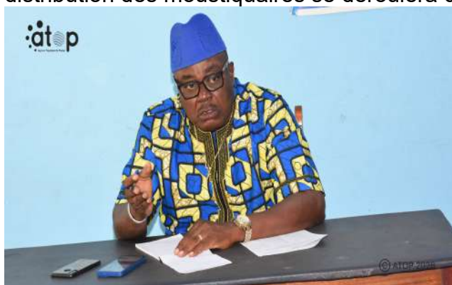
Le préfet exhortant...

populations. Le recensement des ménages est prévu du 26 mai au 6 juin, tandis que la distribution des moustiquaires se déroulera du 24 au 28 juin.