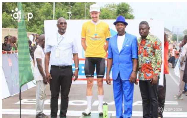
Le Belge (maillot jaune) avec des officiels