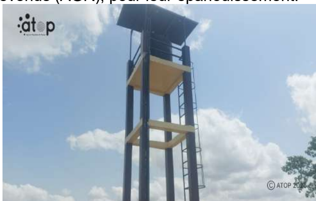
Le château du forage

« ACTIF » est un projet multi-pays qui intervient dans les zones transfrontalières du nord de la Côte d'Ivoire, du Ghana, de la Guinée-Conakry, du Bénin et du Togo. D'une durée de 18 mois, il vise, entre autres, à promouvoir la cohésion sociale entre les autochtones et les déplacés frappés par la crise du Sahel et installés au Togo, à renforcer les moyens de subsistance des populations et à améliorer la gouvernance des dynamiques agropastorales. Il est exécuté dans les communes des Savanes et de la Kara. ATOP/TT/JK/HKM