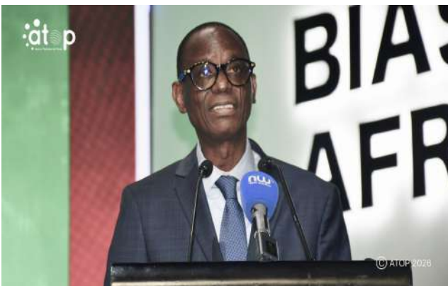
Le ministre Patoki lors de son discours de clôture

Lomé, 21 mai (ATOP) - Le ministre de l'Economie et de la Veille stratégique, Badanam Patoki, a officiellement clos, le mercredi 20 mai à Lomé, les travaux de la troisième édition du Forum d'affaires de la Zone de libre-échange continentale africaine (ZLECAf), « Biashara Afrika 2026 ». Il a souligné que les résultats enregistrés confirment le passage des intentions aux actions concrètes pour faire de l'intégration économique africaine un moteur de croissance et de prospérité partagée.