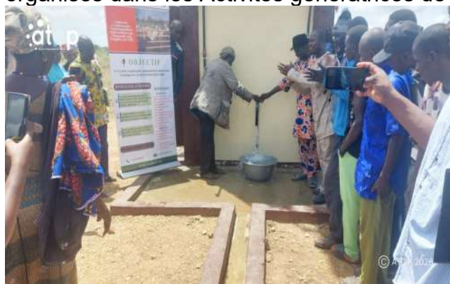
Les autorités inaugurant le forage