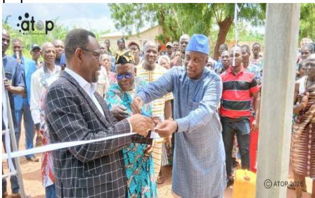
La coupure du ruban symbolique

Cette infrastructure hydraulique constitue une réponse concrète aux besoins des habitants de Sétékpo en matière d'accès à l'eau potable. Elle contribue à réduire les difficultés d'approvisionnement en eau et améliorer les conditions sanitaires des populations bénéficiaires.