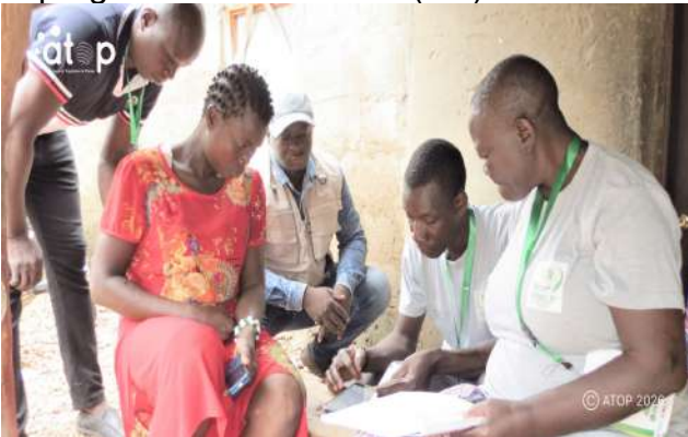
Les agents enregistrant les informations d'un ménage

Kantè, 26 mai (ATOP) - L'opération de dénombrement des ménages dans le cadre des préparatifs de la 6 e campagne nationale de distribution gratuite de Moustiquaires imprégnées d'insecticides (MII) a démarré le mardi 26 mai à Kantè.