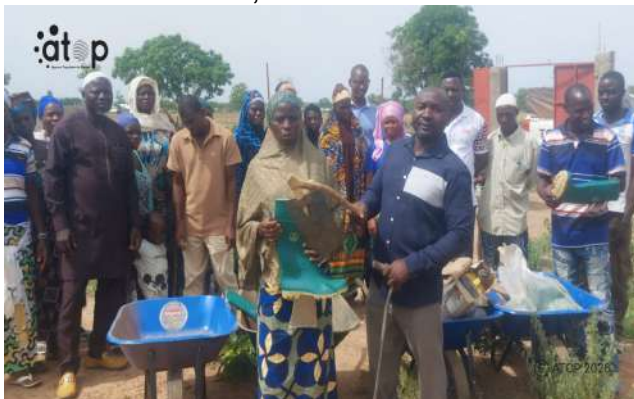
Remise du matériel agricole au groupe du canton de Kountoiré

Mango, 26 mai (ATOP) – Une cérémonie de réception définitive de sites maraichers et champs-écoles au bénéfice des coopératives « Djimuan » et « Limaklbe » respectivement dans les cantons de Takpamba et Kountoiré s'est déroulée le jeudi 21 mai sur les deux sites, dans la commune Oti sud 2.