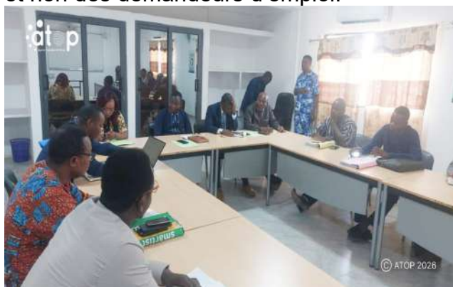
Réunion entre les superviseurs et les membres du jury