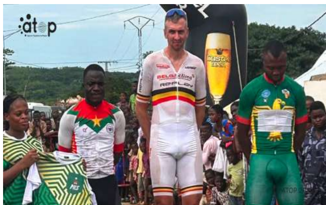
Le vainqueur de l'étape 3

niveau général de la compétition s'est considérablement élevé cette année. « La performance n'a pas été celle que nous espérions. Nous avons constaté une nette progression du niveau des équipes engagées. De plus, notre effectif ne compte pas nos principaux leaders. Les meilleurs coureurs sont restés au pays pour préparer d'autres échéances, notamment le Tour du Cameroun », a-t-il expliqué.