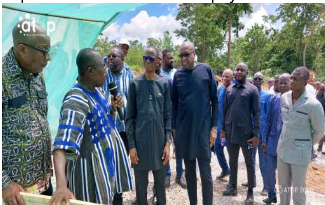
Visite des installations