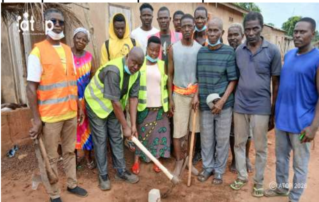
La pose de la première pierre

Tabligbo, 26 mai (ATOP) – L'ONG Amis de poubelle (ADP) a organisé, le samedi 23 mai, une opération de salubrité couplée du lancement de la construction de latrines publiques dans le quartier Kpodavé à Zafi dans la commune Yoto 2.