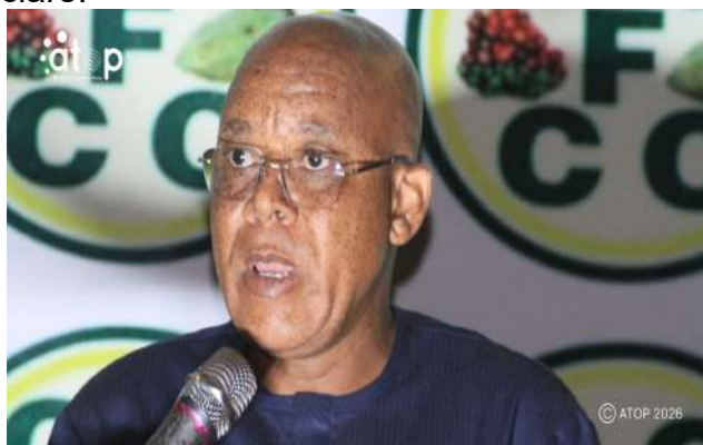
Le président de la FTC lors de son allocution