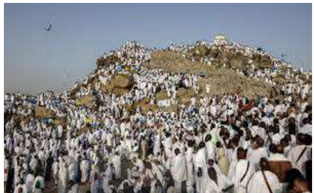
Rassemblement des pèlerins au mont Arafat