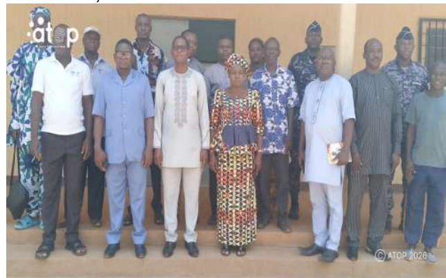
Les membres du CLO Binah

A Atakpamé, dans la préfecture de l'Ogou , les membres du CLO ont été formés sur leurs rôles et responsabilités. Cette rencontre, initiée par le Programme national de lutte contre le paludisme (PNLP), a permis d'harmoniser les stratégies de communication autour du message : « Une moustiquaire pour deux personnes ». Le préfet de l'Ogou, Ekpé Kodjo Agbéko Noël, a appelé à une forte mobilisation des acteurs. La directrice