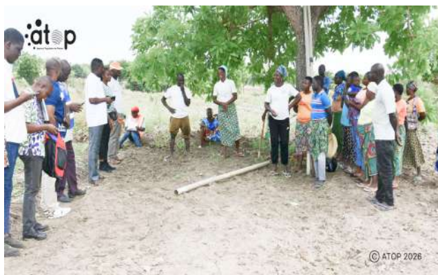
Séance d'échanges entre coopérateurs et équipe de mission financier du ministère allemand de la coopérative économique et du développement (BMZ) et de l'organisation CBM.

Les aménagements concernent spécifiquement les sites maraichers d'Atchangbadè (commune Kozah 4), d'Agbang (Kozah 3) et de Soré (Assoli 2), au profit direct des coopératives agricoles locales Lounguiyèda Haraou, Lidaw et Essowavakou.