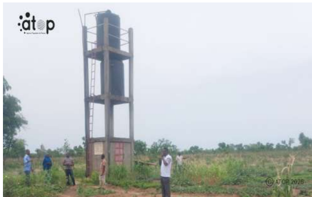
Visite du site de la coopérative de Kountoiré

L'activité est organisée par l'Institut africain pour le développement économique et social (INADES-Formation Togo). La réception s'est déroulée en présence des partenaires techniques : Association des personnes handicapées motivées de Tône (APHMOTO), la Fédération nationale des maraichers du Togo (FENAMAT) et l'Union régionale des organisations des producteurs des céréales des Savanes (UROPE-S). Elle s'inscrit dans le cadre de la 2 e phase du projet Sécurité alimentaire inclusive et résilience au Togo (SAIRT 2) financé par l'ONG Allemand « Cbm » et la Banque mondiale.