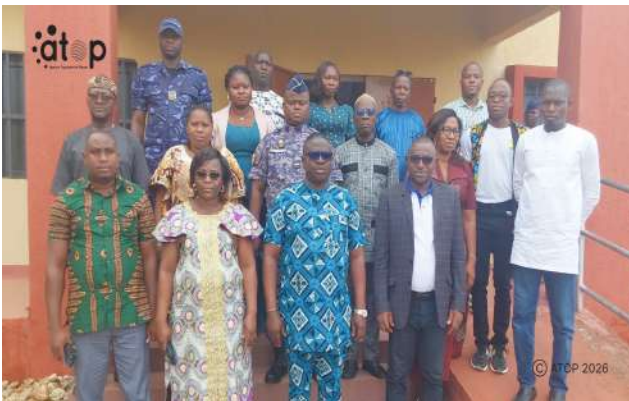
Des membres du CLO Ogou