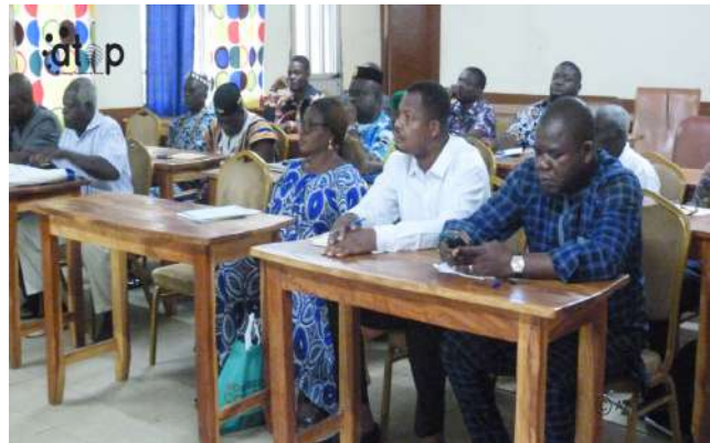
L'assistance à Notsè