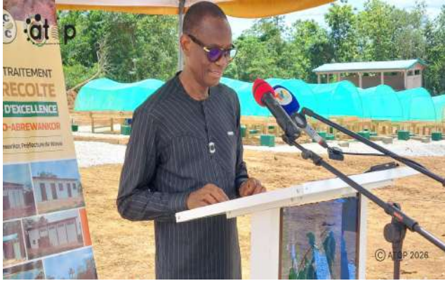
Le ministre Patoki lors de son discours

Le centre a été réalisé grâce à l'appui technique et financier du Comité de coordination pour les filières Café et Cacao (CCFCC) à hauteur de 160 millions de FCFA. Cette infrastructure ambitionne de valoriser davantage la qualité des fèves de cacao togolais sur le plan international pour une meilleure plus-value.