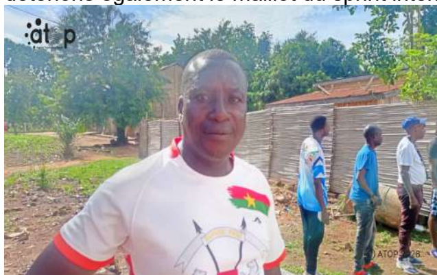
Le directeur sportif burkinabè