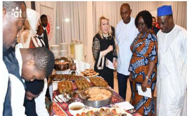
Les participants lors de la dégustation

La semaine de la cuisine de la Turquie se déroule du 21 au 27 mai. Le dîner de gala a réuni la population turque au Togo, des personnalités administratives et politiques du Togo ainsi que des invités.