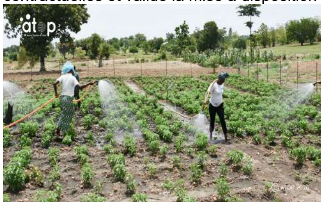
La coopérative Lidaw d'Agbang arrosant les plants de piment

Les visites de terrain ont permis aux différents acteurs de constater la levée totale des réserves formulées lors des réceptions provisoires. Les techniciens ont apprécié le fonctionnement des équipements installés, les normes techniques et les spécifications contractuelles et validé la mise à disposition définitive des ouvrages.