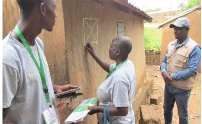
Marquage d'un domicile après le dénombrement

Des sessions de formations ont été déjà organisées au profit des superviseurs de district et de proximité ainsi que des agents de santé communautaires qui feront office d'agents dénombrement. Les agents distributeurs suivront également une formation mais après l'opération de dénombrement qui prend fin le 7 juin prochain. Tous ces acteurs de la Santé accompagneront les membres du CLO de la campagne dans la mise en œuvre efficace, harmonisée et coordonnée de toutes les activités liées à la sensibilisation, à la distribution et à l'usage efficient des 89.650 Moustiquaires imprégnées d'insecticides (MII) mises à la disposition de la population locale. ATOP/PAP/DHK