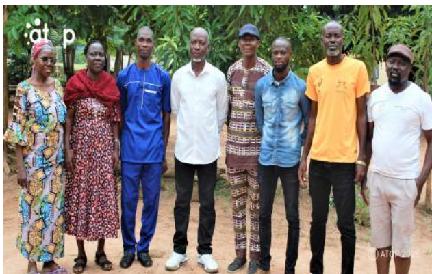
Les membres du bureau élu

Le rapport d'activités 2024-2025 de l'ATPST a mis en lumière les actions menées à travers des programmes sportifs axés sur le développement social, l'inclusion et l'égalité des sexes. D'après le rapport, le programme de football féminin a touché 120 adolescentes à travers des entraînements, tournois, sensibilisations et émissions radio visant le leadership féminin, le maintien scolaire et la santé reproductive. Le rapport précise que des progrès notables ont été observés en confiance soi, assiduité scolaire