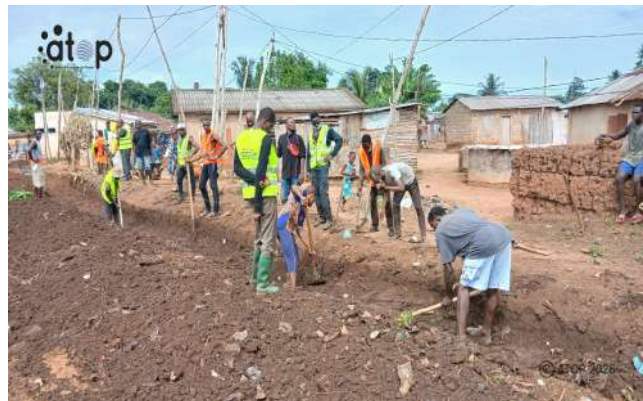
Le curage des caniveaux

L'initiative s'inscrit dans le cadre des actions communautaires de l'ADP en faveur de l'assainissement et du bien-être des populations.