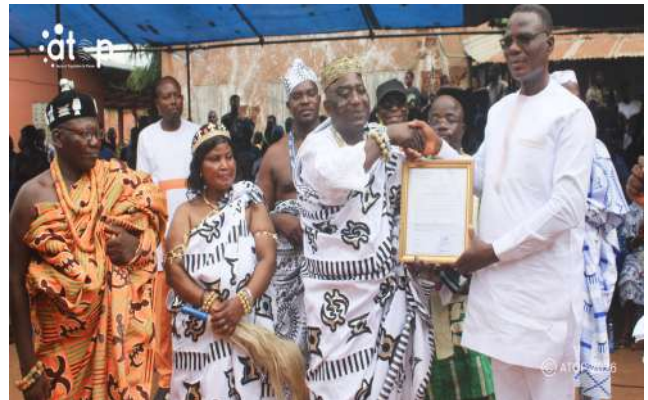
Remise de l'arrêté au nouveau chef (2ème de la droite)