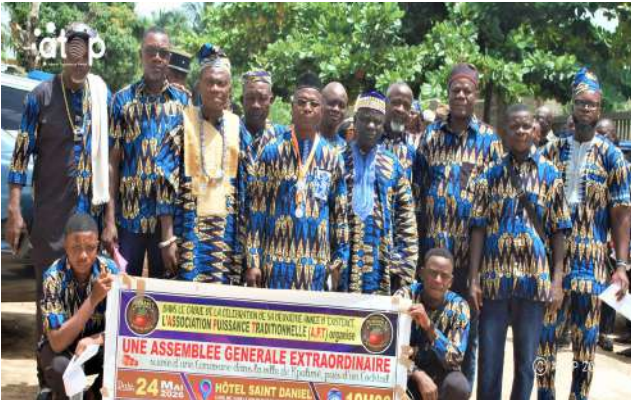
Les membres du bureau

Kpalimé, 26 mai (ATOP) – Les délégués membres de l'association « la Puissance traditionnelle » ont révisé des dispositions des statuts et du règlement intérieur de leur organisation, le dimanche 24 mai à Kpalimé, au cours d'une assemblée générale extraordinaire (AGE).