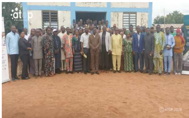
Le CR-CESP Kara et participants

leur disposition par l'administration fiscale.