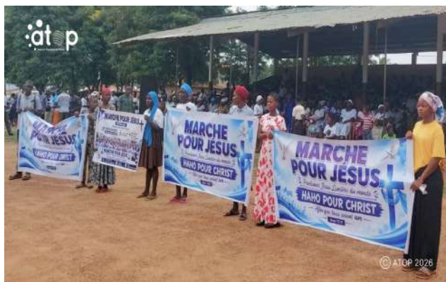
Le point de chute de la marche