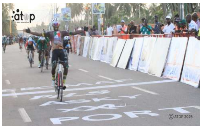
Le Camerounais, vainqueur de la dernière étape