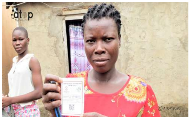
Une responsable de ménage brandissant son coupon

Cette opération a mobilisé dans la Kéran 37 superviseurs de proximité et 4 superviseurs au niveau du District ainsi que 111 équipes de 222 agents de dénombrement repartis dans les 13 formations sanitaires. Cette étape de la campagne permettra d'identifier tous les occupants de chaque ménage relevant du ressort territorial de la Kéran. Il s'agira pour chaque équipe de faire du "porte à porte" selon sa zone de couverture, afin de recenser le nombre de personnes vivant dans un ménage. Chaque ménage recevra un coupon qui lui permettra de bénéficier de moustiquaire lors de la campagne de distribution.