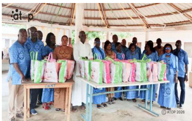
Des membres de l'association et des kits

accidentés pris en charge au service de traumatologie. Cette action humanitaire entre dans le cadre de la célébration des 40 ans d'implantation de l'ordre dans la ville.