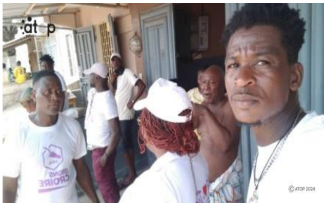
Campagne porte à porte de BATIR