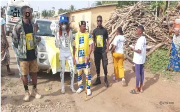
Le départ de la caravane au siège de PDP à Notsé

Lomé, 19 avr. (ATOP) - Le Parti démocratique panafricain (PDP) Tchamba a effectué des opérations de charme dans les communes de Tchamba et de Haho respectivement les 17 et 18 avril dans le cadre du double scrutin du 29 avril prochain.