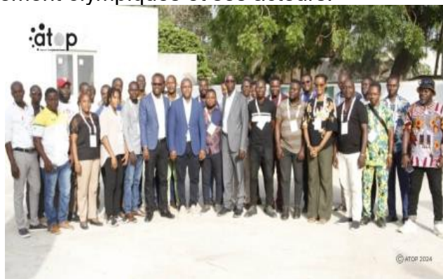
Les journalistes sportifs et les officiels

Plusieurs communications sont inscrites à l'agenda de cet atelier, notamment « Le CNO-Togo à l'ère des réformes ; Le CNO-Togo et ses textes ; Les journalistes sportifs face aux défis du numérique et Les programmes de la solidarité olympique ; Le Togo en route pour les JO Paris 2024 ; Couvrir un événement sportif international : cas des Jeux Olympiques et JO Paris : procédure d'accréditation ».