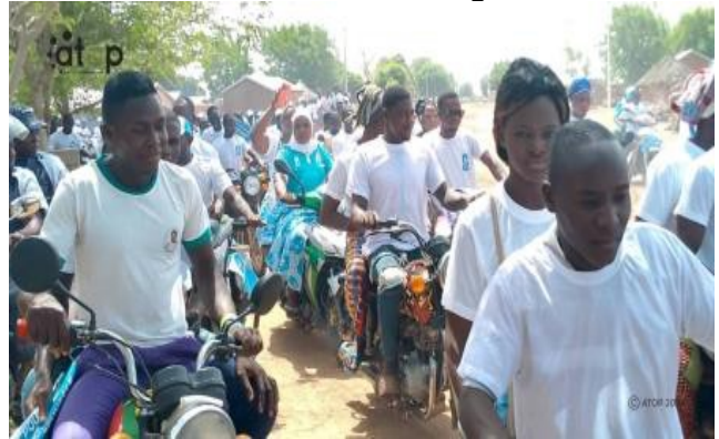
Les caravaniers dans les grandes artères de Mandouri

Partout dans ces localités, ces meetings ont mobilisé des militants, sympathisants et la population. Ces rencontres ont permis de présenter les candidats du parti UNIR aux élections législatives et régionales du 29 avril prochain et de montrer aux populations comment voter utile en évitant des bulletins nuls.