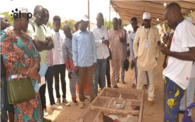
Un exposant expliquant la production locale des volailles

des activités de fin de la première phase du projet SAIRT dont l'objectif général est de contribuer à améliorer les conditions de vie économique, sociale et sanitaire des producteurs agricoles dont les personnes handicapées des communautés rurales des régions bénéficiaires.