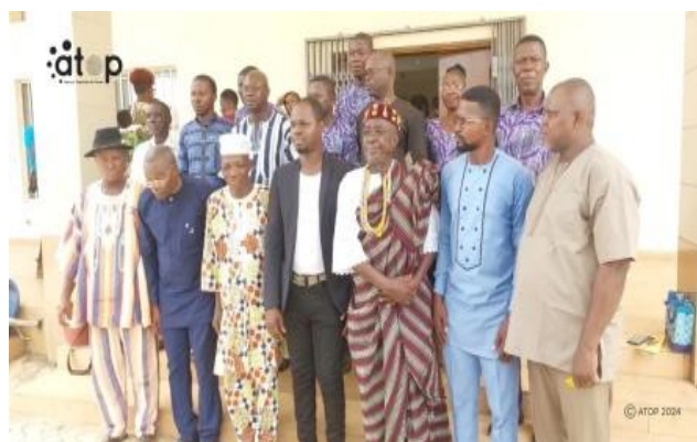
Les responsables de la CECAV et les autorités communales

L'assise a permis aux membres de l'institution de suivre le rapport moral et financier du comité de gestion et des organes techniques notamment les comités de crédit et de surveillance. Ils ont adopté également le procès-verbal de l'assemblée générale 2023. Il ressort des rapports que cette institution financière est passée de 13 millions en 2022 à 27 millions à 2023, occupant la 3 è place dans le classement des microfinances.