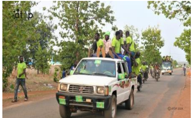
La caravane à Sanda-kagbanda et Sanda-Afohou