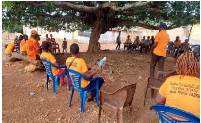
Le message du candidat ANC aux militants dans Agou

A Agou-Gadzépé , les militants et sympathisants du parti politique Alliance nationale pour le changement de la préfecture d'Agou (ANC-Agou) ont sillonné les artères de la commune Agou 1. Vêtus de T-shirts et de casquettes à l'effigie du parti, les caravaniers ont sillonné les différentes localités de la commune Agou 1, entre autres, Tsèvikopé, Djamakondji, Atigbé Dzogbépimé et Atigbé Abayémé pour appeler les militants et sympathisants à voter les candidats de l'ANC.