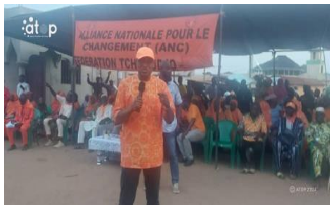
Jean-Pierre Fabre s'adressant à ses militants à Sokodé

Le président de l'Alliance nationale pour le changement (ANC), Jean-Pierre Fabre était dans le Tchaoudjo et l'Assoli où il a mobilisé l'électorat pour les candidats de son parti à travers des caravanes et des meetings qui ont permis de présenter les représentants de son parti à ces élections dans ces préfectures.