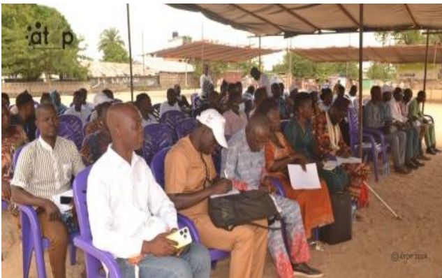
Les participants à la cérémonie...

Kara, 19 avr. (ATOP) – La première édition de la Foire des produits alimentaires agroécologiques de la Kara (FoPA- Kara) a démarrée, le jeudi 18 avril à Kara sur le terrain du CEG Tomdè, autour du thème : « Replacer les vivres de souveraineté dans les systèmes alimentaires, gage d'un développement économique et social dans les communes de la Kara et ses environs ».