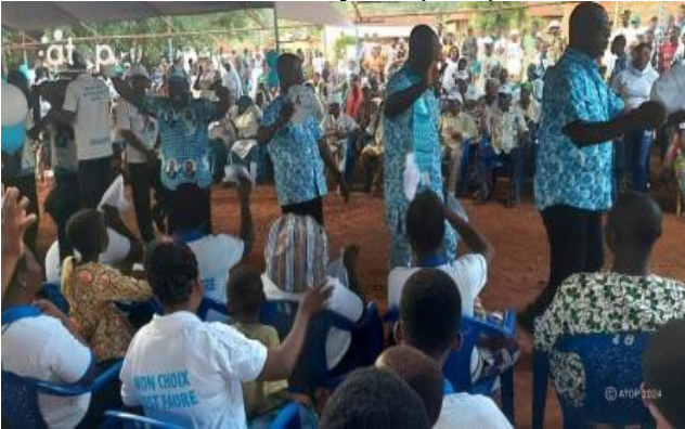
Les candidats saluant les militants à Agou-Gadzépé

Lomé, 19 avr. (ATOP) - Le parti Union pour la République (UNIR) est à la conquête de l'électorat dans le cadre de la campagne du double scrutin du 29 avril prochain, le jeudi 18 avril à Agou-Gadzépé (Agou), Mandouri (Kpendjal), Kantè (Kéran) et Sotouboua puis le mercredi 17 avril à Anyron (Avé) à travers des caravanes suivies de meetings.