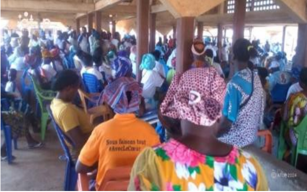
Des participants aux meetings