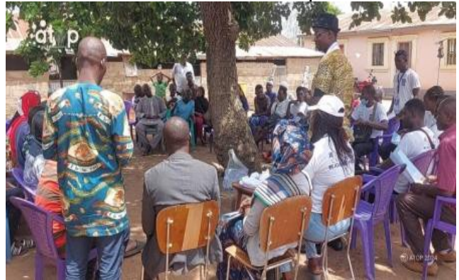
L'étape de Koussountou dans Tchamba

Ces opérations ont permis de présenter aux électeurs les projets prioritaires du parti, et ses ambitions et la nécessité de plébisciter les candidats du PDP au scrutin 29 avril prochain pour le développement du pays. Il a été question également de les présenter les candidats du parti à ces différents scrutins, et les instruire sur la manière adéquate de voter, à l'aide des spécimens de bulletins de vote.