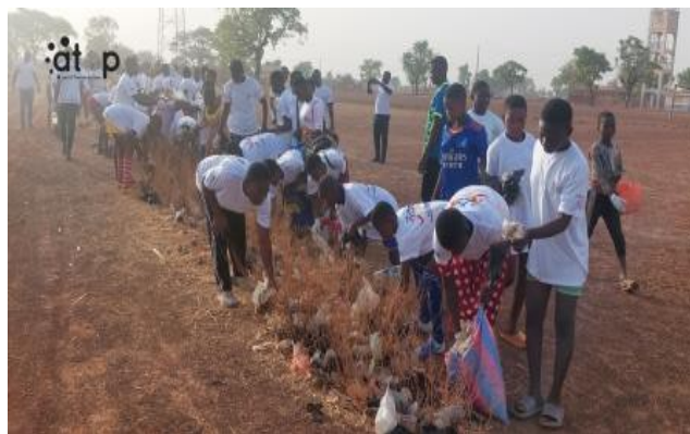
Ramassage aux alentours du lycée de BARKOISSI

A Barkoissi , ils étaient nombreux à participer à cet éco-jogging. Arborant des tee-shirts et des gangs médicaux, ces jeunes et femmes ont fait quelques tours de terrains en petites foulées ponctuées de ramassage de sachets qui jonchent les alentours du terrain du lycée de Barkoissi dans une ambiance bon enfant. Les déchets compilés dans des sacs sont déversés dans un tricycle pour la décharge finale. Des exercices physiques ont marqué la fin de cet éco-jogging. Les participants ont été instruits sur l'urgence de pratiquer les activités sportives et d'entretenir son cadre environnant et de protéger le couvert végétal.