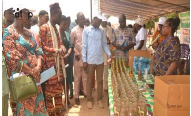
Les officiels devant le stand d'exposition de jus

Durant trois jours, les 140 participants dont les exposants à ce rendez-vous commercial auront des rencontres « B to B » pour nouer des relations partenariales. Ils découvriront les différents mets locaux dérivés des produits agricoles du terroir à travers une dégustation et une approche alimentaire centrée sur l'information, l'éducation et la communication sur l'alimentation saine et durable issue des produits alimentaires locaux agroécologiques.