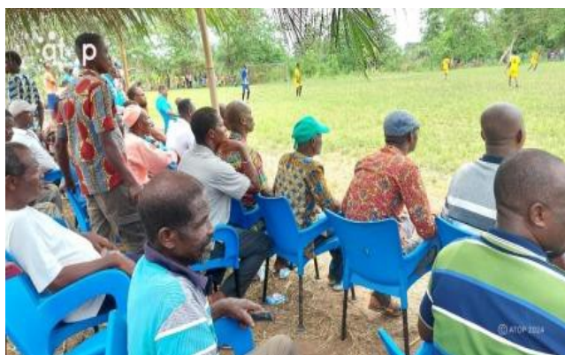
Le public apprécie une phase de jeu

les sensibiliser et leur expliquer les raisons de voter la liste Honneur aux paysans (HP).