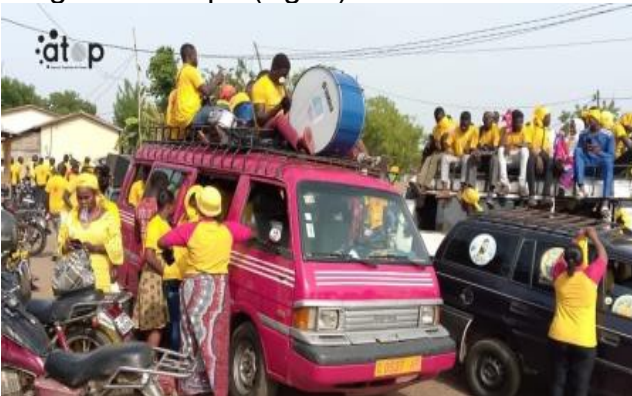
Vue partielle de la Caravane dans la ville de l'Anié

Lomé, 19 avr. (ATOP) - Les militants et sympathisants de l'Union des forces de changement (UFC) ont poursuivi la campagne électorale en vue des élections législatives et régionales du 29 avril par une caravane et un meeting, les 17 et 18 avril à Anié (Anié) et à Agou-Gadzépé (Agou).